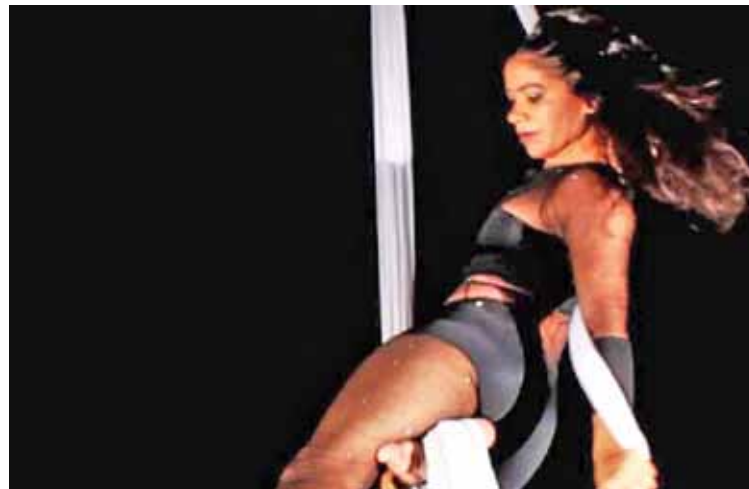
Mota es meticulosa a la hora de enseñar.

En su entrevista ofreció detalles sobre su proyecto Aéreos directo a tus venas, una serie de talleres de formación de acrobacia en telas que imparte para todo público en Parque Central, específicamente en la Torre San Martín, de lunes a sábado de dos a cinco de la tarde.