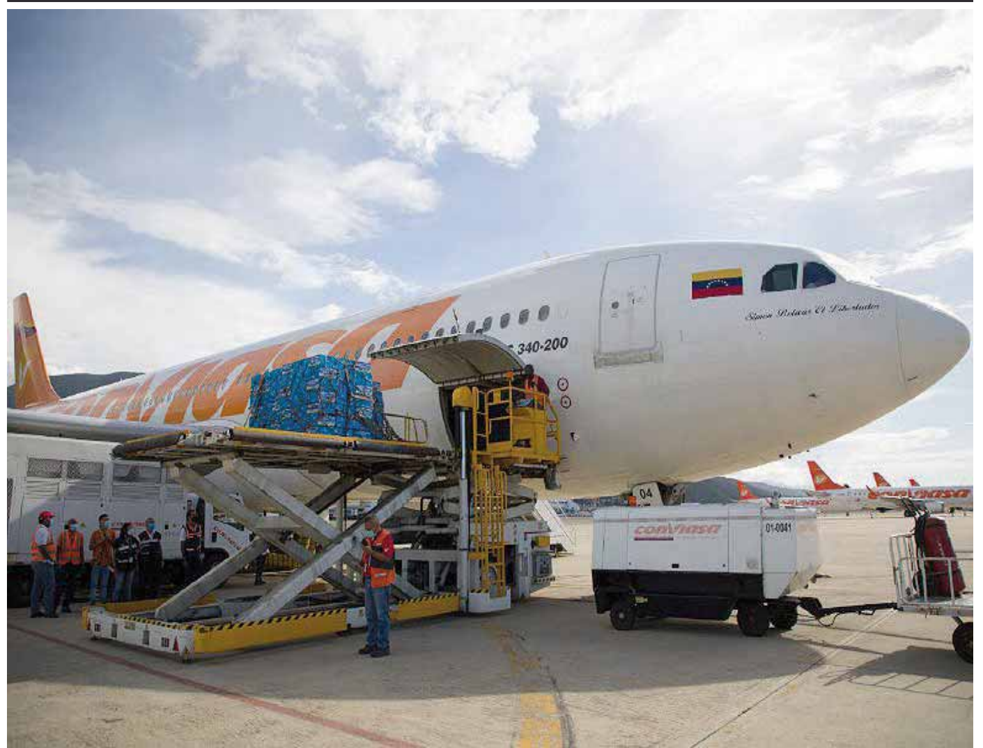
págs. 4 y 5

Solidaridad bolivariana Venezuela, fiel a sus principios de hermandad, realizó ayer un primer envío de aproximadamente 30 toneladas de insumos, entre agua potable, alimentos y medicinas, para el pueblo de Haití que actualmente sufre los estragos ocasionados por el terremoto ocurrido el sábado pasado. La ayuda incluye a personal de la Fuerza de Tarea Simón Bolívar, experta en este tipo de situaciones. pág. 3