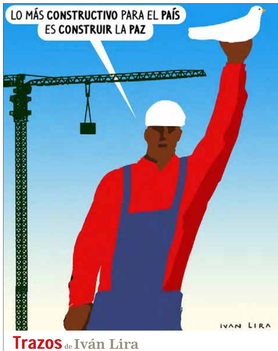
Trazos de Iván Lira