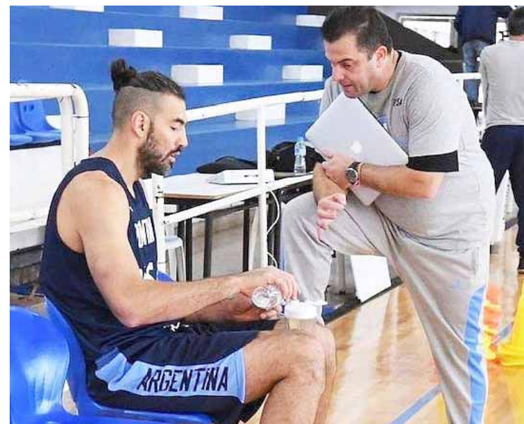
El “gaucho” tendrá una gran reto en Venezuela

Además, el directivo afirmó que se encuentran trabajando con el dirigente argentino de cara a las aspiraciones de la tribu en la Liga Sudamericana y el torneo local, precisando que el núcleo de jugadores que estuvieron en la pasada temporada se mantendrá, “Se mantiene la base criolla del equipo, permanece intacta, vamos a hacer algunos ajustes, unas nuevas incor-