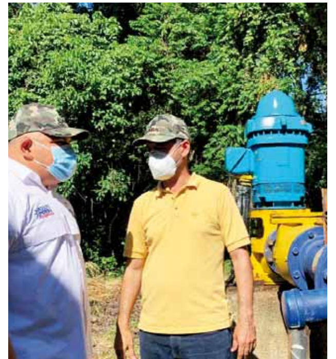
El sistema bombea el vital líquido a una zona grande de Barquisimeto

También se ejecutó otra jornada de desinfección, limpieza y embellecimiento en el CDI Doctor Orlando Medina, ubicado en la comunidad Andrés