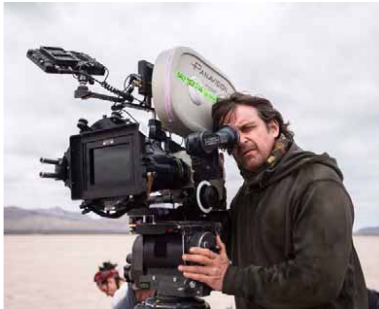
Vigas filmó en varias zonas de México

-Todo fue desafiante. Desde filmarla en Chihuahua, el estado más peligroso de México por el narcotráfico, lo que hizo la logística muy compleja por temas de seguridad. También filmamos en muchas locaciones diferentes, porque yo quería que la película fuera visualmente espectacular y para eso debíamos filmar en costas, en sierras