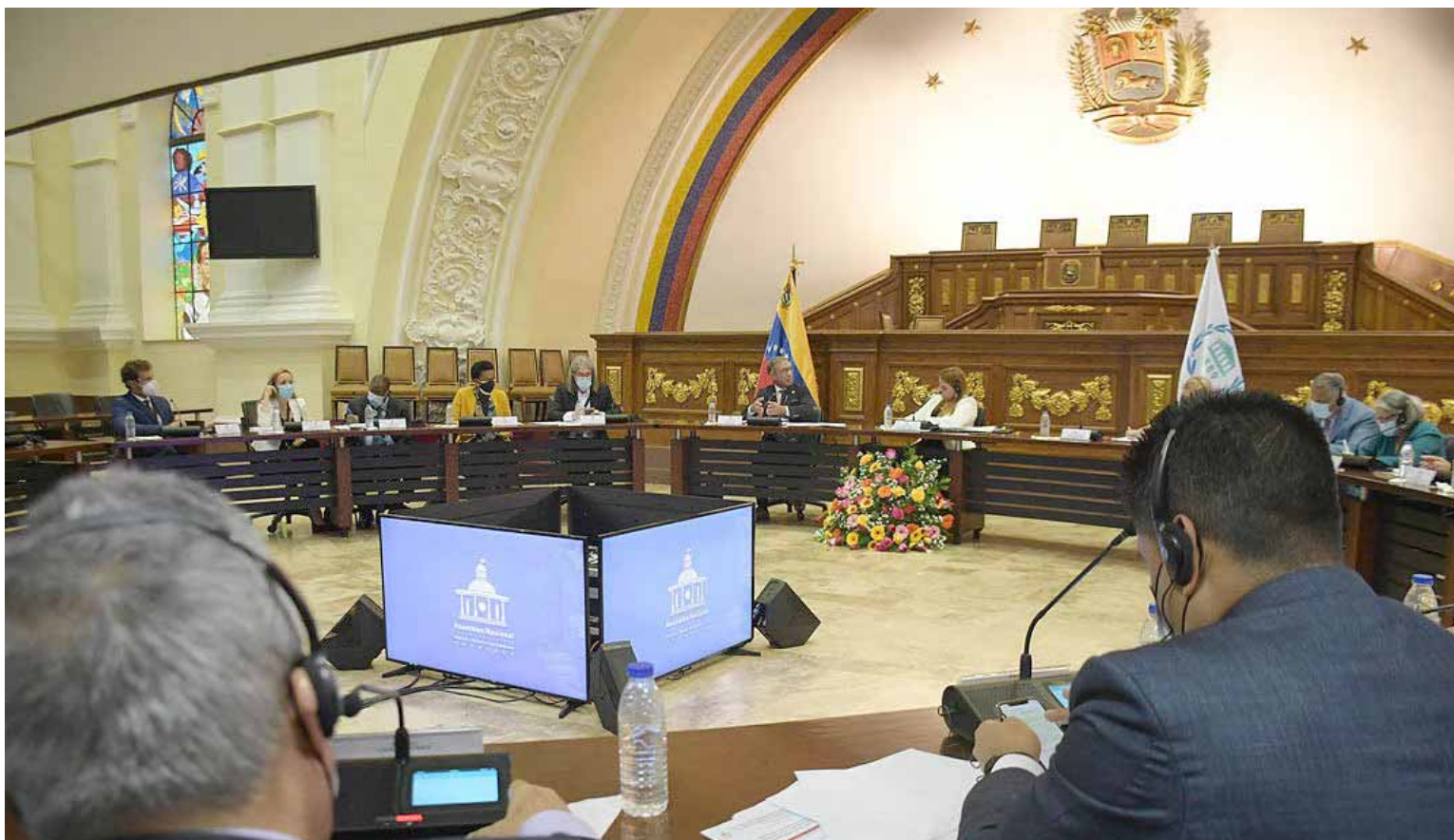
La delegación de la UIP se reunió con la representación de diputadas y diputados de la Asamblea Nacional

Los parlamentarios de la UIP destacaron que durante su visita tendrán contacto con distintos sectores de la vida nacional. Saludaron el proceso de diálogo