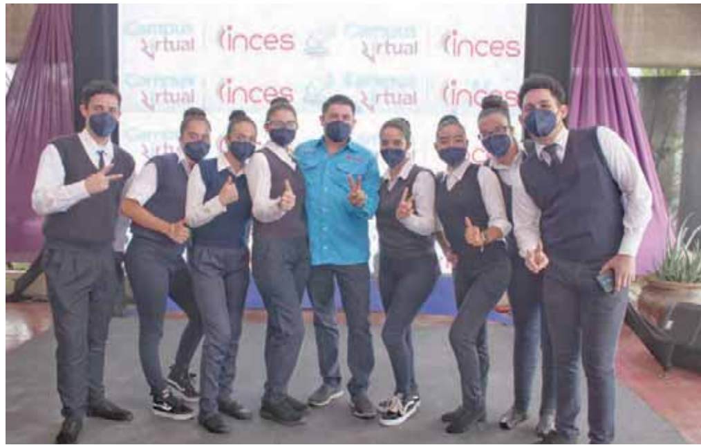
En el Inces existe un “Dream Team” por la educación del trabajador.

Para optar a los cursos se debe tener 14 años o más y cédula de identidad, estos los requisitos mínimos para hacer efectiva la inscripción vía internet.