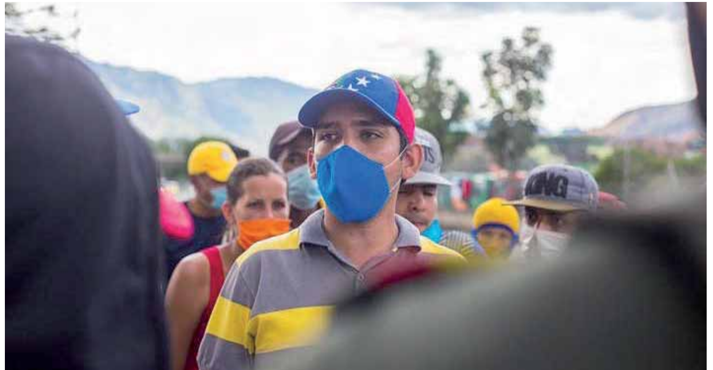
La R4V escapa a los métodos y canales tradicionales de fiscalización, monitoreo y contraloría

La información se publicó luego de que el gobierno de Canadá convocara y celebrara a mediados de junio la “Conferencia Internacional de Donantes en solidaridad con los refugiados y migrantes venezolanos” hecho en colaboración la Acnur y la OIM con la in-