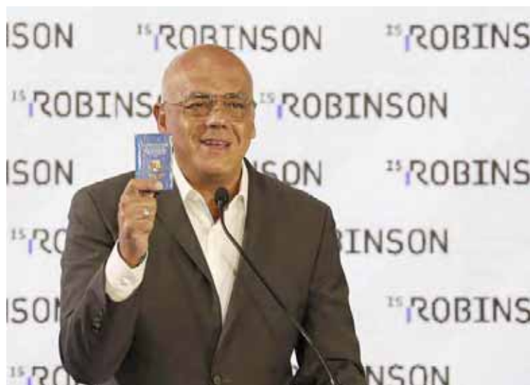
Dentro de esta constitución todo, fuera de esta constitución nada, expresó

tados Unidos por el entonces presidente, George W. Bush.