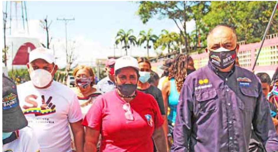
Se podan árboles, y se recupera el alumbrado público

Según Solarte, se desarrolla la rehabilitación de fachadas de viviendas, canchas deportivas, instituciones educativas, limpieza de calles, poda de árboles, recuperación del alumbrado público y desinfección