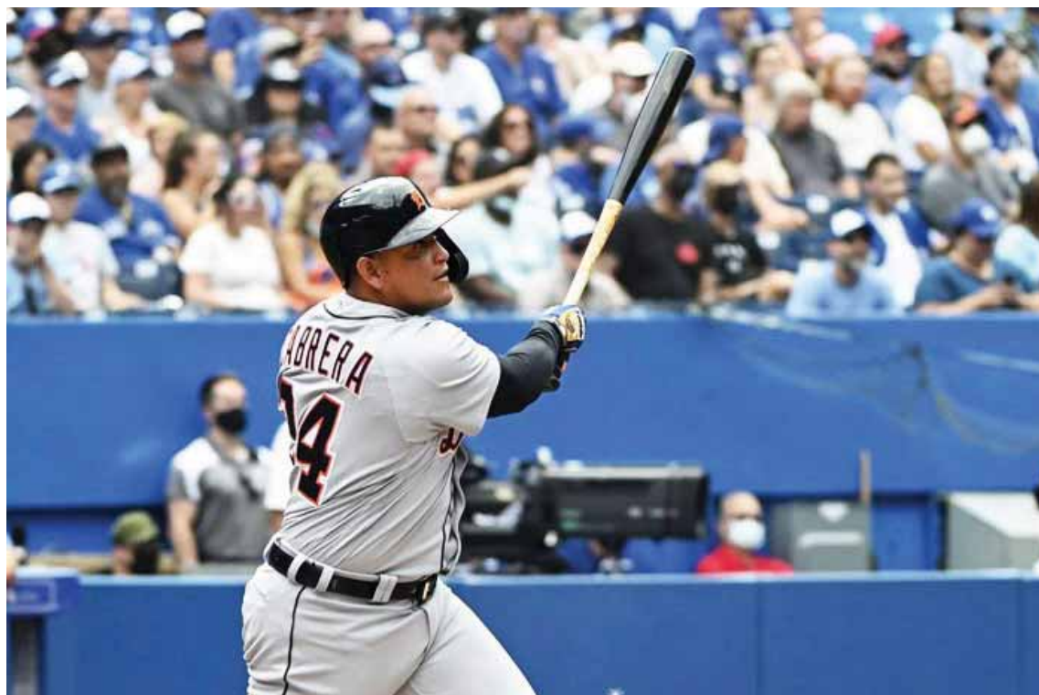
Miguel Cabrera ahora tiene a Eddie Murray (504) en la mira jonronera

Otro dato muy importante es que Cabrera es uno de cuatro jugadores con 500 bambinazos, que han ganado la triple corona (2012), un título de Serie Mundial (Marlins de Miami en 2003)