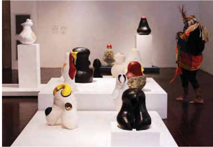
La exposición invita a reconectarse con el pasado

La artista se refirió al mito de kuman de la comunidad de Falcón. “Yo le hice una representación significativa.