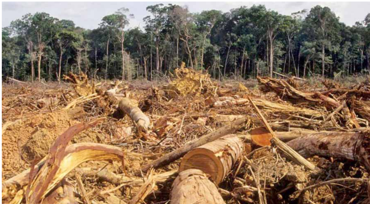
El año pasado la Amazonia perdió una superficie de selva igual a siete Londres

Sus conclusiones preliminares crean alarma y producen escalofríos. Las medidas de adaptación — en particular los sistemas de alerta temprana multirriesgo— no están lo suficientemente preparadas para hacer frente a los cataclismos. El apoyo de los gobiernos, así como de la comunidad científica y tecnológica, sería fundamental para reforzarlas y también para mejorar la recopilación y el almacenamiento de datos. De este