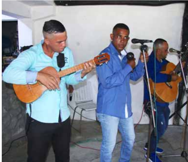
La música llenó de alegría a los presentes