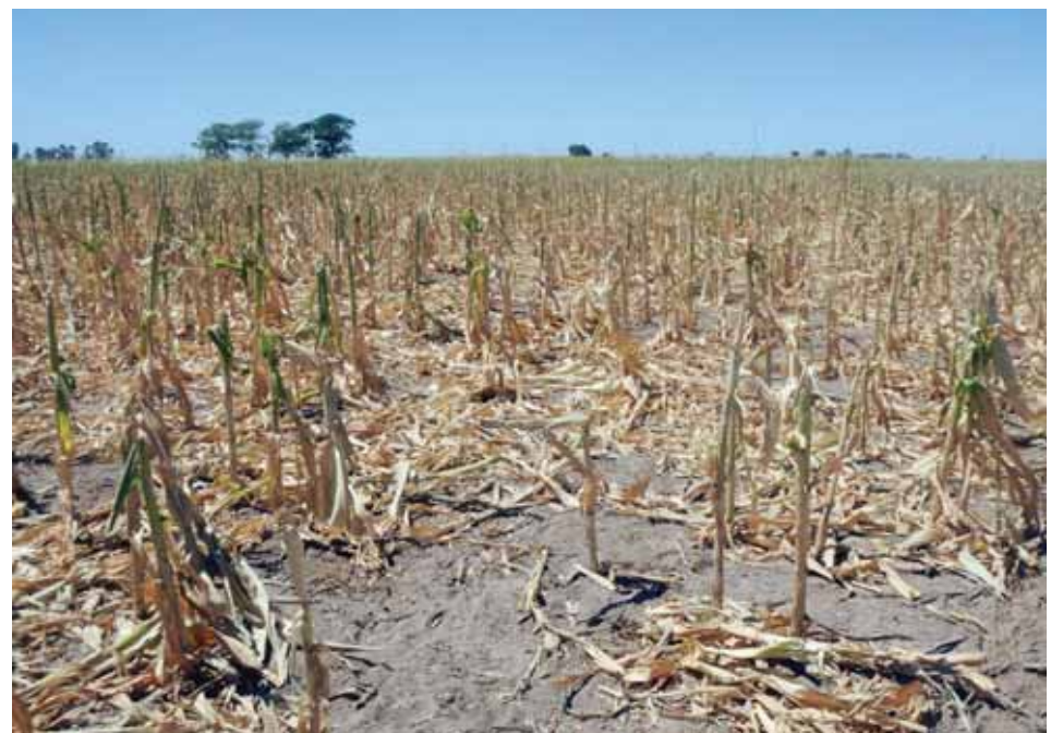
Para Argentina, 2020 fue un año seco, uno de los peores años desde 1961 y el más seco desde 1995

El estudio de la OMM indica que la sequía generalizada en esa región tuvo un impacto considerable en las rutas de navegación interior, el rendimiento de los cultivos y la producción de alimentos, debido a lo cual se agravó la inseguridad alimentaria en muchas zonas. Fenómeno que se visualiza, en particular, en la región del Caribe, con una vulnerabilidad muy alta. Varios de sus países integran la lista de territorios con mayor estrés hídrico del mundo, con menos de 1.000 m 3 de recursos de agua dulce per cápita. En el centro de América del Sur, en 2020, los totales de precipitación se aproximaron al 40 por ciento de los valores normales. El período de precipitaciones estacionales de septiembre de 2019 a mayo de 2020 estuvo marcado por