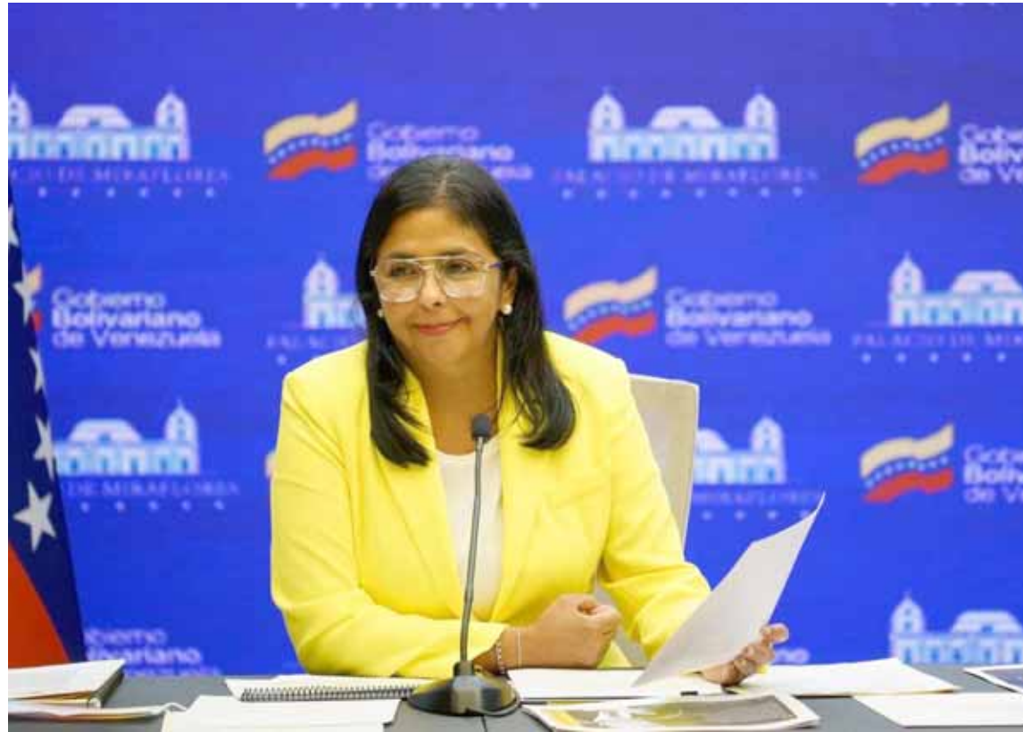
“La idea es informar al mundo sobre los crímenes de EEUU”, dijo Rodríguez

Rodríguez informó que el pasado lunes, Venezuela entregó ante la fiscalía de la Corte Penal Internacional CPI el informe denominado “Caso Venezuela II”. Comentó que desde el 12 de febrero de 2020 remitieron un informe por considerar que hay motivos (...) para creer que se cometieron asesinatos, persecución y exterminio contra la población civil por parte de