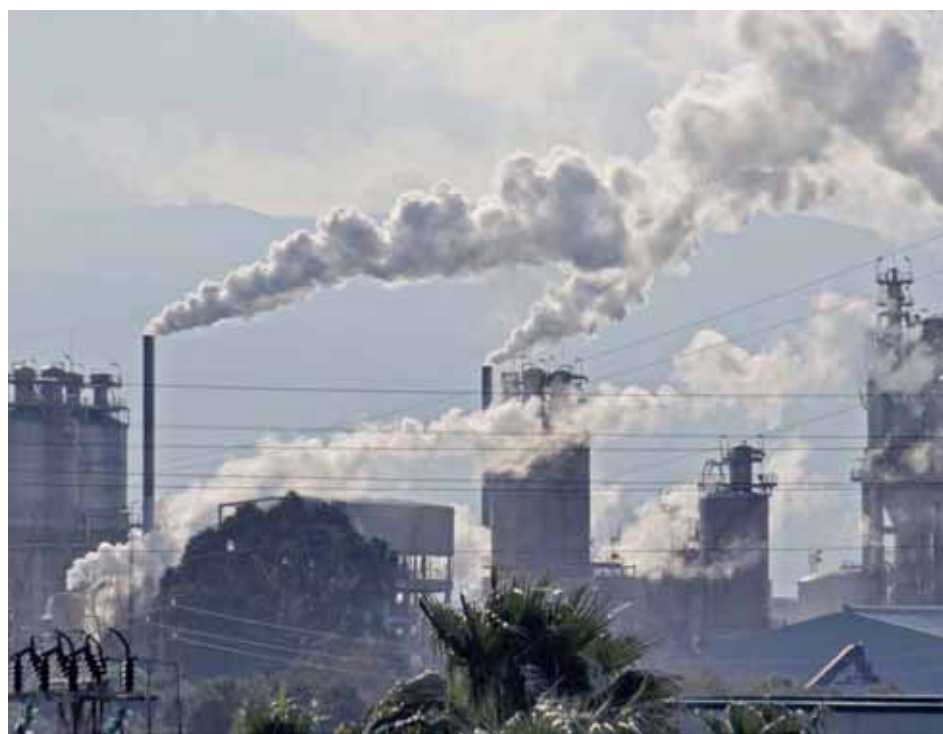
América Latina y el Caribe solo emiten el 8.3 por ciento de los gases de efecto invernadero a nivel mundial

modo, podría integrarse mejor la información sobre el riesgo de desastres en la planificación del desarrollo. No se puede subestimar el costo de la prevención: es fundamental contar con un apoyo financiero sólido para lograr esos objetivos.