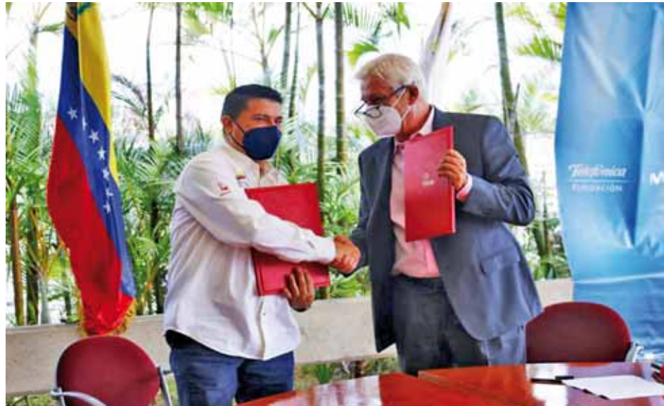
El Inces no deja de formar a jóvenes compatriotas

“Esto lo pudimos cristalizar con el lanzamiento del Campus Virtual Inces el pasado mes de agosto. Ahora, gracias a este importante convenio, además de las formaciones asociadas a los distintos sectores económicos productivos que ofrece el instituto, podremos incluir temas de tecnología avanzada con un gru-