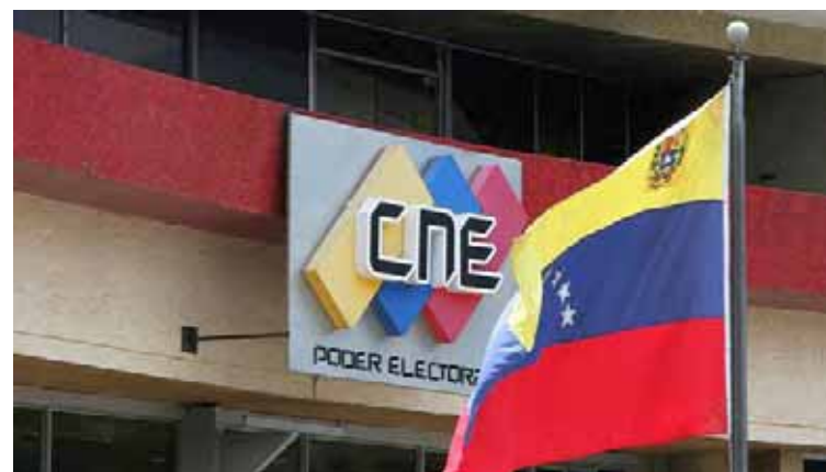
Los lapsos están establecidos en el cronograma electoral

El Poder Electoral, en otro tuit, destaca que una vez cumplido el mencionado plazo, los partidos podrán seguir presentando modificaciones o sustituciones entre el 27 de septiembre y el 11 de noviembre (postulaciones no-