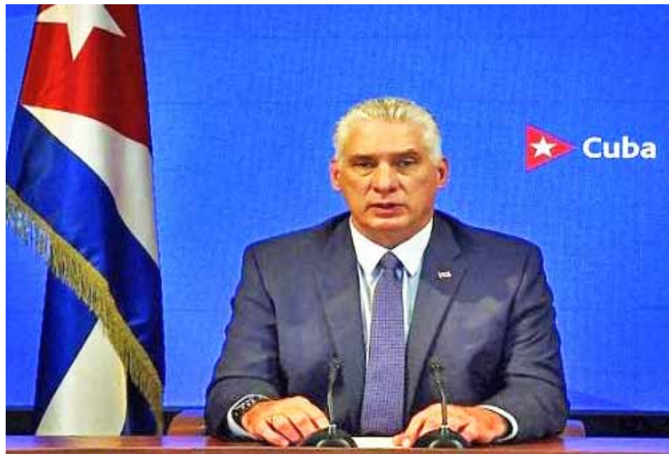
Gobierno de Cuba aboga por alcanzar la justicia social plena

También recordó que miles de cubanos apoyaron los movimientos de liberación en África, en particular contra el régimen del apartheid, o participaron en misiones educativas y sanitarias en otras naciones, con lo cual también contribuyeron a la erradicación del racismo.