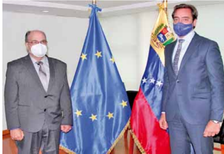
Misión exploratoria de la UE visitó Venezuela en julio

Cabe destacar que este acuerdo deriva de la invitación cursada por el Poder Electoral a la Unión Europea el pasado 17 de mayo de 2021, para que despliegue una misión electoral de cara a las elecciones Regionales y Municipales 2021. Esto en concordancia con lo enunciado por el presidente del Poder Electoral, Pedro Calzadilla, en la sesión extraordinaria del CNE celebrada el 11 de mayo de 2021, de garantizar la mayor