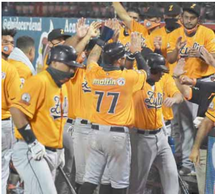
Los rapaces tienen un buen núcleo de criollos

Luego del anuncio oficial del cuerpo técnico para la temporada 2021-22 y de concretar la participación de varios ju-