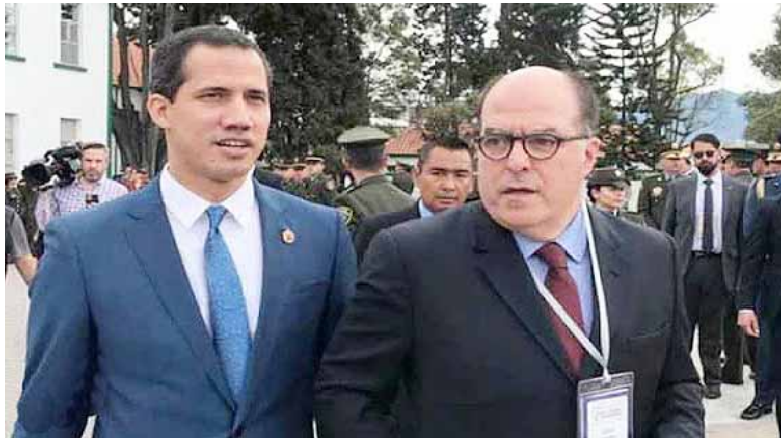
La división en el bando antichavista es cada vez más evidente

El dirigente opositor acusa de “manejo partidista” la administración de los activos con juntas ad hoc, un enunciado paradójico si tomamos en cuenta que, al menos en apariencia, las decisiones de controlar las empresas filiales de Venezuela en el extranjero se dieron en componenda entre las fracciones antichavistas