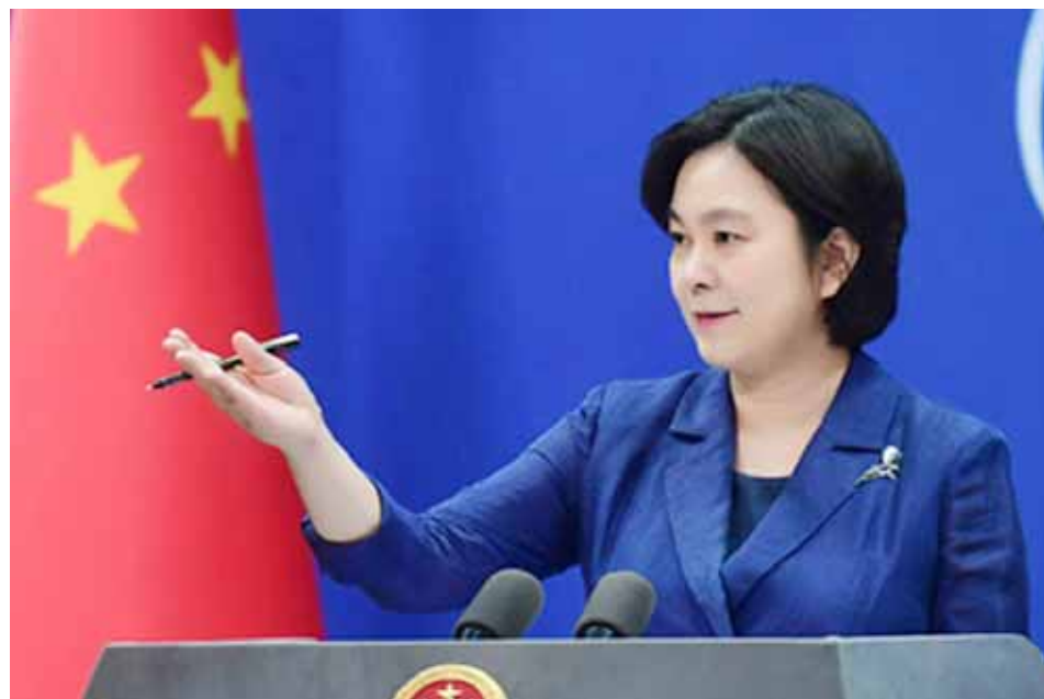
“La creación de la alianza Aukus representa un enorme riesgo de proliferación nuclear”, dijo Chunying

La posibilidad del resurgimiento de la Guerra Fría es el principal peligro de la conformación de la coalición Aukus, dijo la portavoz de la Cancillería de China, Hua Chunying