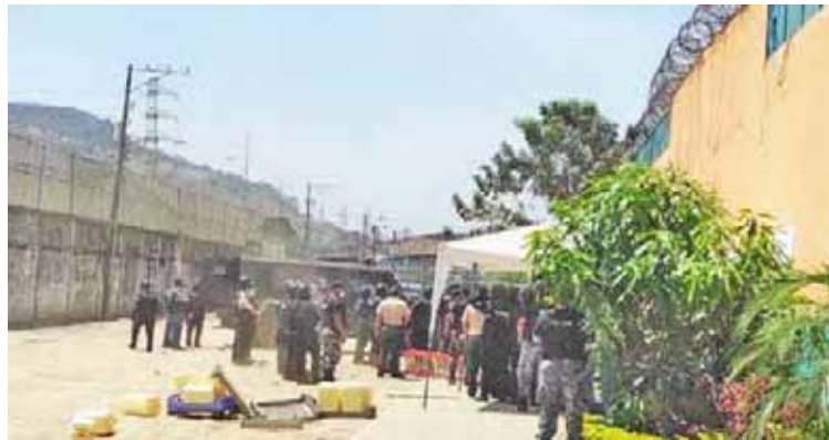
El estado excepción carcelaria registró por 60 días

El lamentable suceso ocurrió cerca de las 17:00, sobre el cual,