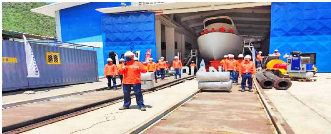
La tecnología venezolana también lucha por el país

Señaló que en la empresa astillera nacional también se está construyendo el Complejo Diancalum con una capacidad de activar cinco líneas de producción, que