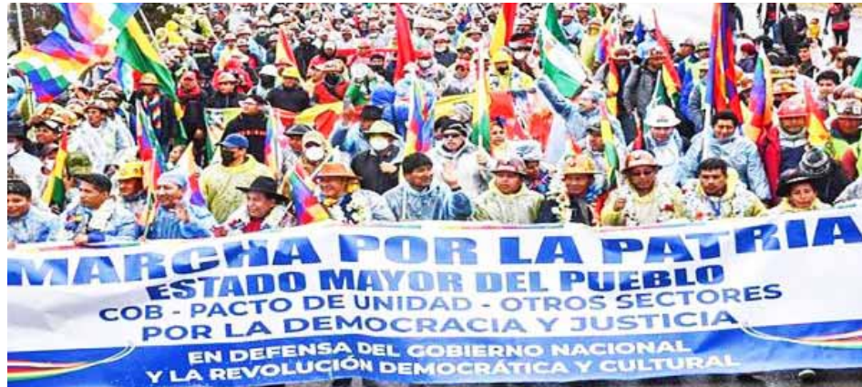
Un nutrido grupo de personas recibió a la Marcha en Defensa de la Democracia

“Movilizados somos unidos e inalcanzables”, dijo el expresidente Evo Morales, mientras que el actual Mandatario destacó el simbolismo de esta movilización en rechazo a los intentos golpistas de la derecha