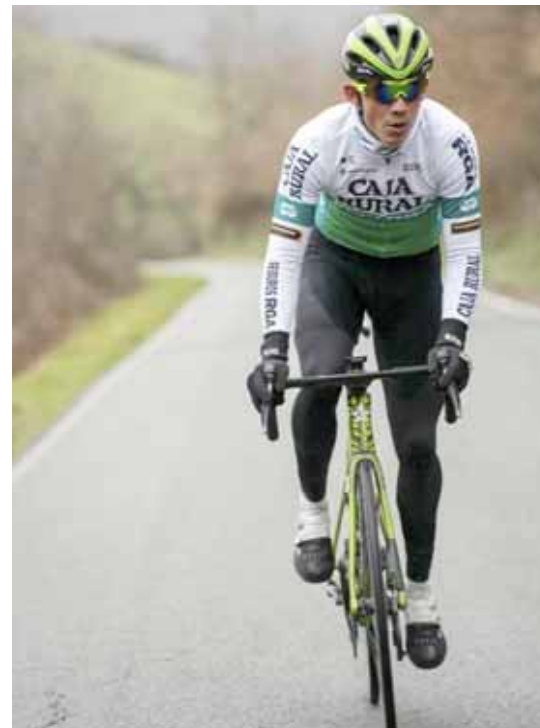
Aular respondió a las expectativas del team español

“Ha sido una temporada llena de grandes momentos para mí en la que sin duda correr los Juegos Olímpicos y vivir cada momento allí fue mágico de verdad. Ahora nos toca enfocarnos aún más en los objetivos individuales y grupales que tenemos para la nueva temporada con mi equipo y seguir dando lo mejor para representar a Venezuela de la mejor manera”, analizó el criollo.