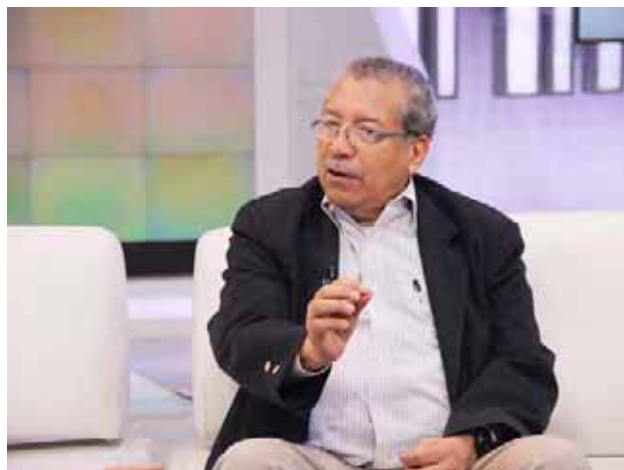
Continuará el intento de golpe de Estado contra Castillo, aseguró Ortega