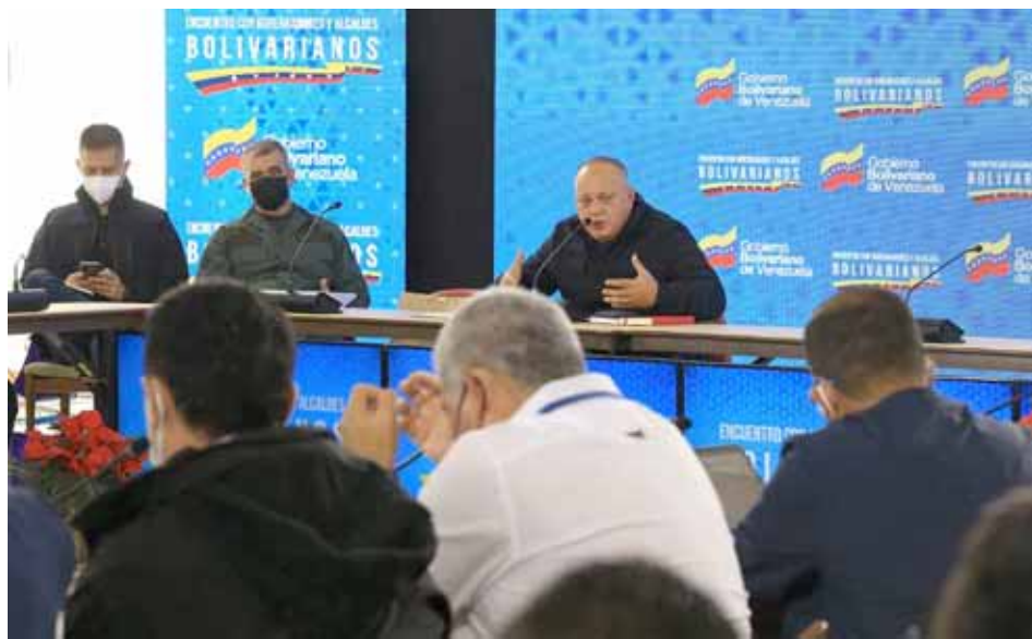
Las fuerzas revolucionarias deben ir a una fase de revisión del 1x10, aseguró Cabello

El planteamiento lo hizo Cabello durante un encuentro con los gobernado-