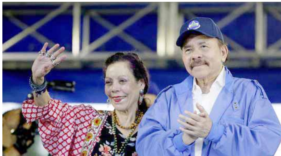
Ortega y Murillo recibieron el respaldo de millones en las elecciones del 7 de noviembre

Mediante un comunicado oficial publicado por la Cancillería de la República, el presidente Nicolás Maduro denunció lo que calificó como “irritas agresiones” contra Nicaragua por parte de la Organización de Estados Americanos (OEA) y de su secretario general, Luis Almagro, que en una resolución pretendieron declarar ilegítimas las recientes elecciones generales en el país centroamericano.