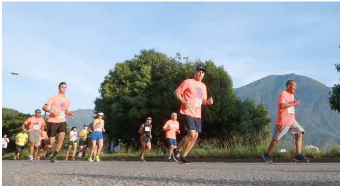
Maratón Caracas 42K siempre marca pauta

Con esta decisión de la Consudatle, el 12 de diciembre, en la salida del Parque Los Caobos, un grupo de atletas élite de Venezuela y Suramérica estará en la línea de largada junto a los 550 maratonistas que se inscribieron para correr el maratón.