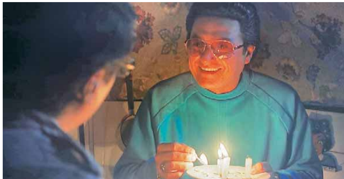
Investigó mucho sobre el personaje de Lavoe

No solo actuar es el único norte de este merideño: “Al verme sumergido en tantas historias,