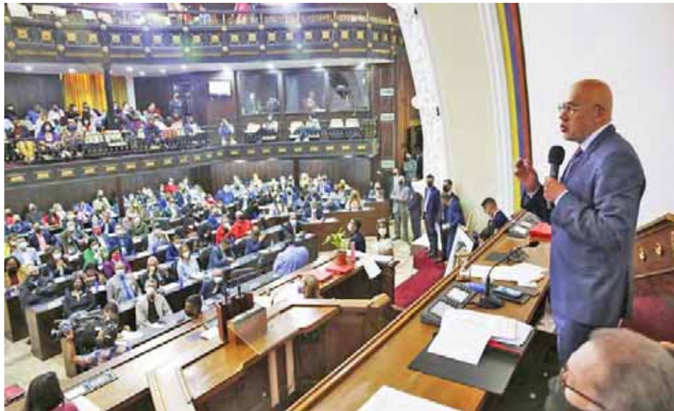
En las elecciones del 21-N ganó la Revolución Bolivariana, enfatizó Rodríguez

“Hay que ensalzar al pueblo de Venezuela porque sin derramar una gota de sangre logró librar una segunda independencia y derrotó a quienes apostaron a la vía de la violencia política”, aseveró el presidente de la Asamblea Nacional, Jorge Rodríguez