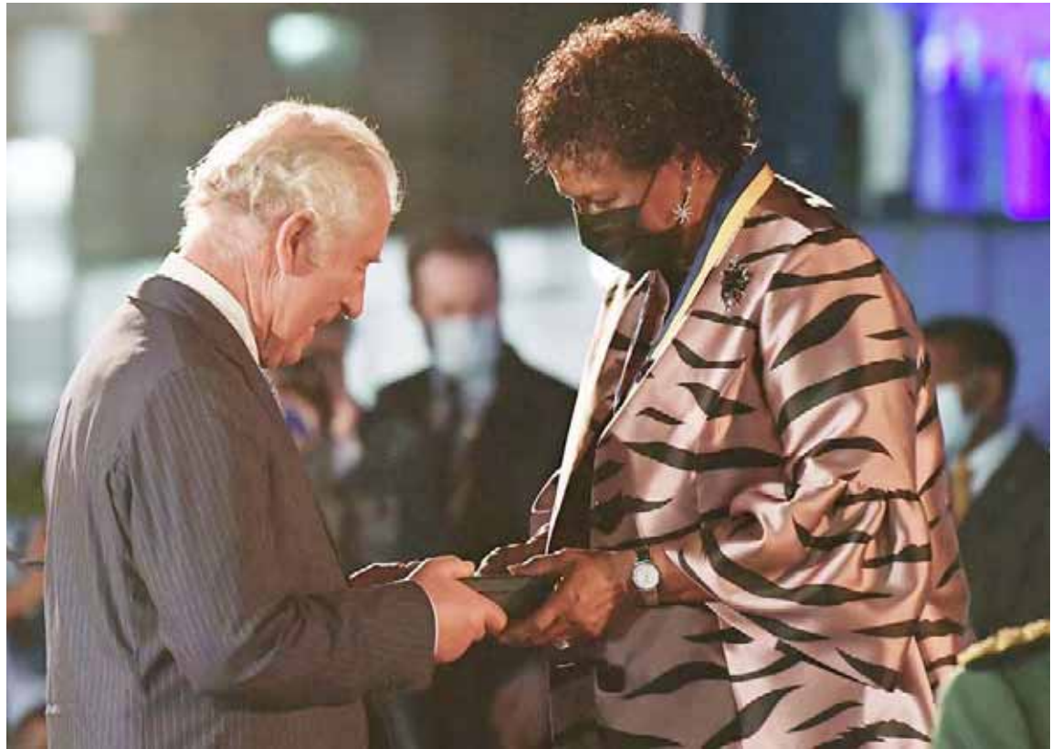
La presidenta de Barbados Sandra Mason saludó al príncipe Carlos de Gales en el acto oficial

Al referirse a los retos que debe enfrentar la nueva re-