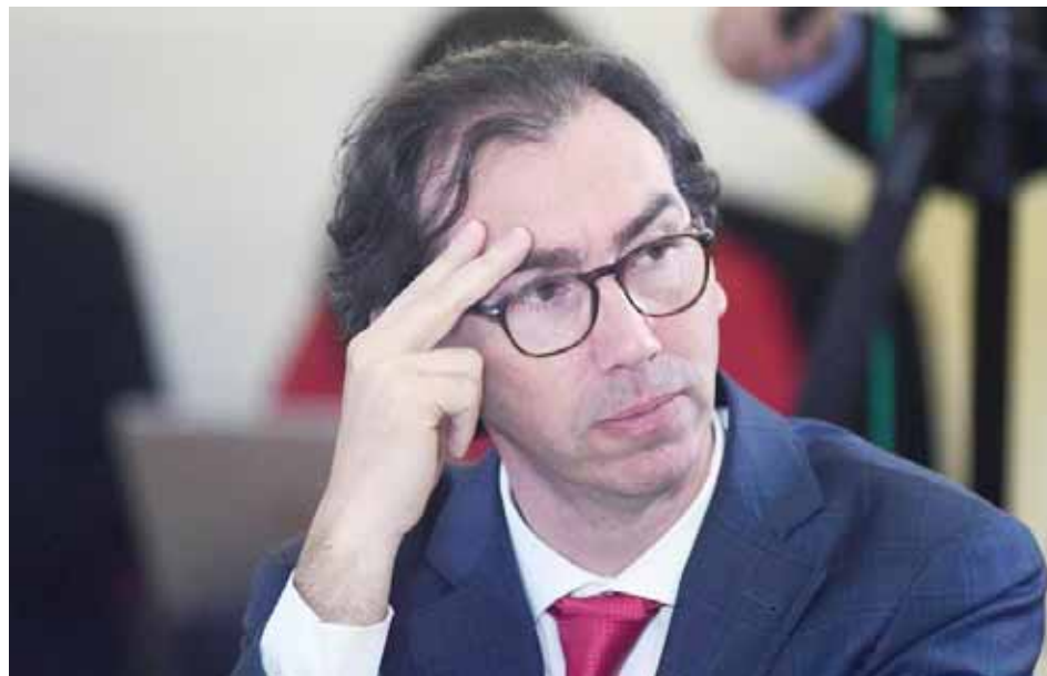
En el sector oficialista admiten que los servidores públicos no deben apoyar candidaturas

Durante una entrevista, el ministro de Educación, Raúl Figueroa, afirmó que como gobierno no pueden ser neutrales frente a la elección y dijo que “Kast representa un ideario de mayor libertad”.