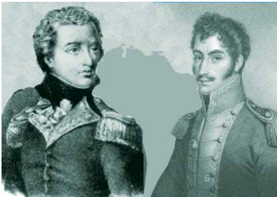
Piar y Bolívar

-El general Manuel Piar murió en Angostura del Orinoco el 16 de octubre de 1817. Han pasado más de 200 años de aquel día triste para las armas de la República, dos siglos después se escuchan diversas opiniones casi siempre producto del desconocimiento de los documentos primarios. Siempre quisiéramos recordar al general curazoleño por su obra como militar, guerrero, estratega y pilar fundamental en los primeros años del conflicto bélico contra la monarquía española, pero las complicaciones surgidas alrededor de su figura de general en jefe y su muerte en el paredón de fusilamiento despiertan los sentidos de todos los americanos, tocan el corazón de los venezolanos y generan querencias propias en las regiones orientales. En el transcurrir del tiempo son muchas las versiones sobre el trágico momento: la memoria oral sufrió los cambios en el palabreo cotidiano, los papeles certificados fueron olvidados y el rumor se volvió leyenda para guardar al héroe como símbolo de identificación de la región guayanesa. Unos cien años después de la tarde en que sonaran los disparos que segaron la vida del general Piar, vino a vivir a Ciudad Bolívar el carupanero Bartolomé Tavera Acosta, cronista, investigador y periodista, que, por alguna razón desconocida, puso en duda todo el legado