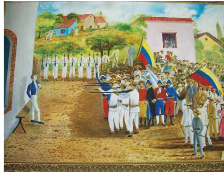
Fusilamiento de Piar

-Se estaba fundando la república y se vivían los más intensos años de la guerra despiadada. Eran días difíciles para organizar las instituciones y establecer los poderes; sobre la marcha se escribieron instrucciones para elegir diputados al congreso, los que tal vez no serían los más representativos. Así mismo, se dictaba justicia por aquellos días siguiendo las ordenanzas establecidas, y los reglamentos para los delitos militares en los diferentes niveles de ejército. Bolívar nombró un juez fiscal y un secretario, también los generales, coroneles y tenientes coroneles que indicaba la normativa para conformar el consejo de guerra; se cumplieron los lapsos, se presentaron y se dio la ratificación de los testigos, se oyeron las argumentaciones del acusado, y el careo con los declarantes. Hubo una sentencia que fue ratificada por absoluta unanimidad por los siete miembros del tribunal. Muchas veces las mentiras vuelan, los rumores se aferran, son muchas las palabras pronunciadas y las letras impresas sin la prueba; falsas opiniones que casi siempre partieron de papeles arreglados. Hay una carta mutilada y escrita con mala fe en la que el doctor José Domingo Díaz, el editor de la Gaceta de Caracas , pone en la pluma de Bolívar aseveraciones que nunca fueron ciertas; unos días antes de establecerse el consejo de guerra supuestamente el Libertador decía: "La sentencia será a muerte y el General Piar morirá y mis