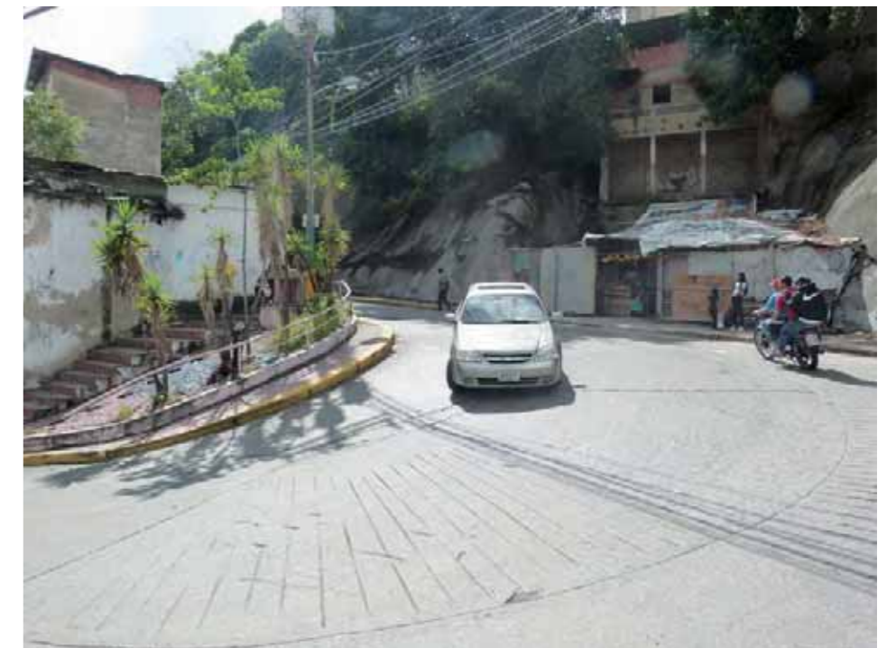
La curva del Paragua

- Aquí venían los claveles de Galipán. Las rosas tienen un perfume muy delicado. El crisantemo no tiene olor. El gusto