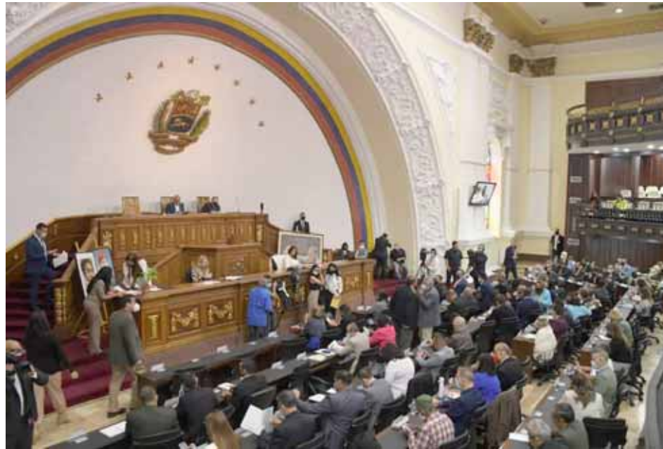
Gobierno Nacional presentará el viernes la Ley de Presupuesto

En este sentido, este convenio permitirá posicionar a nuestra nación en el selecto grupo de países que usan esta tecnología, cooperando con las autoridades de las otras naciones y las correspondientes organizaciones internacionales vinculadas.