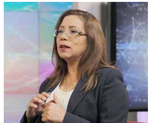
“Vamos hacia el desplazamiento de la economía criminal”, aseguró Díaz

Explicó que esta acción se realizará con la finalidad que se cumplan los planes de Gobierno obedeciendo al