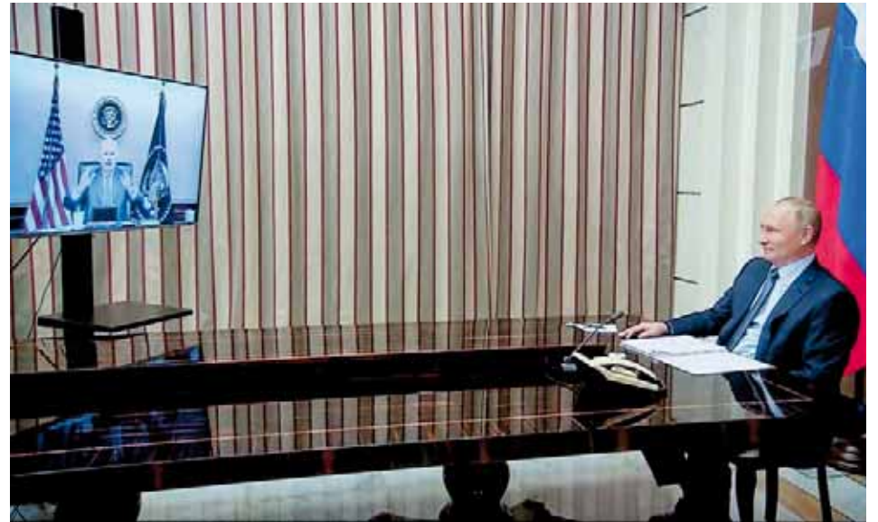
El tema de Ucrania y el incumplimiento de los acuerdos de Minsk fueron la clave del diálogo virtual entre Putin y Biden

La clave de la conversación de los mandatarios ha sido el tema de Ucrania y la crisis en la región de Donbass en medio