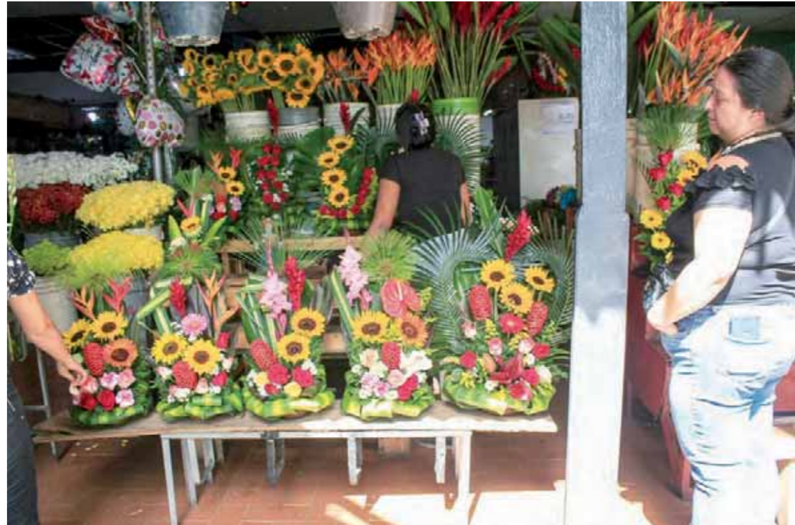
Mercado de Las Flores, en la parroquia San José

Pero sobre esta encantadora historia hay muchas interrogantes y dudas, al menos en lo que se refiere al origen del agricultor en Galipán, poblado de la espalda del Warairarepano, en donde nadie lo recuerda, su figura no es parte del anecdotario