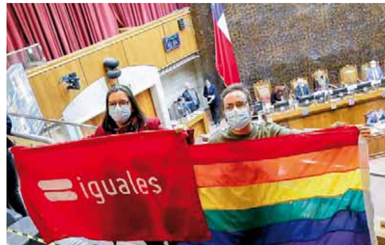
Legisladores celebran la aprobación de la norma

En un agitado e histórico debate parlamentario, el senado aprobó la iniciativa al mediodía y la envió