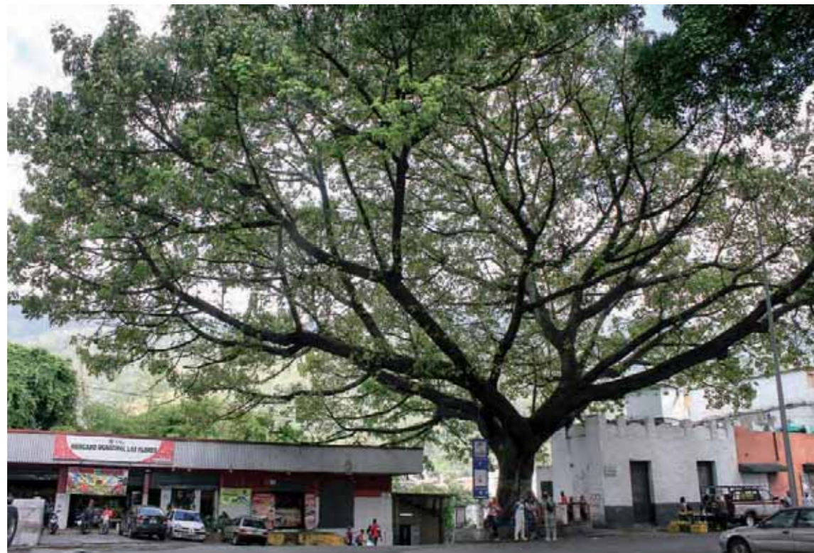
La ceiba y el mercado son patrimonio de la ciudad

dez, González. Sobre esa reseña de Pacheco, los viejos de Galipán hablan de no haberlo conocido. No les suena ese Pacheco. El apellido no se mantiene en el Ávila (Warairarepano), de haber sido cierto, hubiese una generación con ese apellido. Nosotros por el lado de Galipán pensamos que alguno de apellido Pacheco debe estar por el lado del Camino de los Españoles, que es el primer