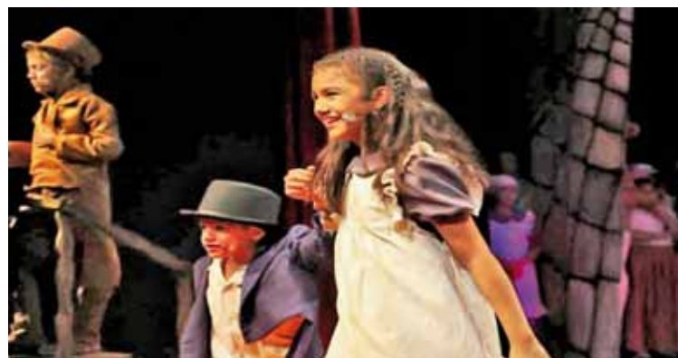
Un gran talento estará en escena

Son 230 niñas y niños actuando, cantando y bailando en el escenario, la obra deleitará durante 45 minutos a grandes y chicos, con un brillante espectáculo que recrea la festividad