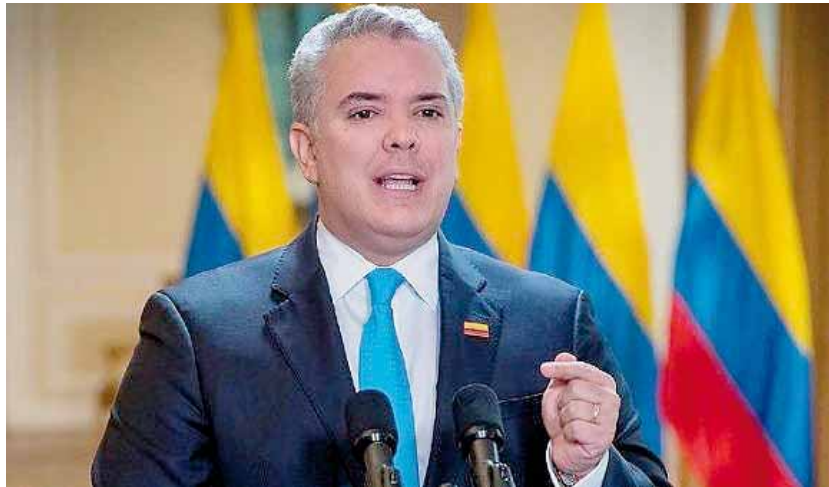
El 79,6% de los colombianos consideran que el país va por mal camino

T/ Redacción CO-Telesur