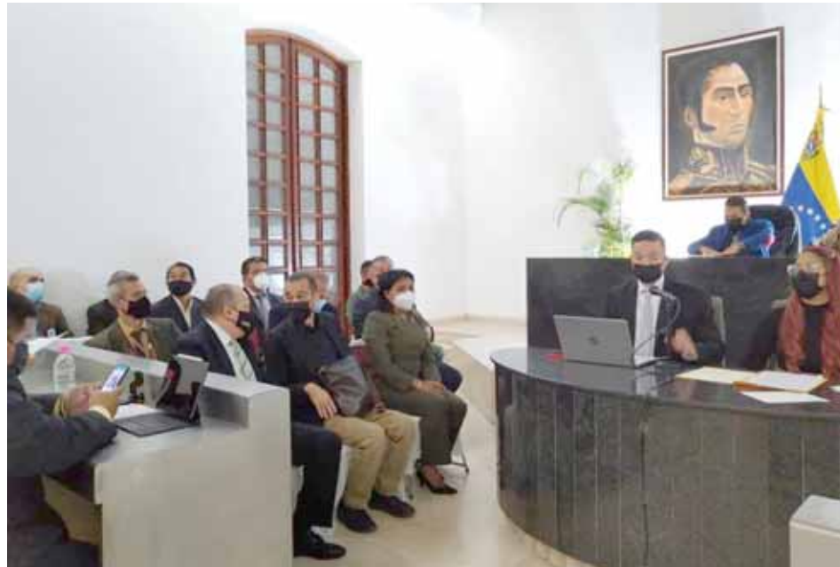
Se trata de un problema complejo porque involucra a gobiernos extranjeros, señaló Chávez

Dicha juramentación se realizó durante una sesión especial del Concejo del Municipio Bolivariano Libertador, en la que el presidente de la citada comisión