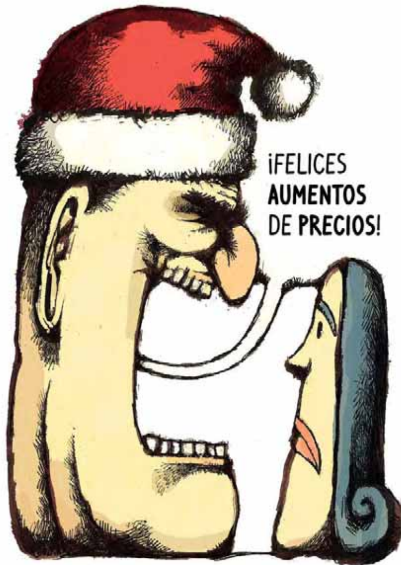
Trazos de Iván Lira

irmarcelobarros@uol.com.br Recife/ Brasil