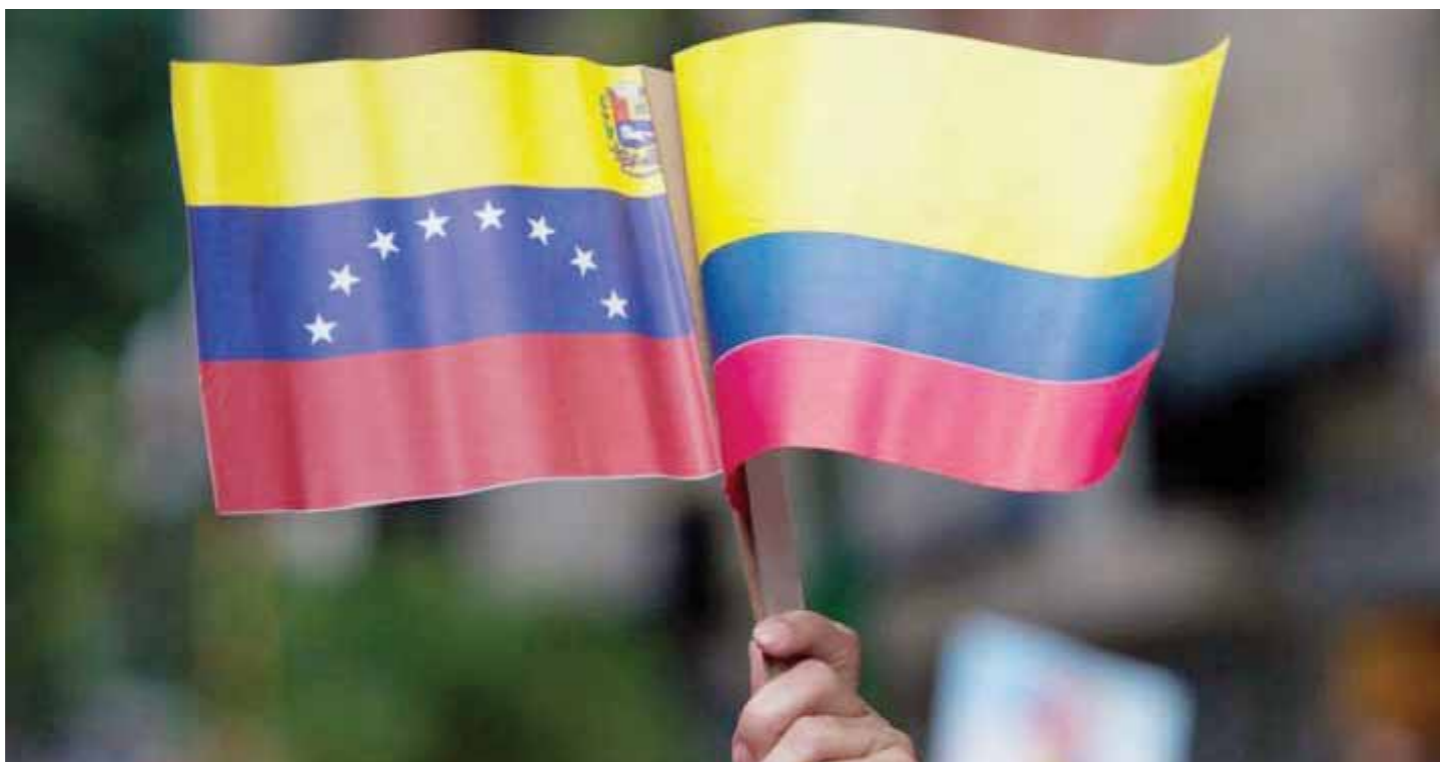
¿Qué es la democracia en el siglo XXI? ¿Dónde hay una verdadera democracia?

T/ María Fernanda Barreto-Misión Verdad