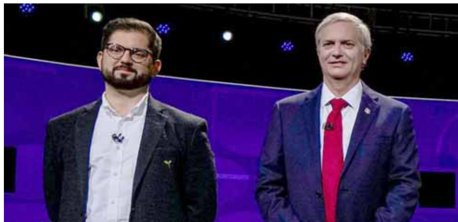
Los sondeos recientes revelan que Boric aventaja a Kast en la intención de voto con cuatro puntos

T/ Redacción CO-EFE-Telesur