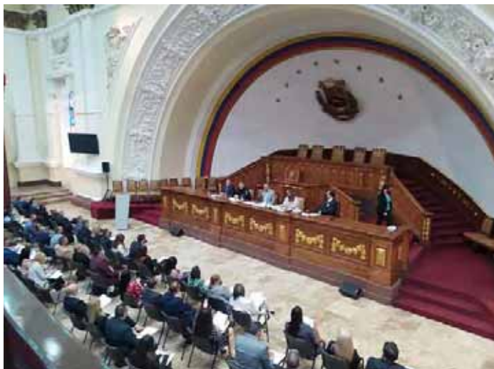
Se instalaron cinco mesas de trabajo en la AN para debatir propuestas

Se presentó una propuesta para concretar el artículo cinco de la Carta Magna, que establece que todos los miembros de las instituciones públicas “deben rendir cuenta de su gestión y la posibilidad de elegir en referéndum revocatorio a los electos a través del voto popular”, destacó el parlamentario bolivariano