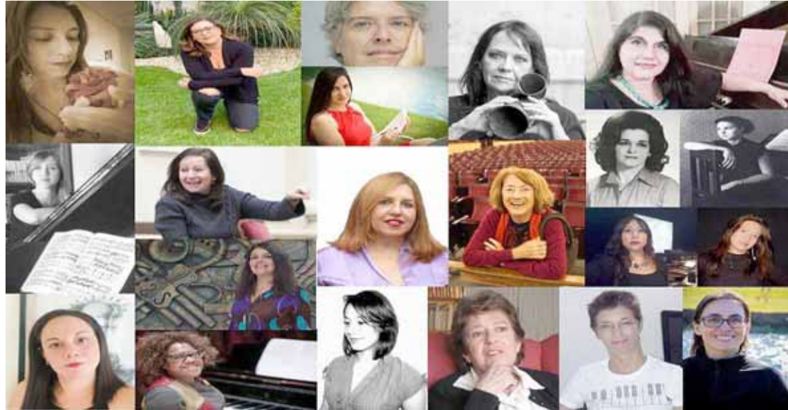
La actividad siempre ha sido apoyada por el sistema de orquestas venezolano

Este esfuerzo, menciona una nota de prensa, siempre ha contado con el activo acompañamiento del Sistema Nacional de Orquestas y Coros Juveniles e Infantiles, que desde su fundación, hace casi 47 años, ha buscado brindar igualdad de género, al punto que casi la mitad de la matrícula actual de la institución es femenina, como es el caso de la Orquesta más Grande