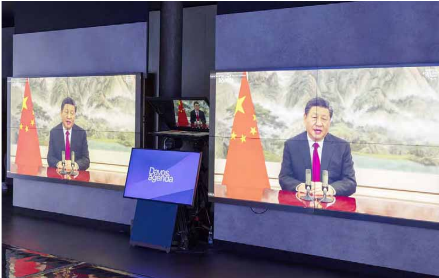
La fuerte confianza y la cooperación solidaria constituyen la única vía acertada para vencer la pandemia