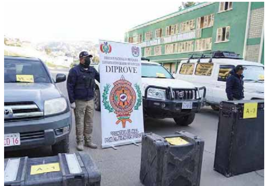
"Esperamos dar con todas las personas involucradas", dijo el ministro Eduardo del Castillo

El ministro informó que entre 2019 y 2020 se comercializaron 34 unidades, "vendidas de manera ilegal". Entre ellas hay vagonetas, dos automóviles, un bus, cinco camionetas, siete motocicletas, dos minibuses y dos camio-