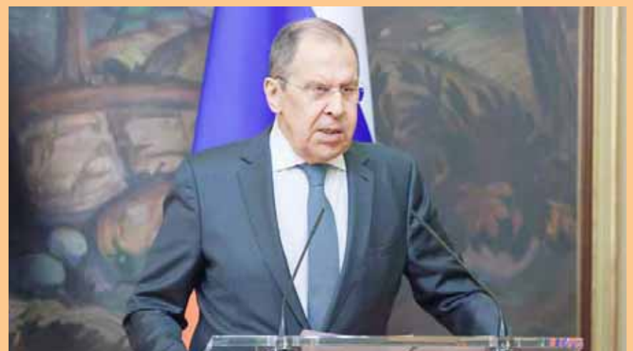
Para el canciller ruso, sin duda Ucrania está bajo el control de EEUU

En tal sentido, el diplomático aseveró que lo que ocurrió en Ucrania