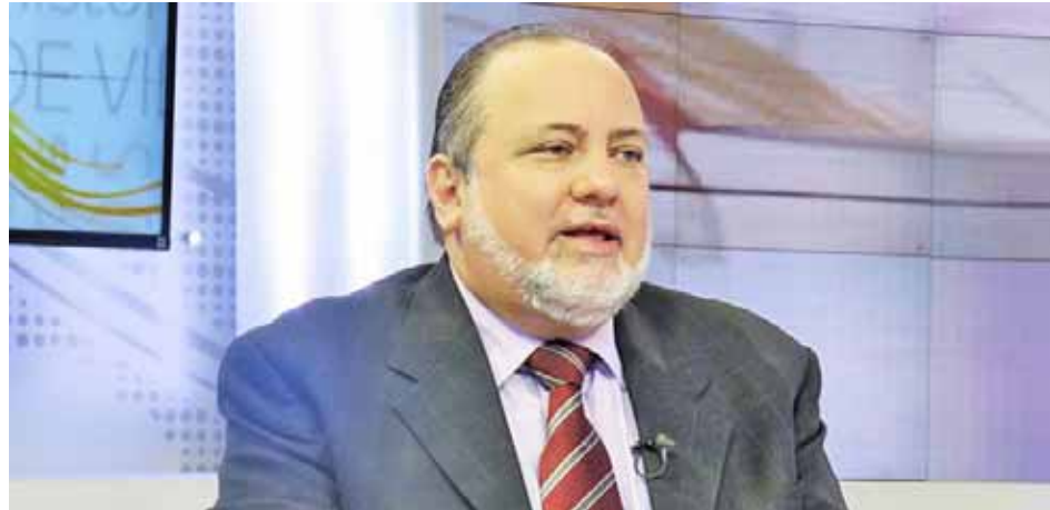
Se observan en el país logros importantes en derechos humanos, aseguró Ruiz

“Contamos con avances importantes en el tema del derecho a la vivienda digna, a pesar de todas las medidas coercitivas unilaterales que hemos vivido, aún se continúan entregando viviendas”, apuntó.