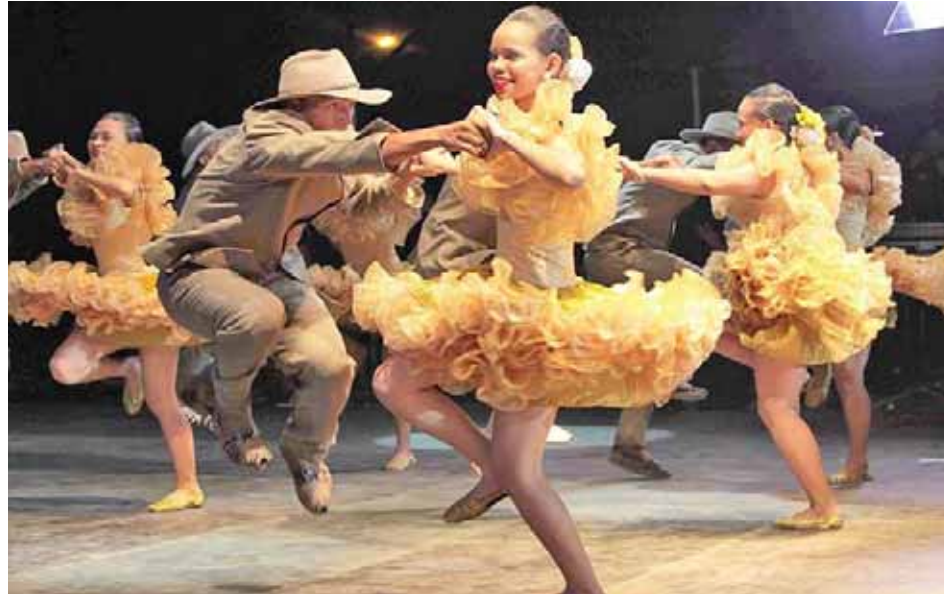
Las actividades se programaron para los días martes desde las tres de la tarde

Jaimes explicó que la intención de la cátedra es compartir con las comunidades maracayeras las actividades de índole académico que se llevan a cabo en la Unearte Aragua y que se relacionan con la danza como patrimonio cultural. “Para ello”, explicó, “hemos abierto un