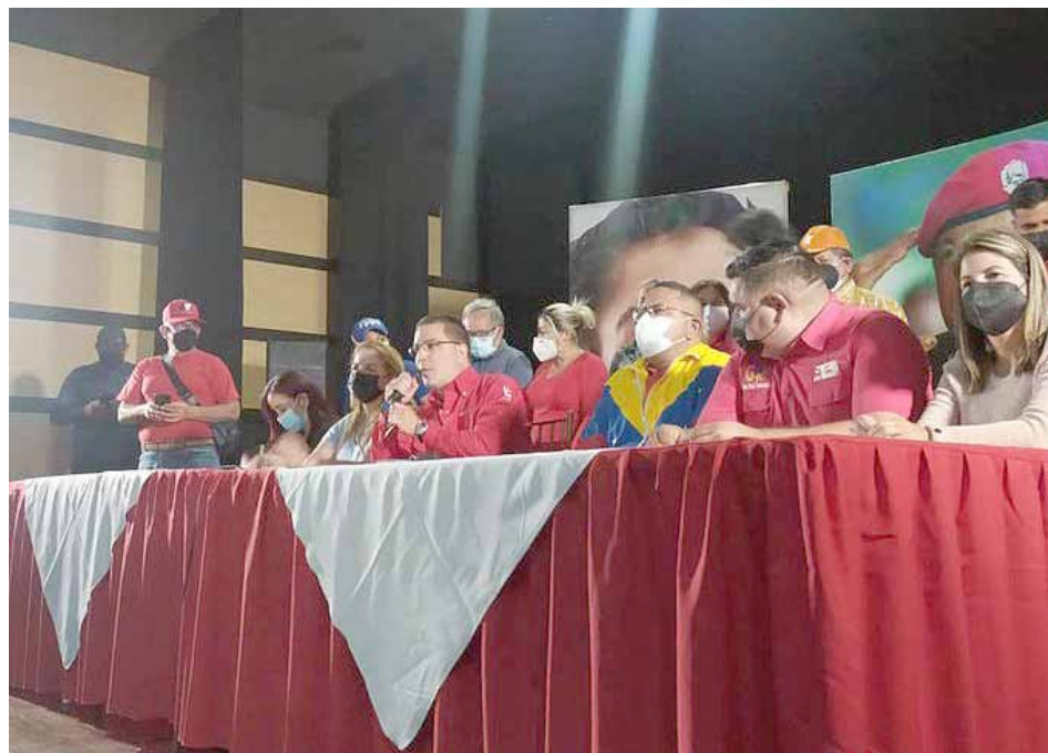
“No dejaré solo al pueblo de Barinas”, afirmó Arreza

Arreza hizo un llamado a la unidad, a fortalecer las 3R: Revisión, Rectificación y Reimpulso, ya que estimó que el PSUV debe revisar en Barinas, estas variables.