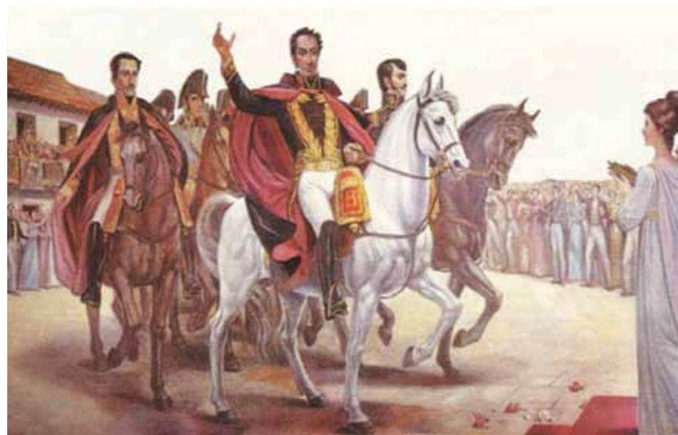
Entrada de Bolívar a Quito