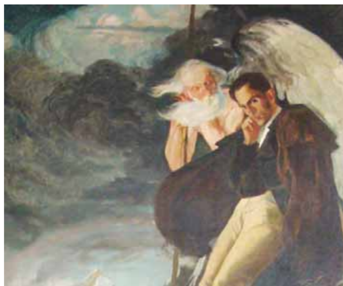
Mi delirio sobre el Chimborazo