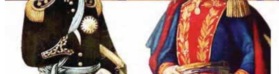
Bolívar y San Martín se reunieron en Guayaquil

efectivo de Guayaquil a Colombia y favorece la entrevista de Guayaquil entre Bolívar y José de San Martín. En síntesis, esta campaña permitió la expansión grancolombiana y la influencia de Bolívar hacia el sur, y posteriormente todo lo que es la América meridional”, indica.