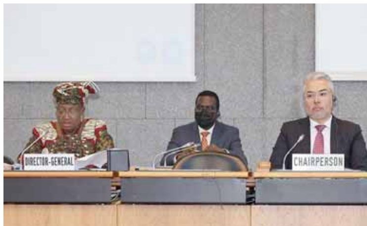
Representantes de la Organización Mundial del Comercio

De acuerdo al portal de la @OMC_es, la pandemia de Covid-19 ha tenido consecuencias