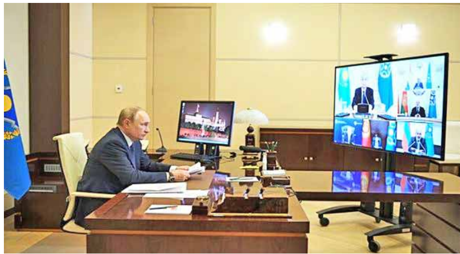
Situación en Kazajistán está volviendo a la normalidad, aseguró Putin

El señalamiento lo hizo el Mandatario ruso durante una reunión virtual del Consejo de Seguridad Colectiva de la Organización del Tratado de Segu-