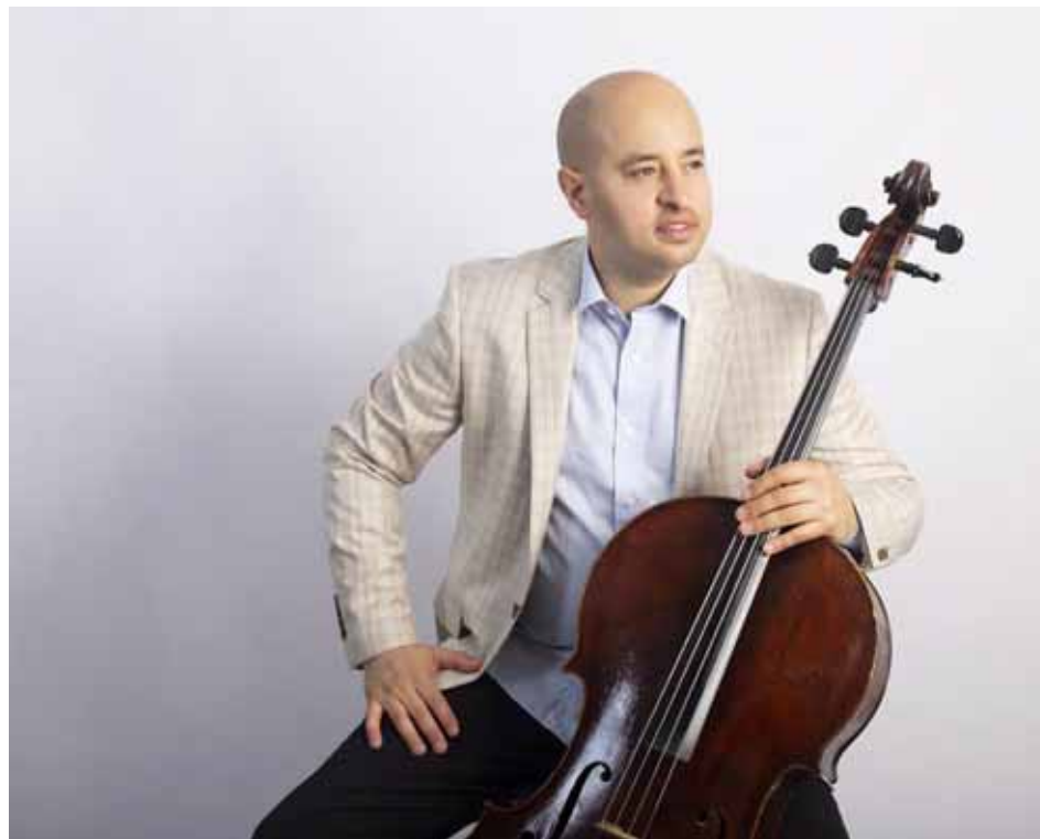
El artista es hijo del sistema venezolano de orquestas

“Me propuse elaborar esta guía por mi experiencia docente. Este método sintetiza el trabajo que he desarrollado como