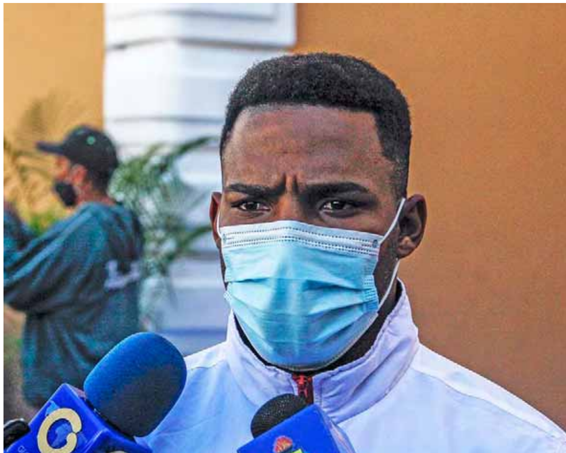
El guaireño ya comenzó a entrenar

Se debe recordar que este guaireño tuvo un pasado ciclo perfecto, al obtener medallas en Bolivarianos, Suramericanos, Centroamericanos, Panamericanos, mundiales y Olimpiadas: “Gracias a ese ciclo perfecto, ahora me siento con muchas ganas, mucha energía para comenzar este año, donde vienen los Juegos Bolivarianos y Suramericanos. Ahora toca