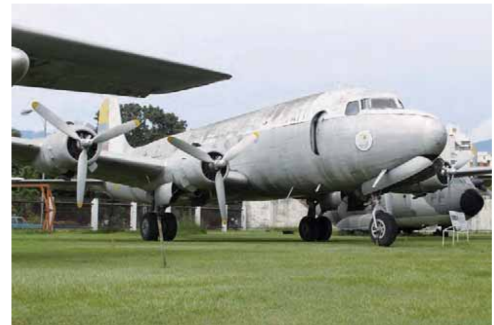
El avión donde huyó Marcos Pérez Jiménez a República Dominicana