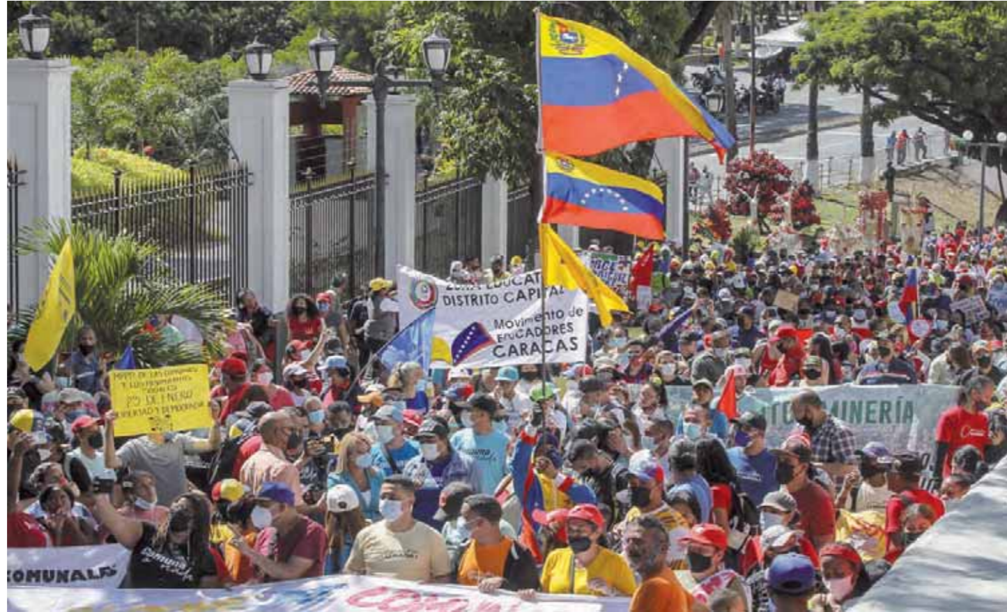
Caracas marchó ayer para recordar los 64 años de la caída de Marcos Pérez Jiménez

La narrativa acciondemocratista de la dictadura Pérez Jiménez, tamizada