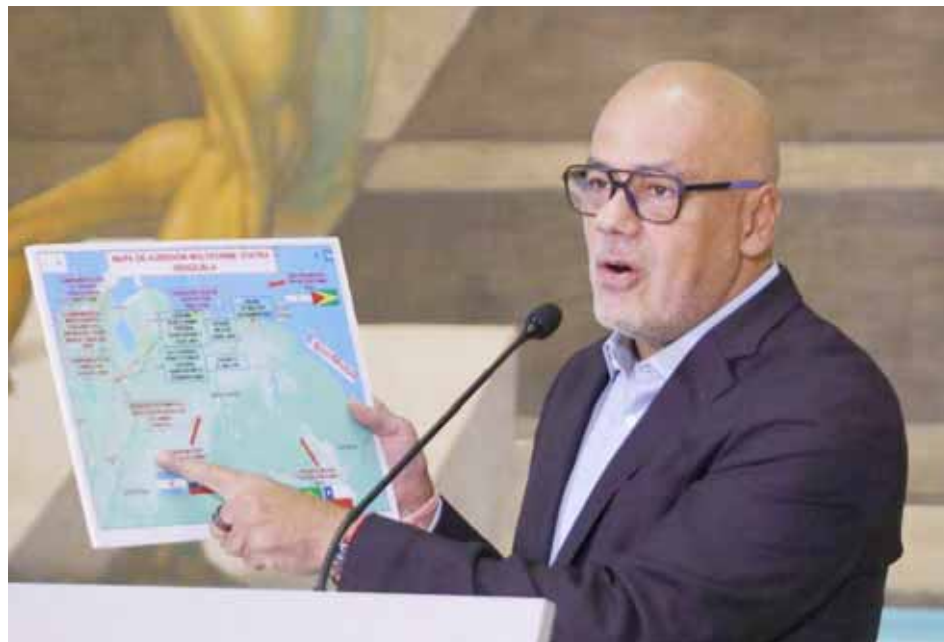
El diputado conversará con el ministro Remigio Ceballos sobre la Operación Cacique Guaicaipuro II

Al respecto precisó que el Gobierno colombiano financió y armó las bandas armadas delictivas de la Cota 905, El Valle y La Vega en Caracas, las cuales se