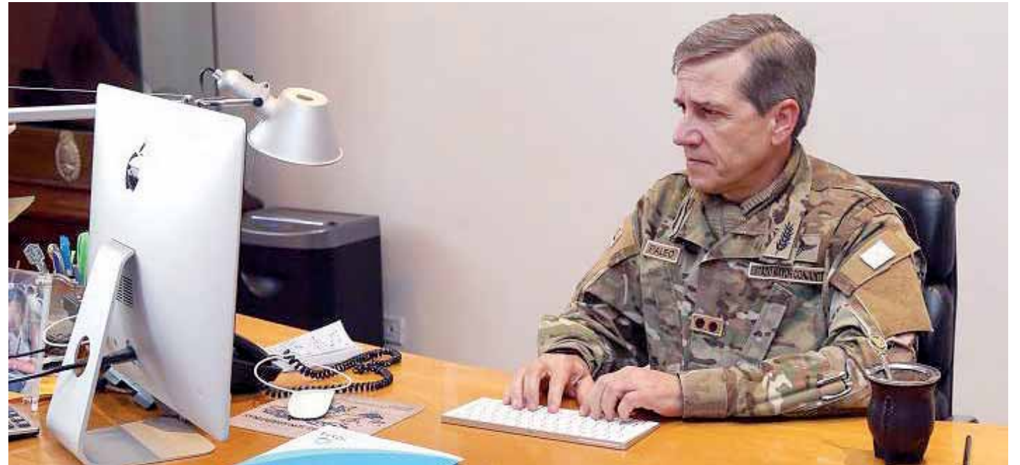
El general argentino Juan Paleo comandó un ejercicio, Operación Puma, en el que ensayaba la invasión militar de Venezuela

Comando Sur de las Fuerzas Armadas de Estados Unidos cuyo jefe, el almirante Craig Faller hizo esfuerzos personales para involucrar a las fuerzas armadas argentinas en el proyecto sobre la base de supuestos acerca de la situación interna de Venezuela y su fuerza armada, lo cual condujo al fracaso e incluso al ridículo.