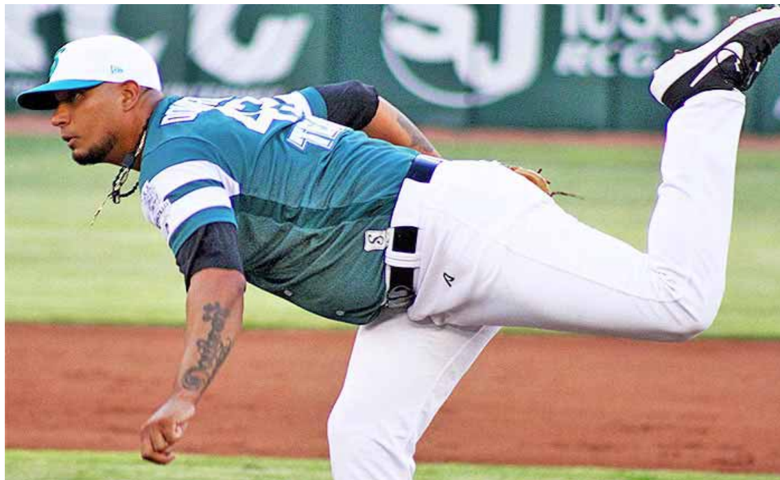
Félix Doubront tuvo experiencia en las mayores ante de ir a México

Doubront también cuenta experiencia en la Liga Mexicana de Pacífico, con Mayos de Navojoa, en la campaña 2020-2021. También ha visto acción con el Lotte Giants de la Organización Coreana de Beisbol (KBO), en 2018. Antes, el tirador disputó seis años en las Grandes Ligas con Medias Rojas de Boston, Cachorros de Chicago, Azulejos de Toronto y Atléticos de Oakland del 2010 al 2015.