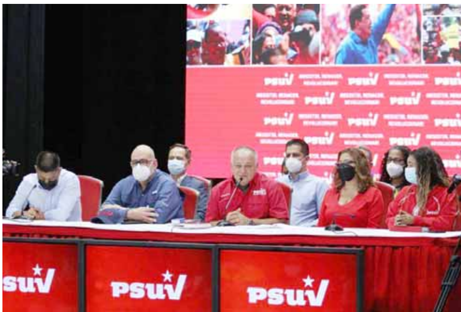
En Venezuela “estamos decididos a ser libres”, enfatizó Cabello