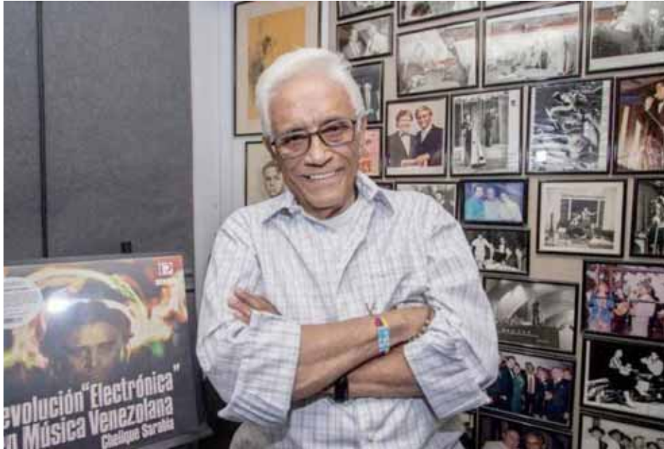
Este margariteño siempre tenía la musa despierta.

“Ansiedad” lo sembró en la mente de venezolanos y extranjeros