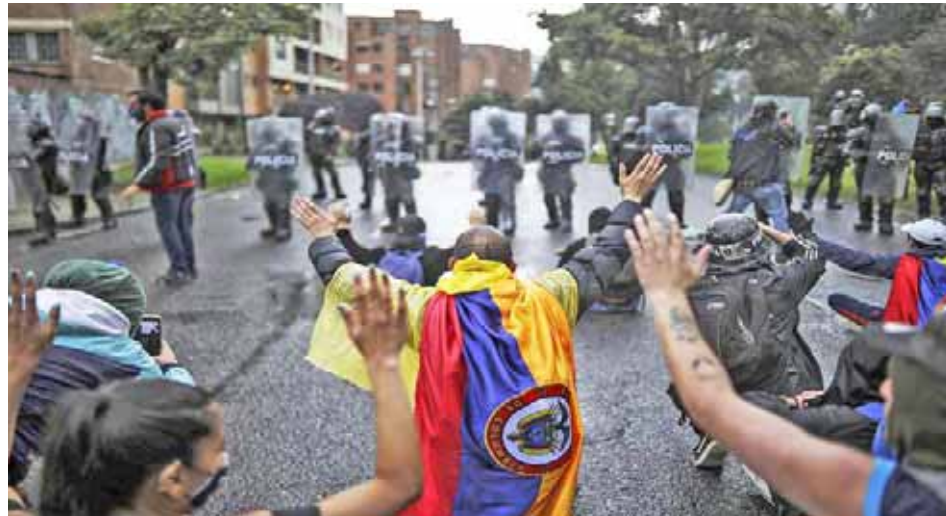
En el comunicado la comunidad internacional destaca la importancia de promover la paz para poder celebrar los comicios

Los países firmantes destacan la importancia de que Colombia pueda reali-