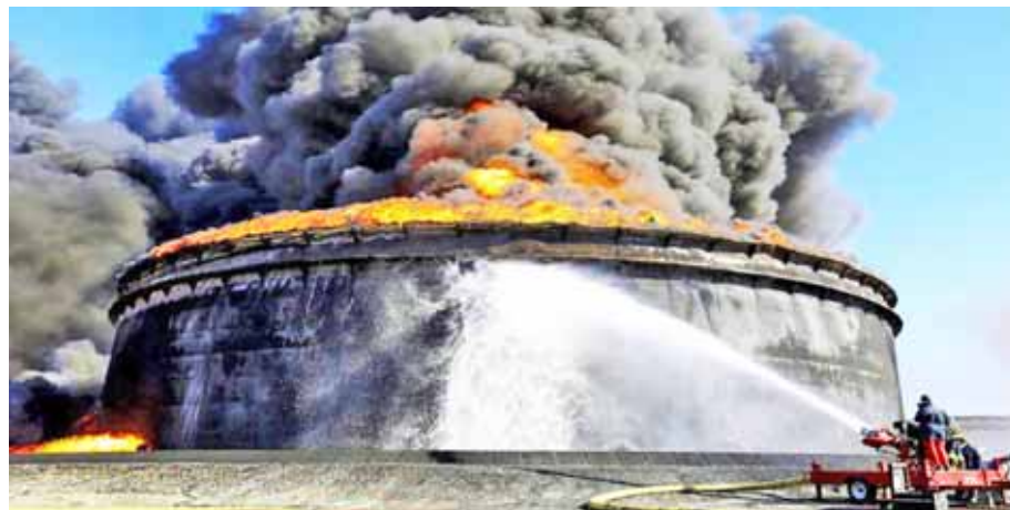
Libia disminuyó su producción de crudo en momentos en que sube el precio del barril por la situación Rusia-Ucrania