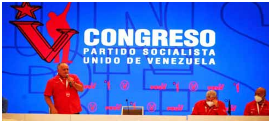
“Un revolucionario no puede hacerle el trabajo a la oligarquía”, alertó Cabello

“Aquí nadie está obligado, quien ocupa un cargo lo hace de manera voluntaria, en consecuencia, quien usa esos cargos para su enriquecimiento personal (...) le hace daño a la Revolución, si usted falta tiene que ser sancionado más severamente por el partido y por las leyes”, aseveró el dirigente de la tolda roja