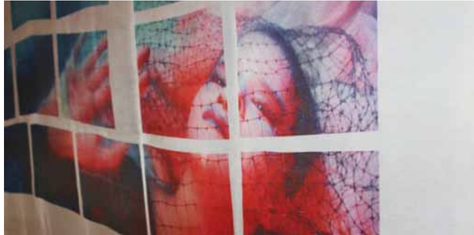
También se podrá ver en formato telemático