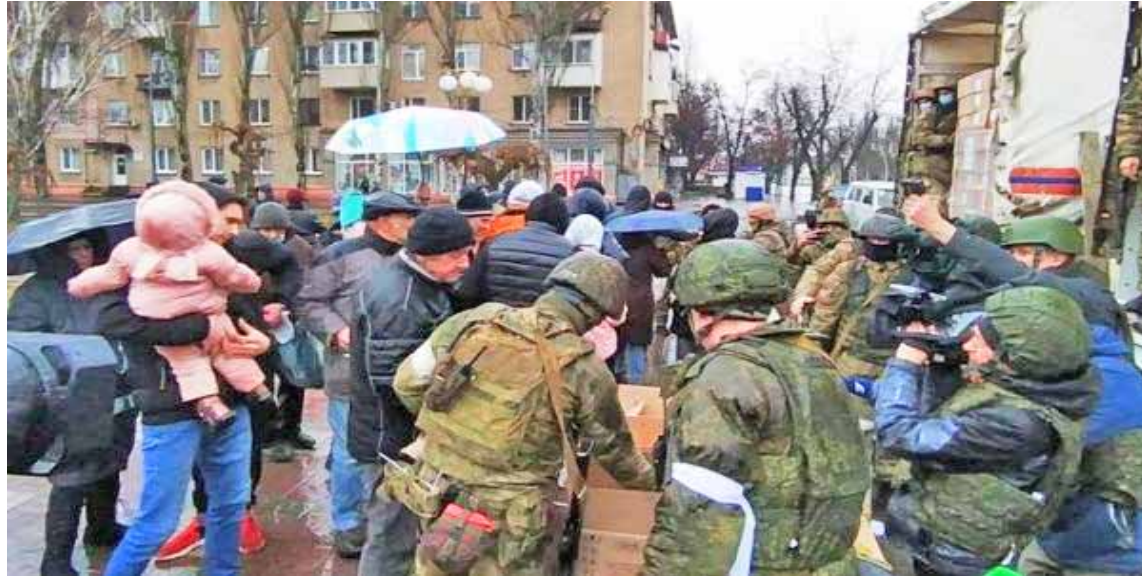
Ciento veinte toneladas de ayuda humanitaria fueron entregadas en Ucrania

T/ Redacción CO-Rusia Today-Sputnik-Telesur