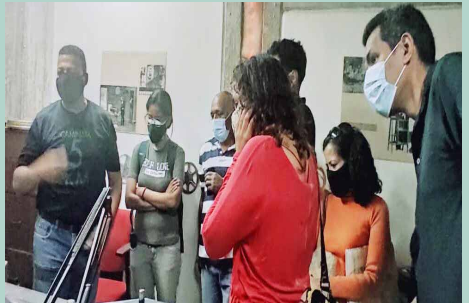
Las actividades forman parte del programa CineEncuentro de la FCN

Con la llegada de la COVID-19 al país, la Fundación Cinemateca Nacional se reinventó y creó el programa para la formación con el uso de plataformas virtuales llamado Cinemateca en Línea ;