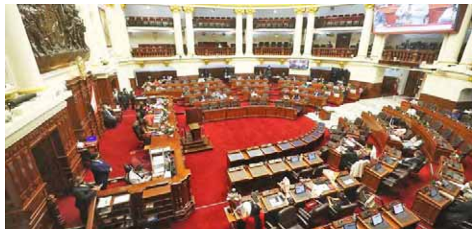
Es el segundo intento de las bancadas opositoras contra Pedro Castillo

"Estamos llevando adelante esta moción porque creemos que es una alternativa para salir de la crisis política en la que nos encontramos y agradecemos a