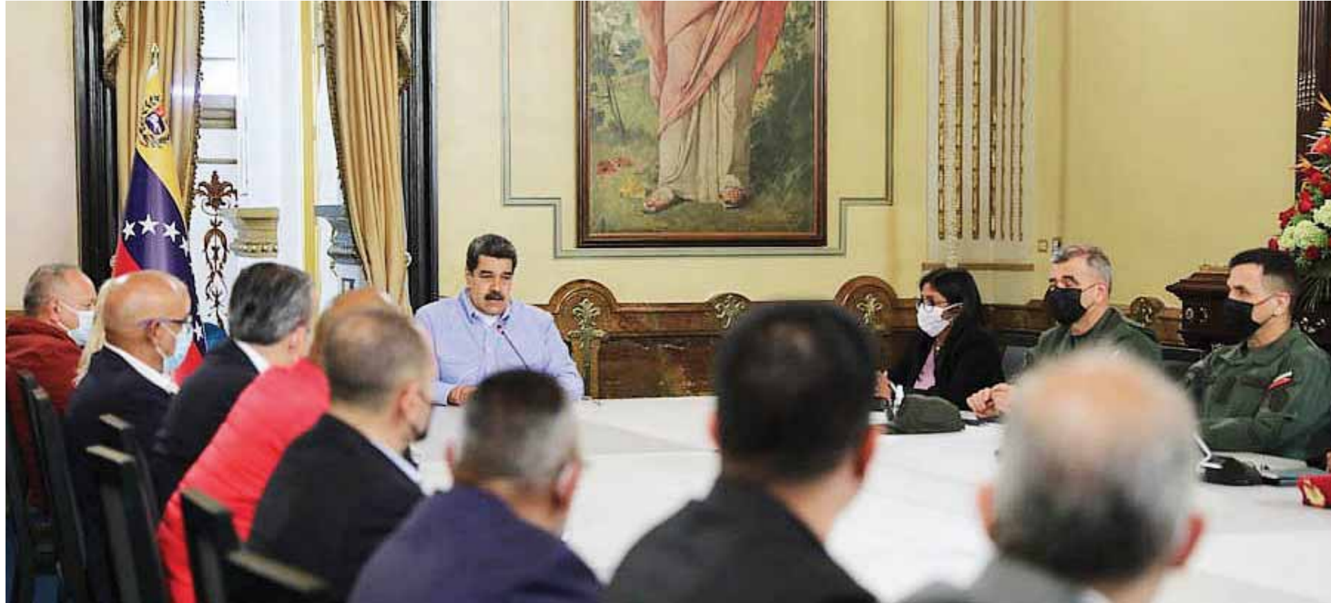
Es el tiempo de la diplomacia, de la palabra, de la verdad y de la paz para que la situación no escale y todos perdamos, declaró el presidente Nicolás Maduro

El Mandatario venezolano va un paso adelante en su percepción y análisis del escenario de la guerra