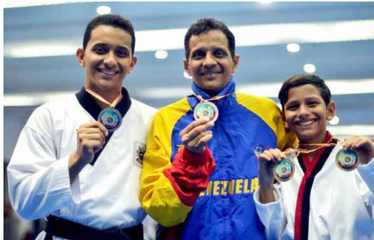
Ziade tiene varios ciclos olímpicos

El criollo, pionero del taekwondo venezolano a nivel de incursiones en eventos del ciclo olímpico, brilló en primera instancia con la ejecución del poomsae Koryo donde alcanzó un puntaje de 6.53, se-