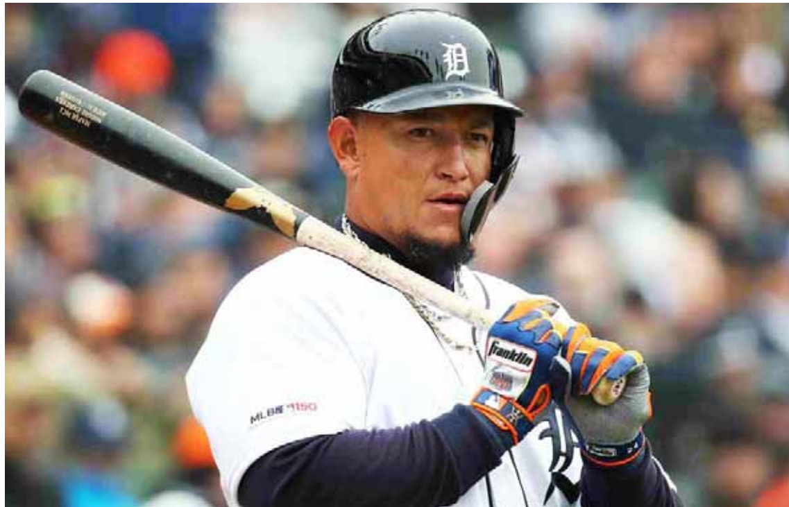
Cabrera ya tiene casi sus dos pies en Cooperstown

Pareciera que hay razones para ilusionarse, si bien los bengalíes terminaron con récord de 77-85 en 2021, su sexta campaña negativa de las últimas siete, se