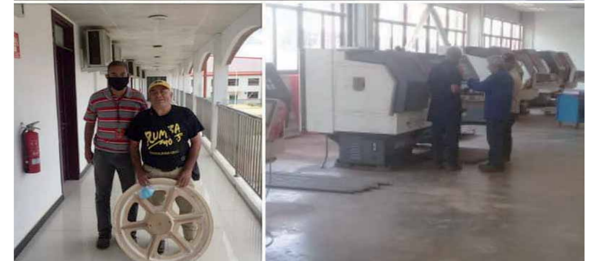
Alianza histórica de sector hidrocarburos de Pdvsa Zulia con trabajadoras y trabajadores del Complejo Industrial Fábrica de Fábricas Hugo Chávez Frías en Anaco

ayuda del gobernador de Carabobo, Rafael Lacava. Además añade que los cambios en la industria deben ser más profundos para poder lograr los objetivos, y que no se debe olvidar que ya ha pasado más de un siglo de la explotación petrolera y más de 50 años de la creación de Pdvsa.