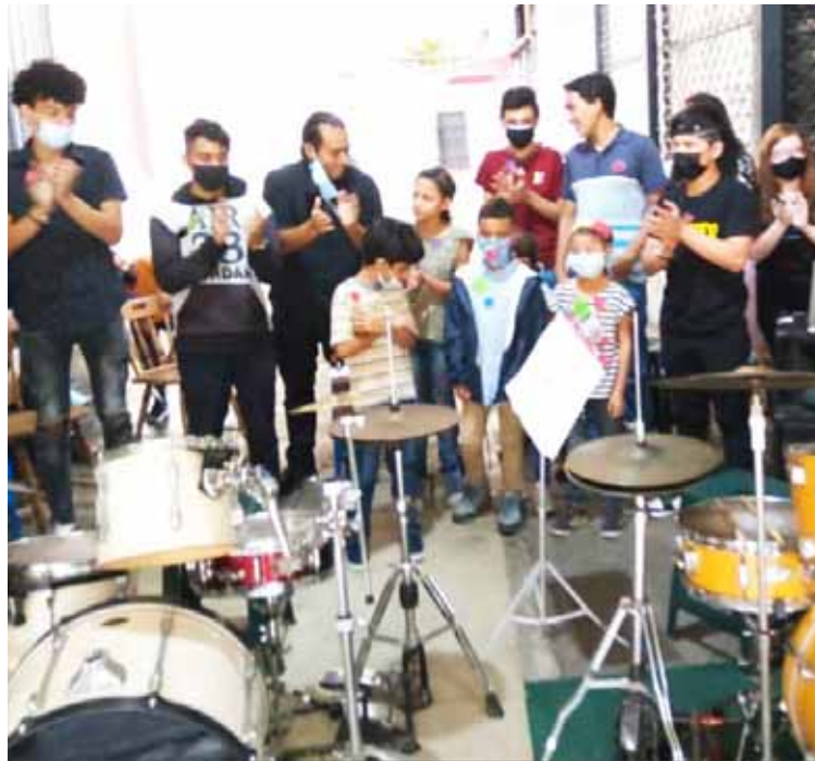
El programa formativo es el resultado de unos 24 años de trayectoria docente