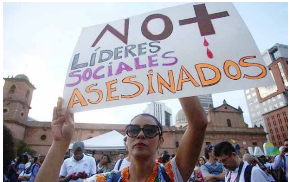
Indepaz afirma que desde la firma del Acuerdo de Paz en Colombia han sido asesinados 1.326 líderes