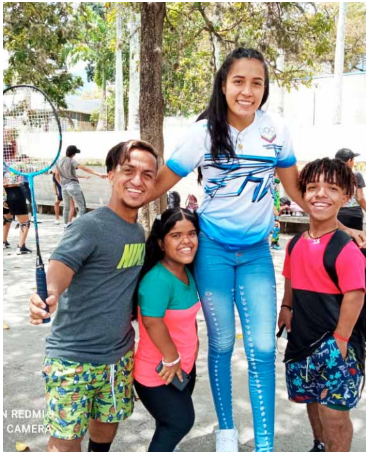
La inclusión siempre debe ser el norte

Atletas se preparan para Suramericanos de la Juventud Rosario 2022, Argentina