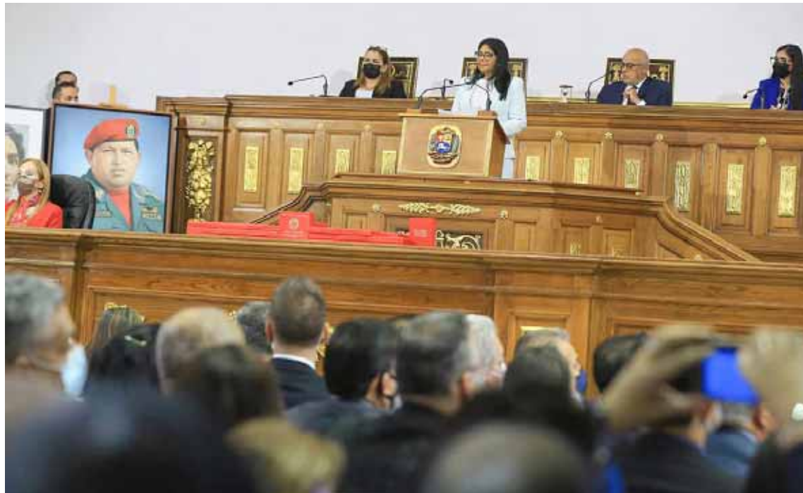
Al país le aplicaron 502 medidas criminales, informó Rodríguez

Afirmó que Venezuela al estar excluida del sistema formal