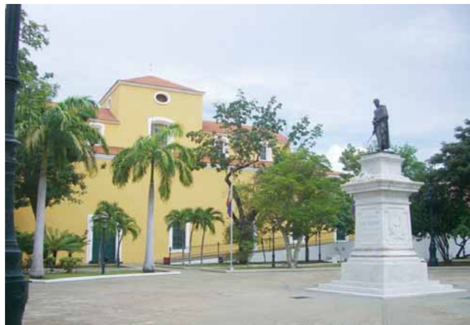
Plaza Bolívar en Ciudad Bolívar

El sábado 23 de marzo de 1822, bajo el número 128, se publicó el último número del Correo del Orinoco. Paradójicamente el periódico creado por Simón Bolívar para defender la causa independentista, difundir los ideales de la naciente república y combatir las mentiras de la Gazeta de Caracas , cierra su taller en un momento estelar, cuando Venezuela, tras la victoria en Carabobo, queda liberada del yugo español y se consolida la creación de Colombia con la unión de Nueva Granada, Venezuela y Quito. Sin embargo, el noble periódico angostureño dejaba de tener sentido a orillas del gran río Orinoco, debido al traslado del centro político, primero a la Villa del Rosario de Cúcuta, luego a Santa Fe de Bogotá, además, Bolívar emprende en 1822 la liberación de los pueblos del sur. También se afirma que