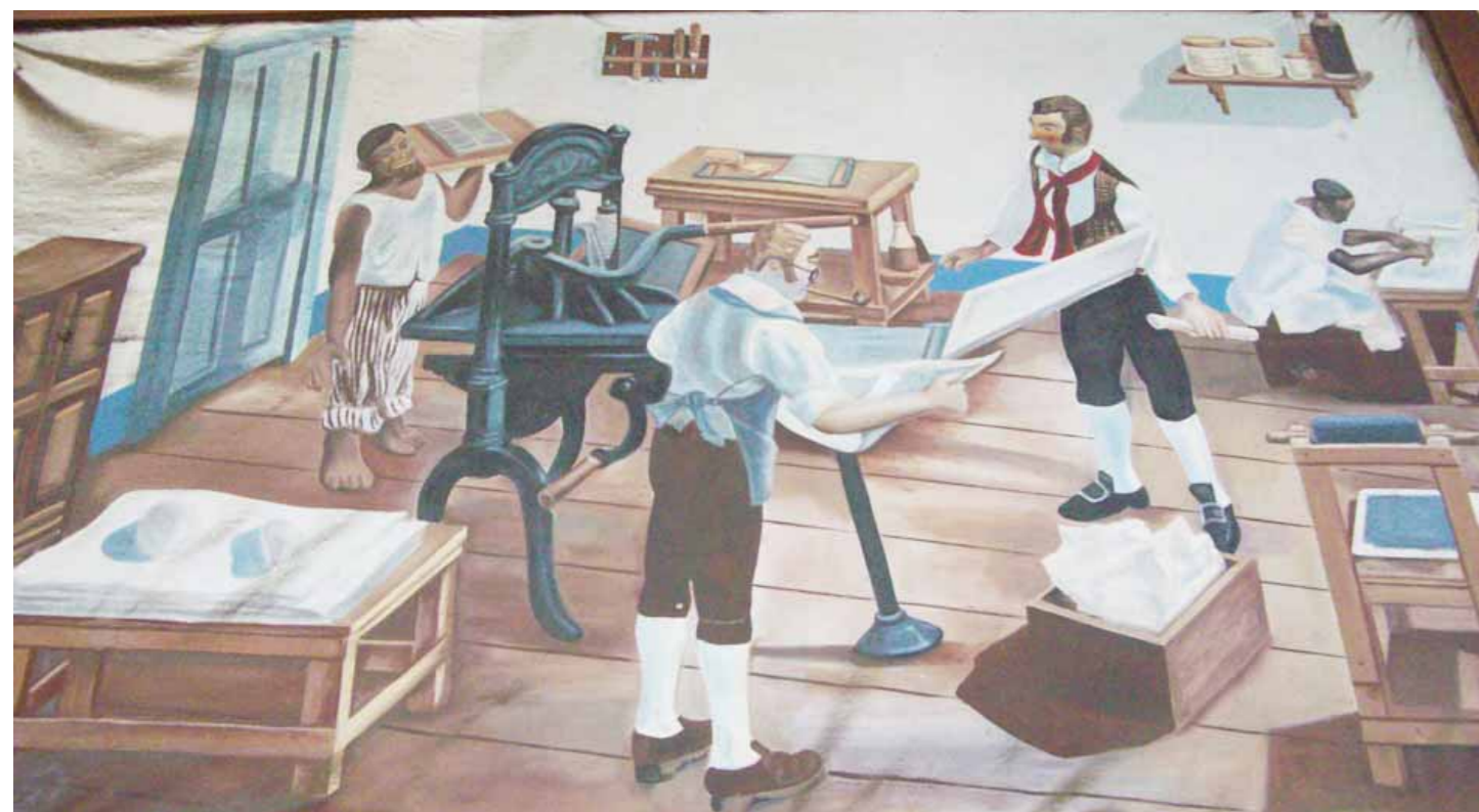
Recreación de la redacción del Correo del Orinoco

Hace 200 años, el medio impreso creado por Simón Bolívar cerraba una etapa gloriosa del periodismo venezolano, tras el triunfo final en la guerra de liberación contra España. El Correo del Orinoco empezó cuando Colombia era una fantasía y terminó cuando las tierras libres del nuevo Estado estaban ya bañadas por tres mares: Atlántico, Caribe y Pacífico