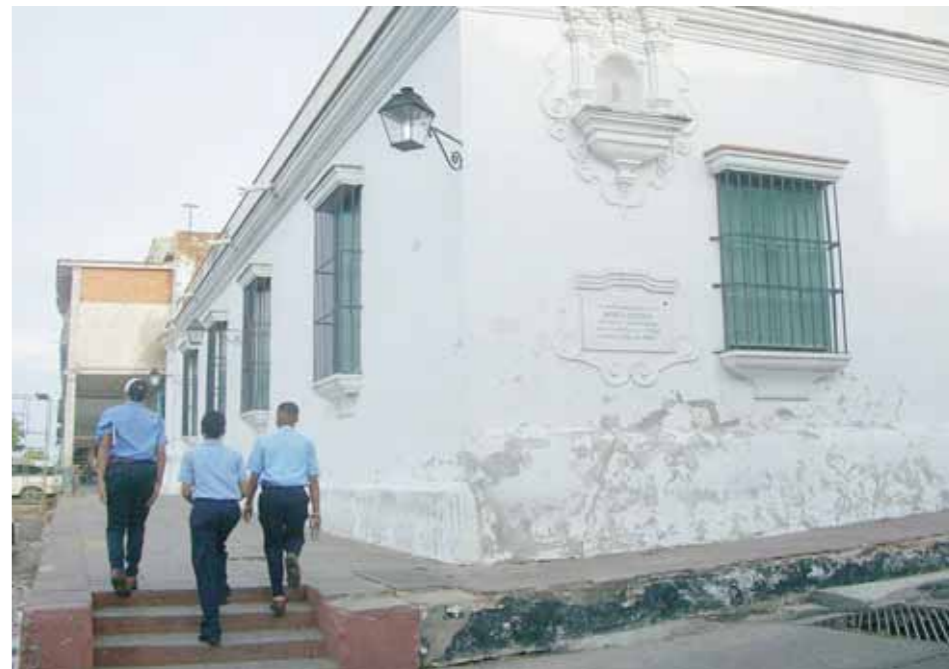
Casa donde se editó el impreso

Primeramente, el periódico de cuatro páginas, se diseñaba a dos columnas. Después, desde el número 12 en adelante, a tres columnas. La suscripción costaba un peso mensual para los habitantes de Angostura; se repartía en tierra por postas y en embarcaciones al exterior.