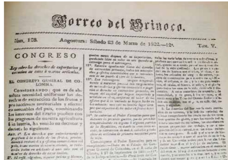
Último número del periódico

Rodríguez indica que “Los redactores del ‘Correo del Orinoco’ no pasan por alto ninguna de las imposturas de la Gazeta de Caracas ”. En el Nº 28 (24-IV-1819) se mofan de la “graciosísima Gazeta ”, que dedica sus números 236 y 237 a exaltar hiperbólicamente el paso del Arauca por Morillo -al extremo de reputarlo por increíble- a tiempo que se cuentan derrotas imaginarias sufridas por Páez. En esa misma edición -como para remarcar la magnitud de los embustes- se insertan