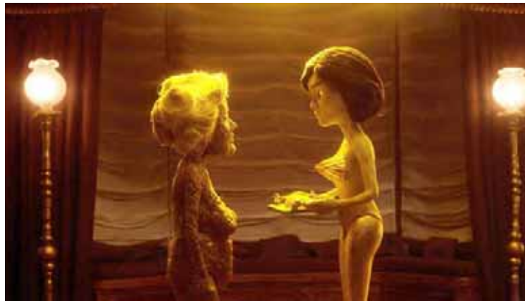
Corazón de oro, del francés Simon Filliot, se llevó el máximo galardón en 2021

Para el área narrativa audiovisual, el festival presenta las categorías de cortometraje ani-