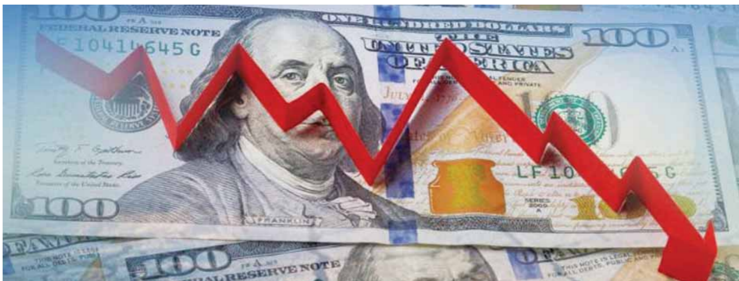
Occidente no le ha dejado otra salida a Rusia que la de crear una alternativa a la hegemonía del dólar

Lo que ha conseguido la diplomacia estadounidense es obligar a Rusia a ser más autosuficiente en el plano económico, y a desvincularse del sistema financiero mundial dominado por Estados Unidos,