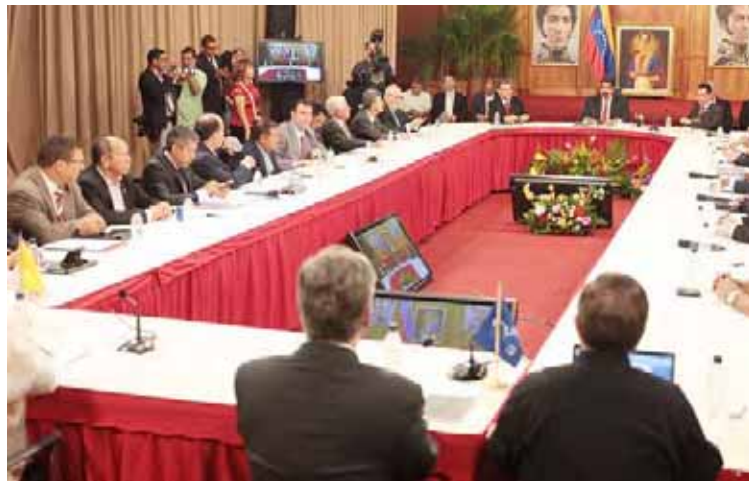
El diálogo toma fuerza en la vida política del país

En esa misma dirección, la organización política opositora Primero Justicia (PJ), por medio de un comunicado, señala que este partido “sigue comprometido con la negociación como mecanismo de solución de los problemas de los venezolanos,