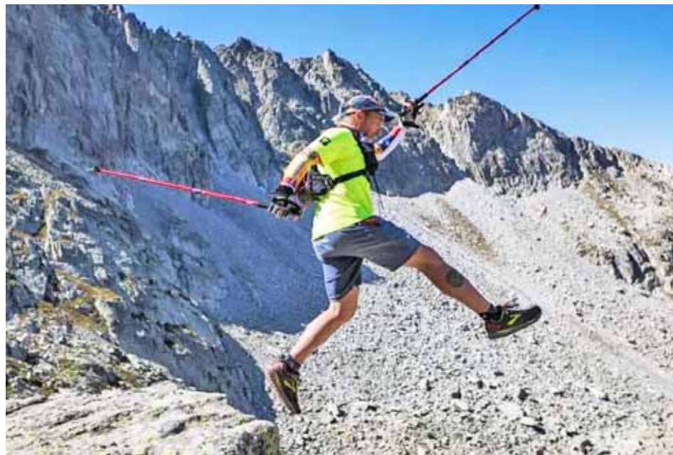
Deportivamente Vera ha recorrido varios continentes

“Ha sido un arduo camino pero ha valido los esfuerzos porque he aprendido que el deporte tiene la magia de unirnos. Quiero proyectar otra imagen