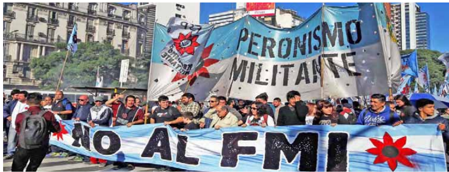
Para las organizaciones argentinas se trata de un acuerdo fraudulento

Instan a los legisladores a no autorizar el pago de la deuda, como estipula el acuerdo recién alcanzado entre el Gobierno de Alberto Fernández y el ente financiero, que probablemente será votado este jueves por las cámaras de Diputados y Senadores