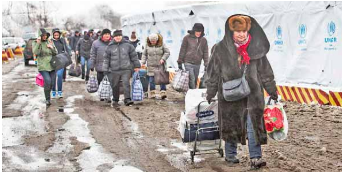
Más de 200 mil personas ha sido evacuadas de Ucrania por Rusia a través de corredores humanitarios

La operación especial de Rusia en Ucrania comenzó el 24 de febrero a pedido de las autoproclamadas repúblicas populares de Donetsk y Lugansk para repeler las agresiones de Kiev. La acción también está orientada a proteger a la población del ge-