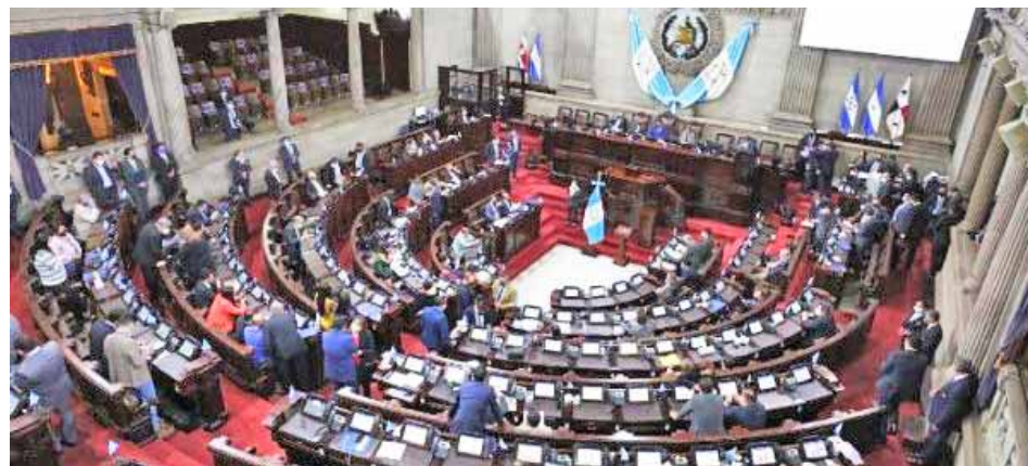
La ley prohíbe en las escuelas promover programas relativos a la diversidad sexual y la ideología de género

Varios sectores de la sociedad consideran que esta normativa presenta una limitada concepción del matrimonio al declararlo como una institución entre un hombre y una mujer. Consideran que atenta contra la diversidad sexual