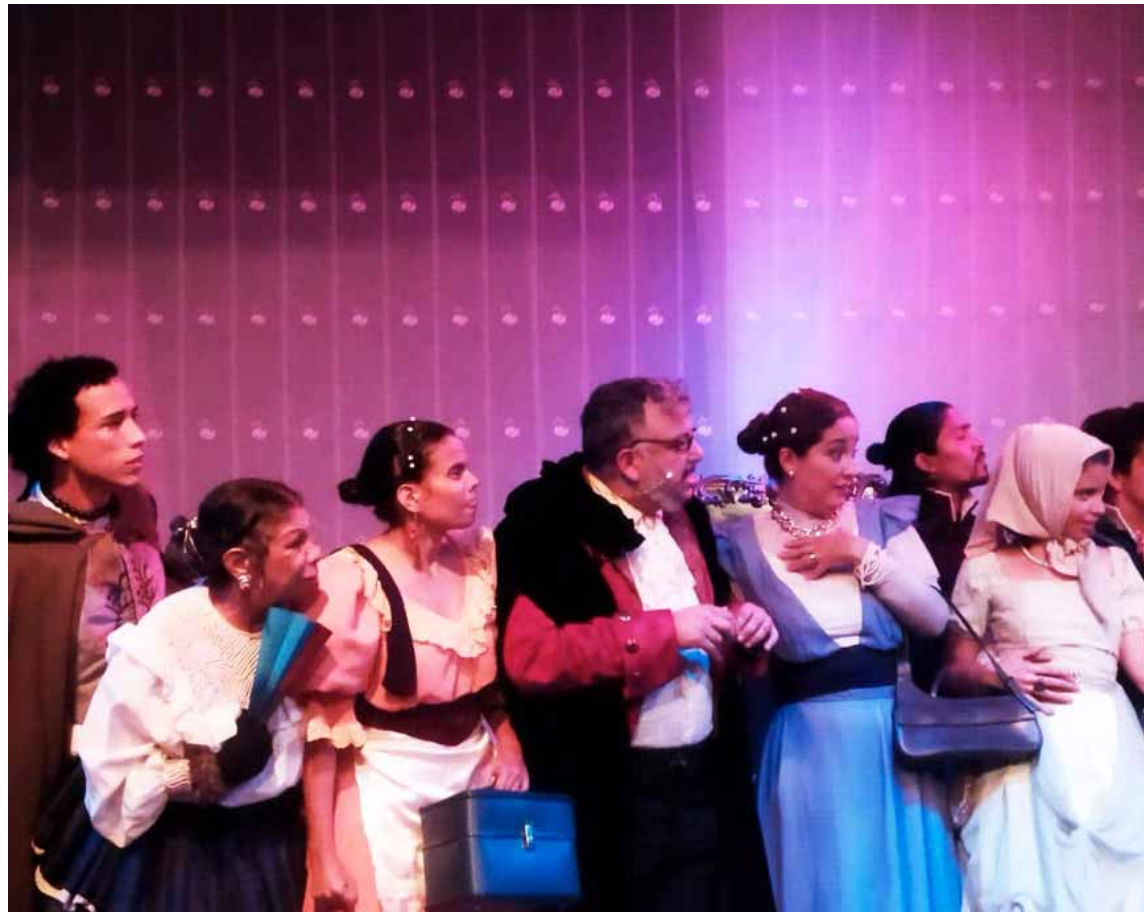
Destacan la calidad de las actuaciones y la frescura de la escenografía

Sobre Tartufo no queda ya nada que decir.