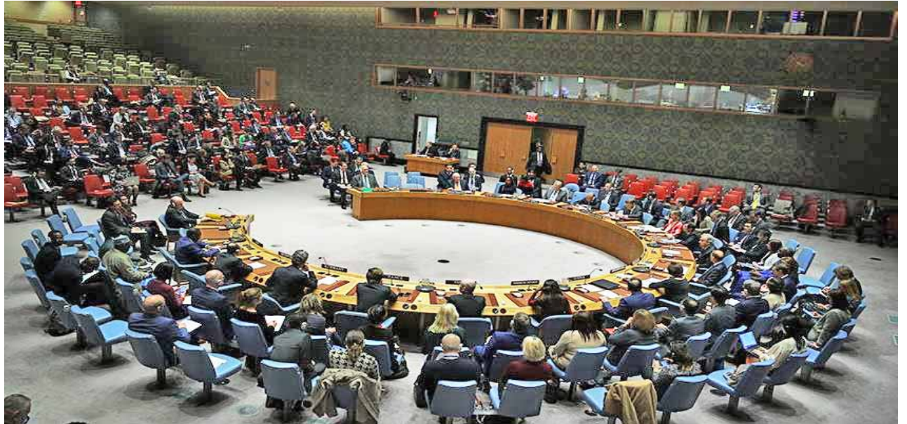
El documento instaba a las partes a garantizar la protección de civiles y a abstenerse de ataques

El presidente de Rusia, Vladimir Putin, ordenó ayer aceptar el pago del suministro de gas natural ruso a Europa solo en rublos.