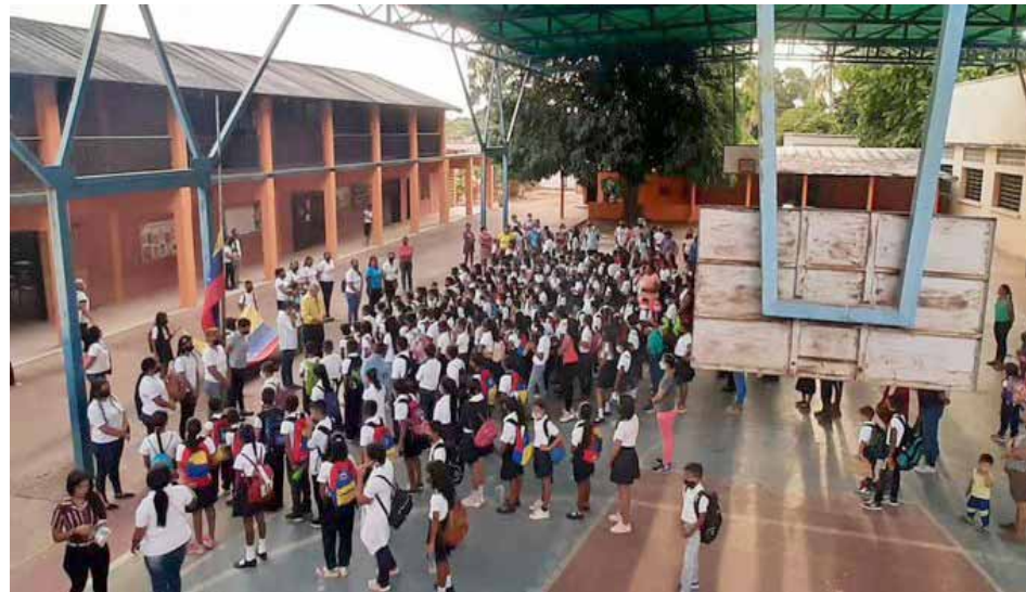
“Alcanzamos la cifra del 73 por ciento de niñas y niños vacunados”, precisó Santaella

La decisión de normalizar las clases presenciales la dio a conocer el presidente Maduro el pasado 24 de marzo, en consideración del avance y eficacia de las jornadas de vacunación contra el Covid-19 en niños y niñas. No obstante, se acordó el retorno a las aulas de manera presencial con la aplicación de todas las medidas de bioseguridad y bajo un cronograma específico.