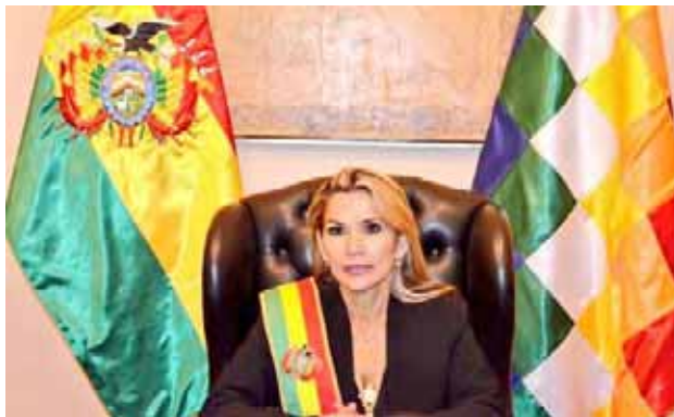
Jeanine Áñez enfrenta varios cargos relacionados con el golpe de Estado que acabó con el mandato de Evo Morales

T/ Redacción CO-Prensa Latina