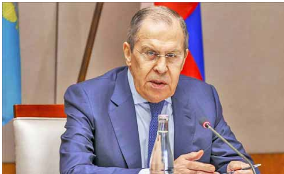
Para lograr acuerdos que pongan fin al conflicto, Rusia y Ucrania vuelven a negociar en Estambul

Sobre las nuevas sanciones impuestas por los países europeos a Moscú debido