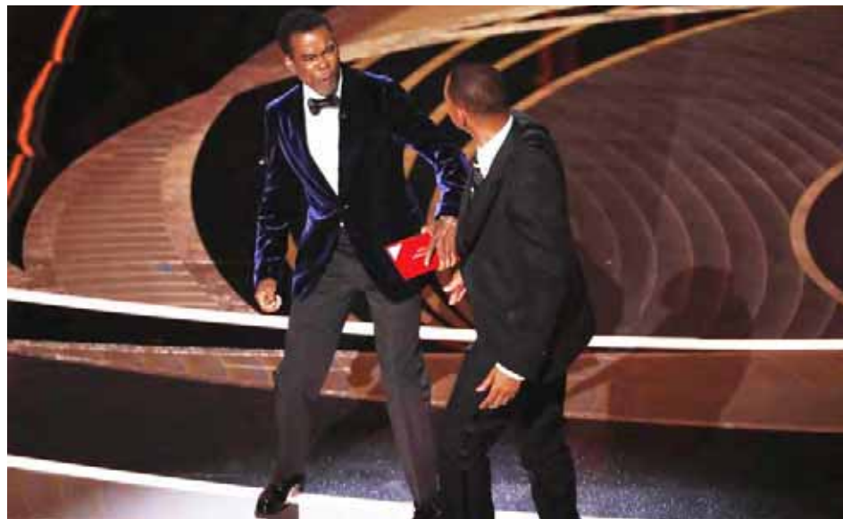
Smith y Rock reventaron las redes sociales en las últimas horas

Lo que quizás no sabía Rock, aunque lo dudamos, es que la esposa de Will Smith tiene alopecia, un trastorno autoinmune que causa la caída del cabello y del que ha hablado públicamente.