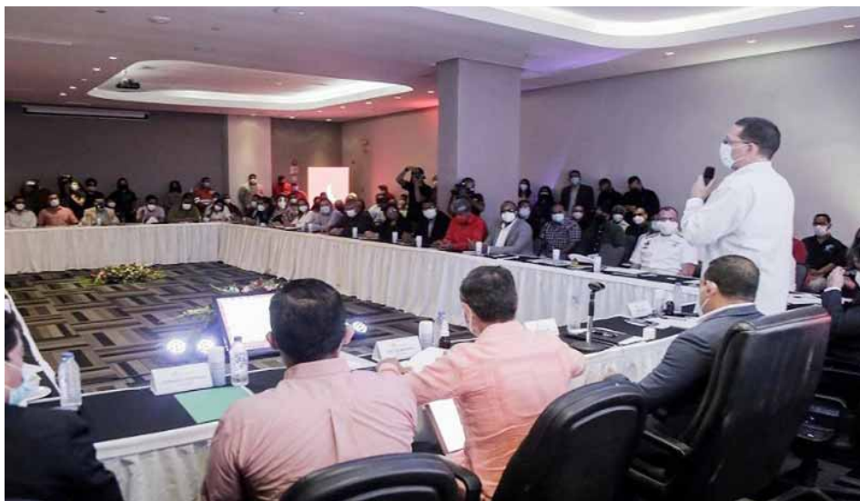
Se realizó un foro con empresarios, consejos comunales y emprendedores