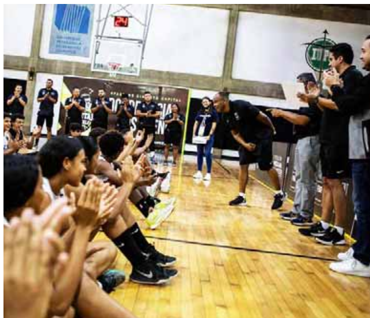
La formación técnica es clave para cualquier deporte