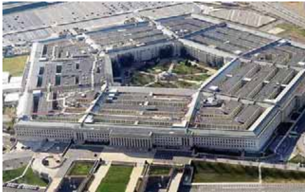
El Pentágono afirma que salvaguardará los intereses nacionales vitales de EEUU

“Una de las prioridades para Washington es la defensa de la patria frente a la creciente amenaza polifacética que supone Pekín”, expresó la cartera de Defensa en un comunicado