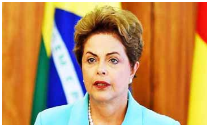
Dilma Rousseff fue destituida por el Senado brasileño tras un juicio político

T/ Redacción CO-Telesur