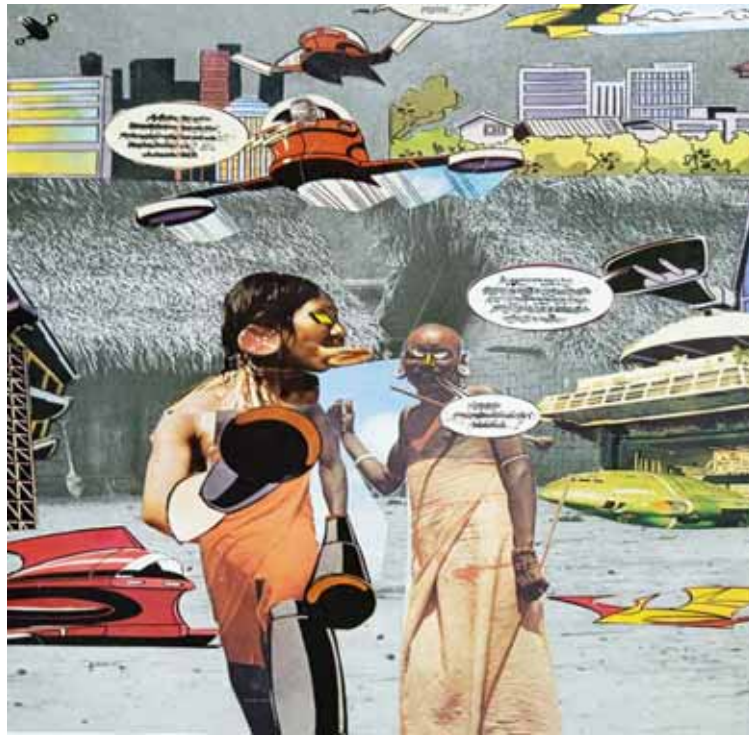
El artista invita al espectador a escribir su propia historia

“Siempre vi en la figura del negro africano a un ser de otro mundo, por su arte, sus tallas, muchas de las cuales se pueden ver aquí (en el MAA). Cuando