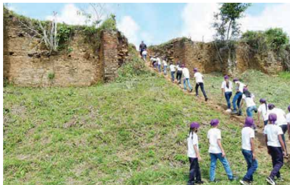
El fortín de San Vicente

El anuncio fue realizado por el gobernador durante la sesión solemne del pasado martes 26 de abril al pie de las ruinas del castillo de San Vicente, en Nirgua, con motivo de la conmemora-