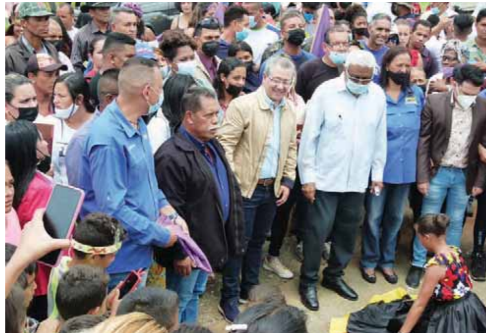
El gobernador Julio León Heredia, al centro, encabezó los actos

Protagonizó el primer alzamiento antiesclavista en América y lanzó el primer grito de libertad en territorio venezolano