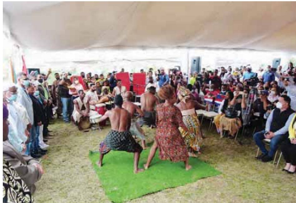
Teatro Negro de Barlovento