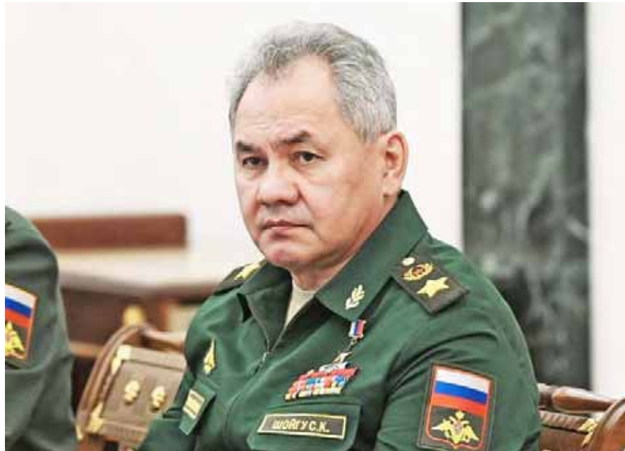
“Los militares rusos garantizan la seguridad de la población de Donbás”, dijo el ministro de Defensa Serguéi Shoigú

“Cualquier convoy de la Alianza del Atlántico Norte que llegue al país con armas o material para las necesidades de las Fuerzas Armadas ucranianas será considerado por nosotros como un objetivo legítimo a destruir y será eliminado”, advirtió el ministro de la Defensa ruso, Serguéi Shoigú, en una conferencia de prensa en la cual afirmó que Estados Unidos y sus aliados de la OTAN siguen enviando armas a Ucrania.