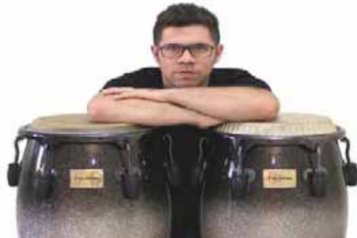
De acuerdo con el artista, es la primera vez que se conjugan estos géneros

T/ Redacción CO