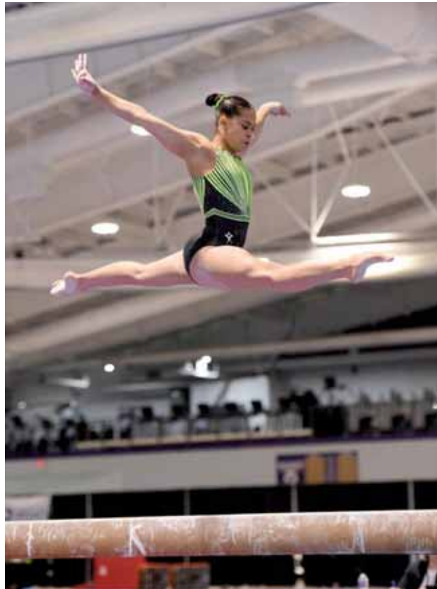
La carabobeña apunta a más logros foráneos

La carabobeña de quince años obtuvo un average total de 38.150 puntos