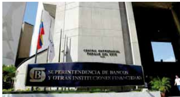
Sudeban quiere las cuentas claras en el sector

Como parte de la ejecución de las políticas públicas de financiamiento de los sectores estratégicos productivos de la economía nacional, llevadas a cabo por parte del Gobierno Nacional, el sector bancario registró en el mes de abril de 2022, un importante crecimiento en los créditos liquidados del 21,25 por ciento respecto al mes de marzo, por un total de 594 millones de bolívares y 2.331 financiamientos, potenciando la dinámica productiva-económica del país.