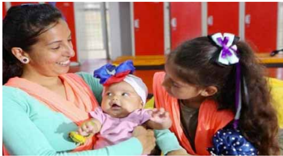
Las madres venezolanas son unas guerreras siempre

“Quiero felicitar a todas las madres, pienso en mi niñez y vida adulta y sé que