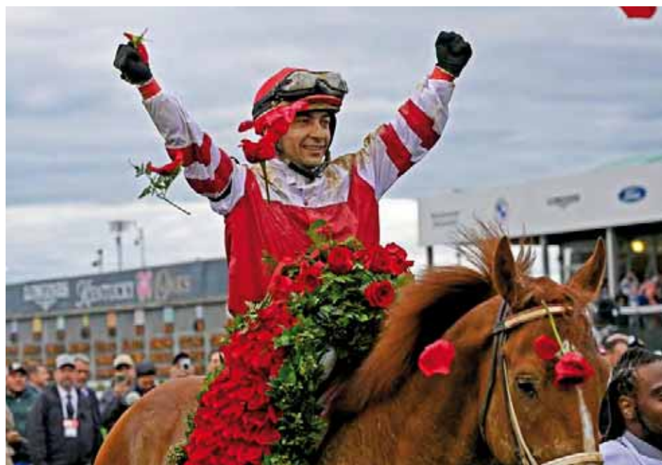
León de último se coló por la baranda

Rick Strike se coló entre los participantes a última hora y no aparecía entre los favoritos para ganar esta prestigiosa carrera de caballos (80-1 en los pronósticos), pero acabó llevándose el triunfo por delante de Epicenter y Zandon, dos que sí aparecían entre los máximos candidatos a obtener la victoria.