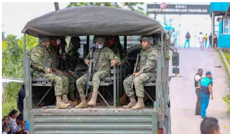
Durante el motín la mayoría de las víctimas fueron ajusticiadas con armas blancas

El funcionario destacó que a simple vista “se puede evidenciar que los que perdieron la vida fueron ajusticiados con arma blanca, la mayoría de cuerpos tienen esas características” y ofreció la ayuda del gobierno a los familiares para trasladar los cuerpos a sus sitios de origen.