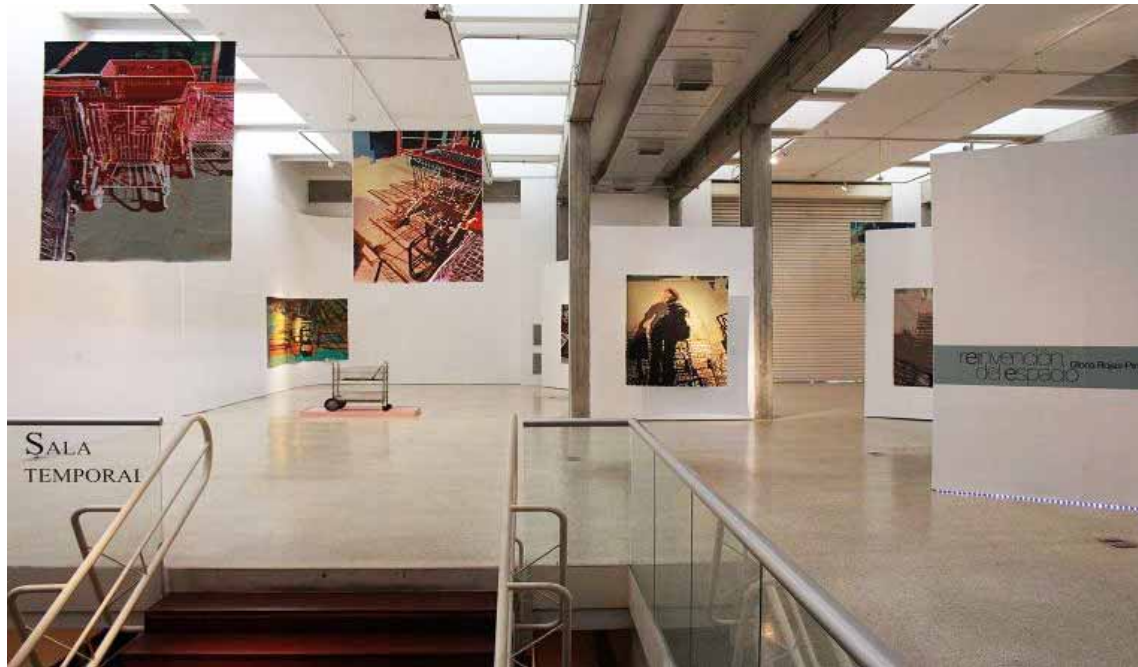
La fiesta de los creadores visuales del país rinde homenaje a Armando Reverón

Abreu muestra su propuesta Dicotomías corpóreas, un discurso que busca cuestionar los aspectos relacionados a la femineidad "impuesta por los medios de comunicación y aquella femineidad auténtica que vemos fuera de los medios", menciona una nota de prensa.