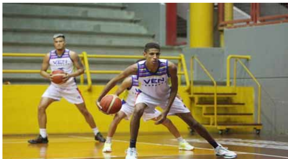
El basquet profesional tiene nuevas caras