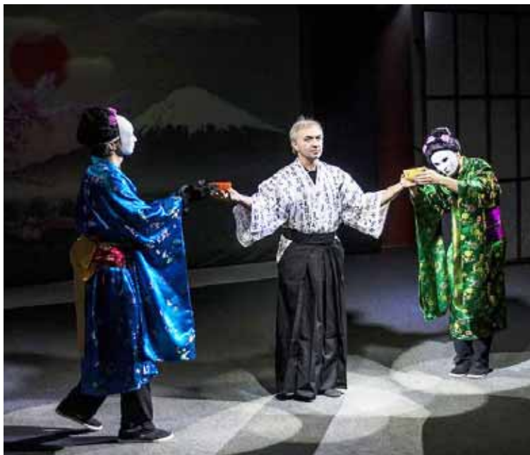
Es la institución más antigua del país en materia de preparación actoral

T/ Redacción CO