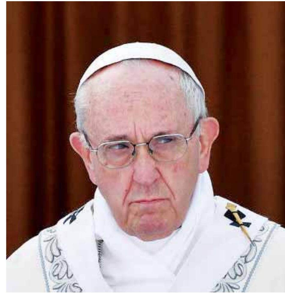
Como quien no quiere la cosa, Francisco le cantó la verdad a la OTAN

No, en Venezuela se da un caso contradictorio: mientras existe una especie de orgía de expresión en la que se hacen incluso llamados abiertos al magnicidio, sigue habiendo, por otra parte, poco acceso a la información oficial y mucho