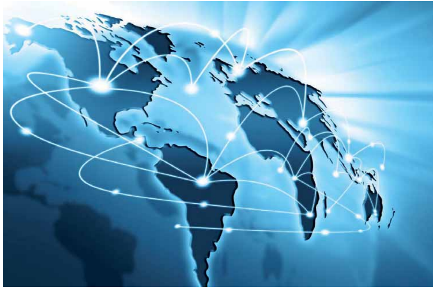
¿Inició la transición hacia la multipolaridad?