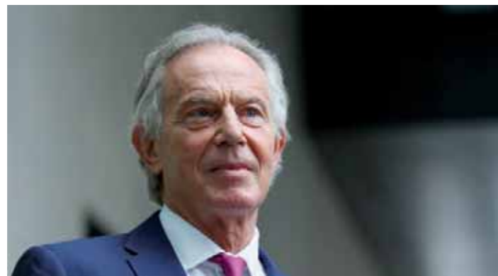
El ex primer ministro británico Tony Blair

basar nuestra política en la certeza de que no lo haría. Incluso dejando de lado a Taiwán, la realidad es que China, bajo el liderazgo de Xi, está compitiendo por la influencia y lo está haciendo agresivamente”, manifestó.