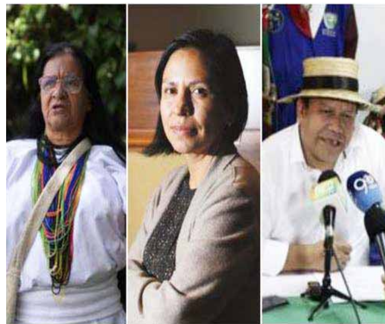
El Gabinete de Gustavo Petro incluirá a mujeres defensoras de derechos humanos

Los medios han destacado que Zalabata, quien representará a los colombianos ante la ONU, es una líderesa indígena del pueblo Ika de la Sierra Nevada de Santa Marta, quien