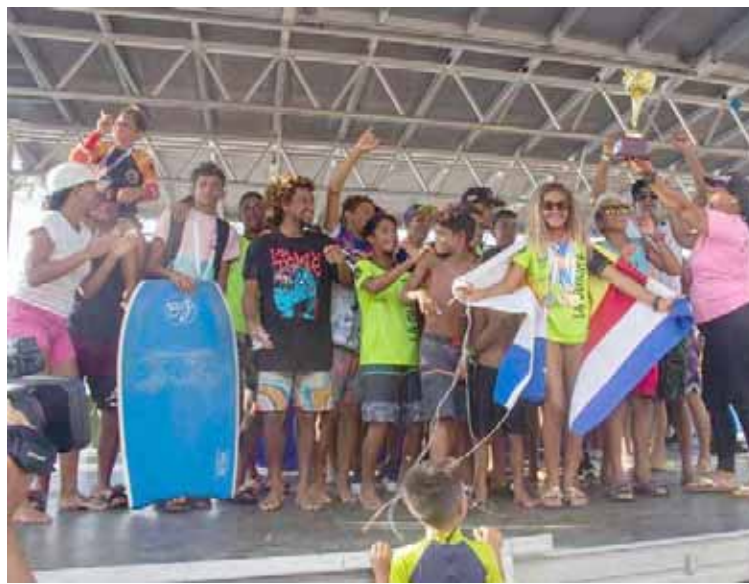
El nuevo talento muestra que puede partir las olas

La válida, que reunió a más de 300 surfistas de todo el país, fue una jornada perfecta para medir el desempeño de los nacionales en las modalidades ta-