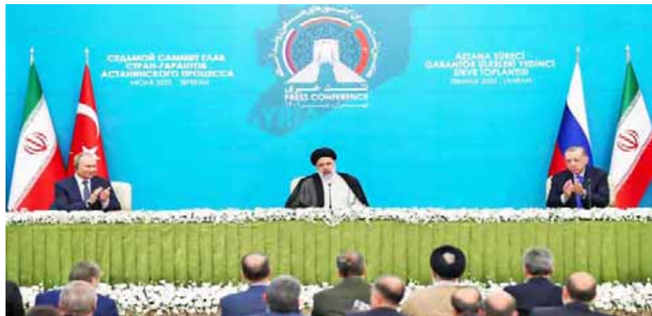
En la reunión trilateral rechazaron las sanciones ilegales contra Siria

T/ Redacción CO-Hispantv- Rusia Today-Sputnik-Actualidad DW