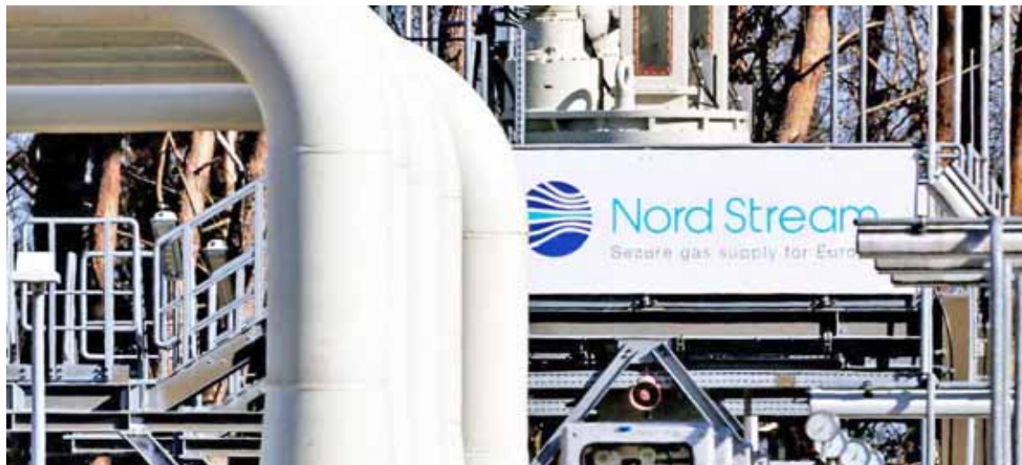
El gas ruso volvió a fluir ayer por Europa

T/ Redacción CO-EFE-HispanTV-Sputnik-Actualidad DW-Rusia Today F/ EFE Moscú