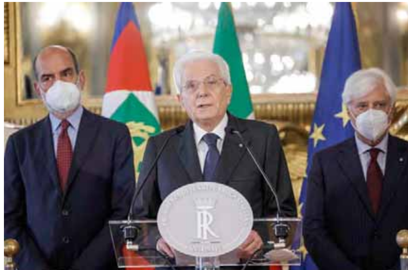
Se espera que las elecciones legislativas anticipadas se celebren el 25 de septiembre

Mattarella, después de escuchar a los presidentes de las dos Cámaras del Parlamento, firmó un decreto en virtud del artículo 88 de la Constitución para disolver el Senado de la República y la Cámara de Diputados, que fue refrendado por el presidente del Consejo de Ministros. Más tarde el Mandatario firmó un decreto para organizar el 25 de septiembre elecciones anticipadas al Parlamento, y la primera sesión de sus Cámaras, el 13 de