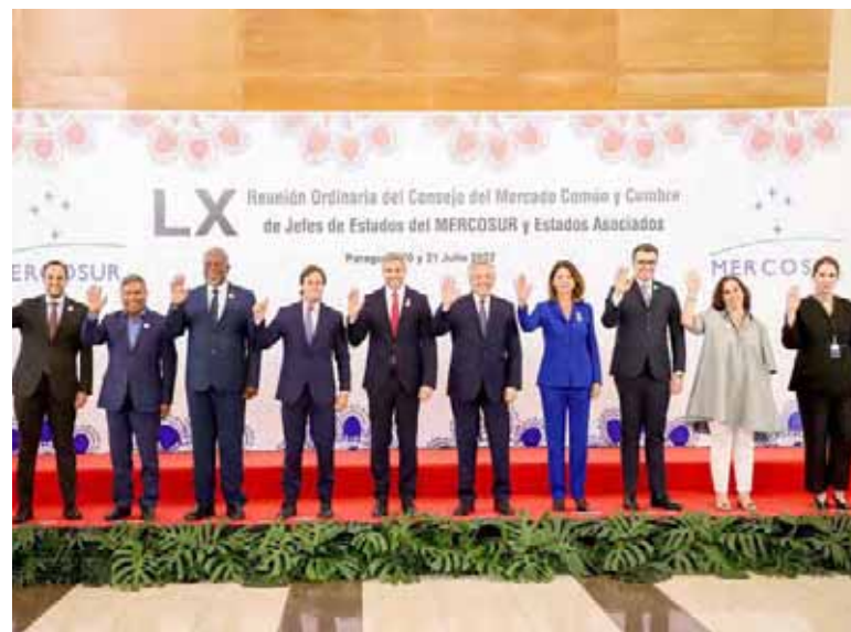
“Es muy dinámica la relación entre Brasil y Rusia”, afirmó el vocero brasileño en Mercosur

Sobre las sanciones impuestas por EEUU y la Unión Europea a Rusia, Arslanian señaló que Brasil y el Mercosur reconocen que las sanciones son factores de perturbación del acceso a varios insu-