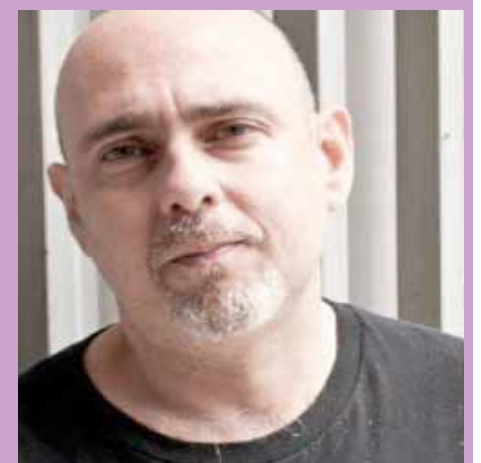
El Show de Willi fue su más reciente largo de ficción