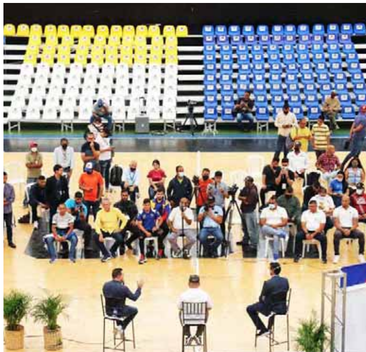
Los organizadores quieren dejar todo listo