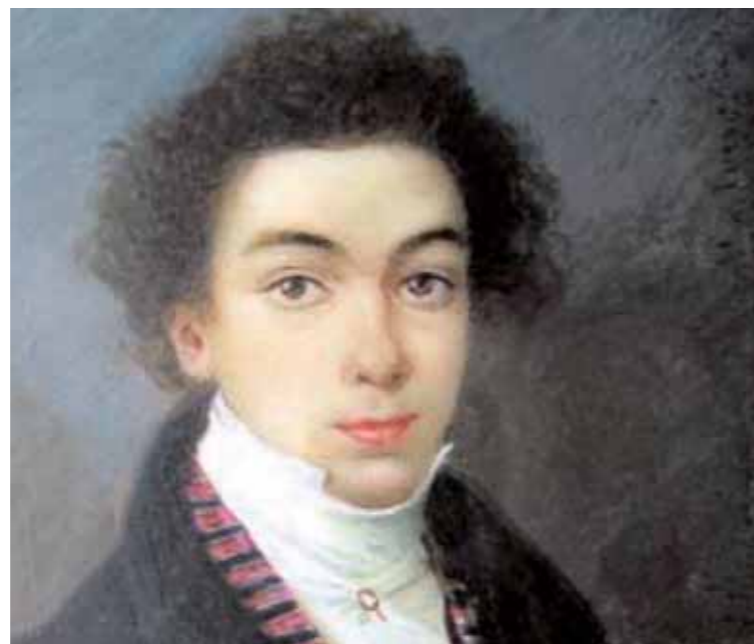
Bolívar a los 11 años de edad

Un hecho que demuestra que para la burguesía y el estamento político venezolano Bolívar era una figura incómoda y casi decorativa, lo testimonia el golpe de abril de 2002, cuando su