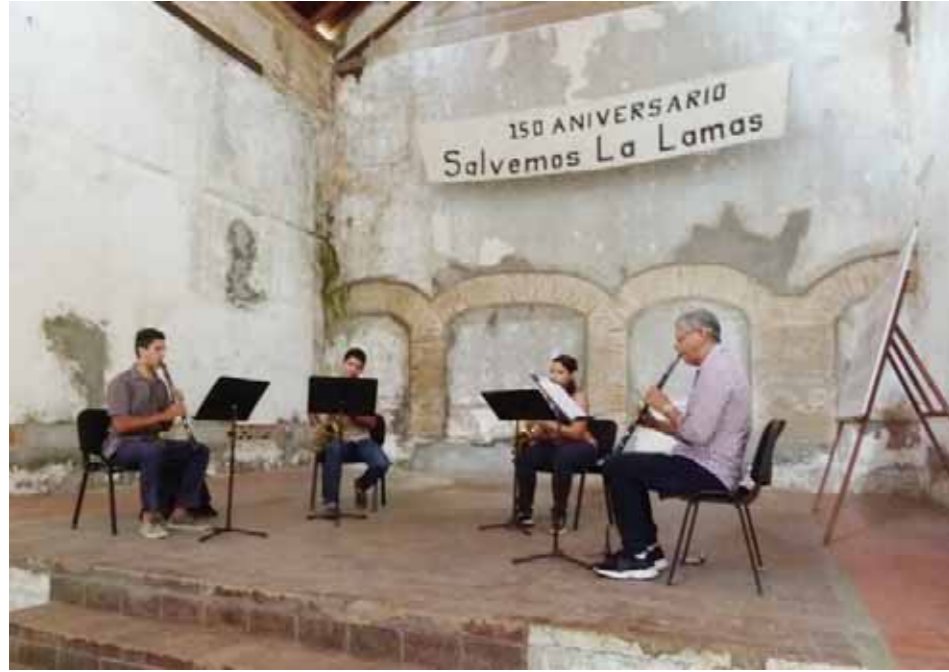
La música no deja de sonar en la escuela