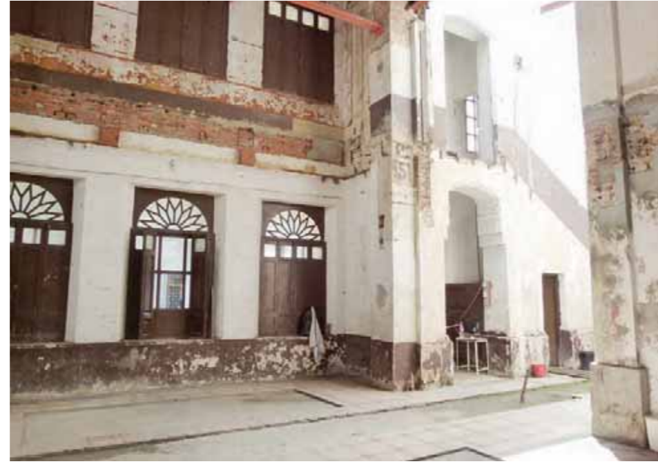
Parte de la estructura está seriamente afectada

AN y el MPPE aprueban recuperar un ícono de la música y la cultura venezolana