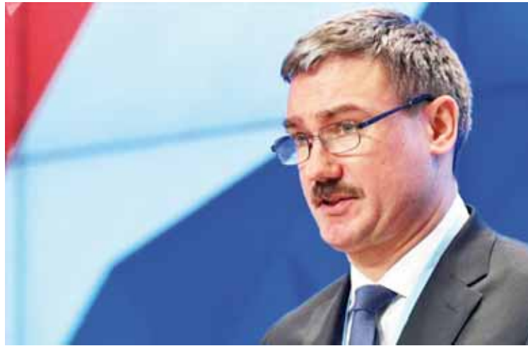
Rusia está dispuesta a garantizar el paso de buques

T/ Redacción CO-Rusia Today-Sputnik-Actualidad DW-Hispantv