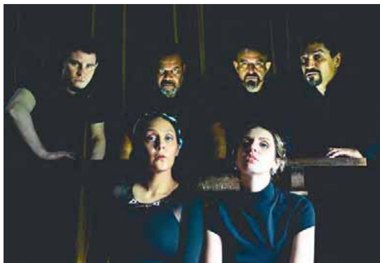
Un elenco que posee grandes registros de voz

T/ Redacción CO-Prensa A.C.H.