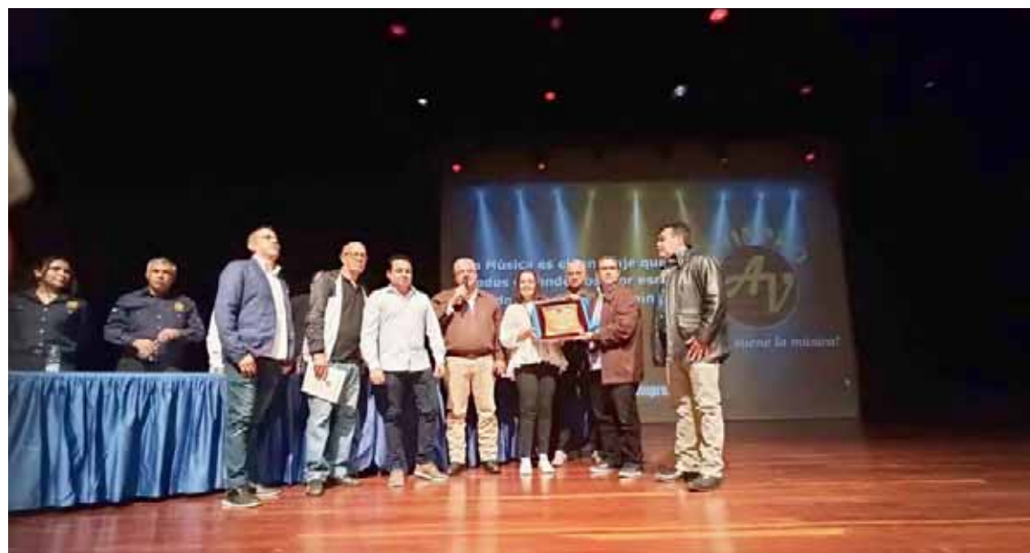
Avinpro les rindió un homenaje en la Casa del Artista

Ese primer repertorio incluía temas como Linda merideña y Tierra tachirensis , pero hubo uno en especial que le