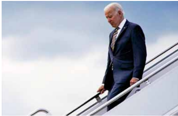
"Biden busca promover la normalización árabe-israelí", dijo el movimiento Hamas

Las organizaciones de los territorios ocupados coinciden en que este viaje del Presidente estadounidense es la encarnación práctica del apoyo absoluto del país norteamericano a la ocupación y una tapadera para los crímenes de Israel