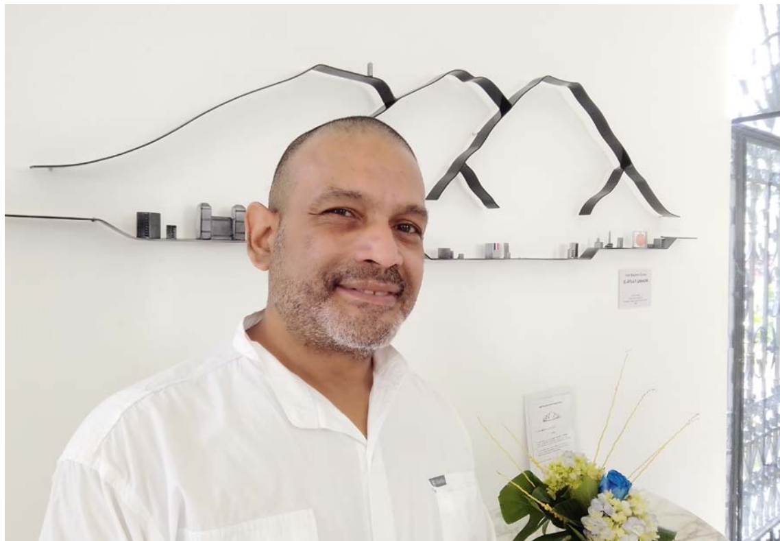
La pieza también le rinde tributo a Jesús Soto

El Ávila y Caracas está configurada por una síntesis de la montaña capitalina, con sus formas y protuberancias características. Por supuesto, no podía faltar como parte indispensable del conjunto el Hotel Humboldt como elemento intrínseco de