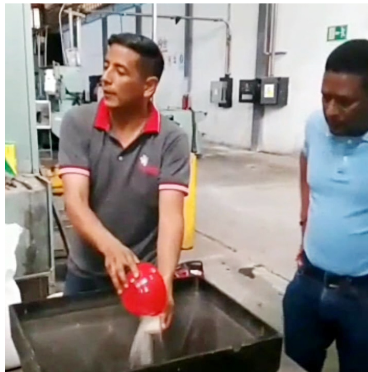
La clase obrera no descansa en pro del país

Durante los trabajos de recuperación de las líneas de producción se contó con el apoyo y participación de trabajadores y trabajadoras del Conglomerado Industrial para la Recuperación Productiva (Cirepro), ingenieros del Movimiento Cayapa Heroica y Uraplast, con el fin de dar apoyo a las empresas que se encuentran ocupada por sus trabajadores y trabajadoras, y lograr el impulso para el salto cuantitativo en el incremento de la producción y el bienestar de la clase obrera nacional.