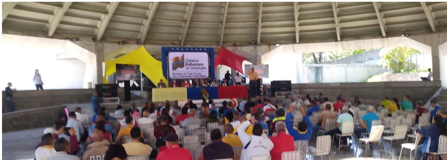
La reunión se llenó de propuestas interesantes

Volvieron a plantear el tema de los salarios justos