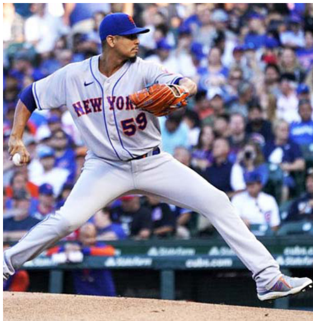
El "guaro" muestra en esta zafra su potencial

Sin embargo, podría pasar a ser quinto abridor cuando se integren Max Scherzer y Jacob deGrom