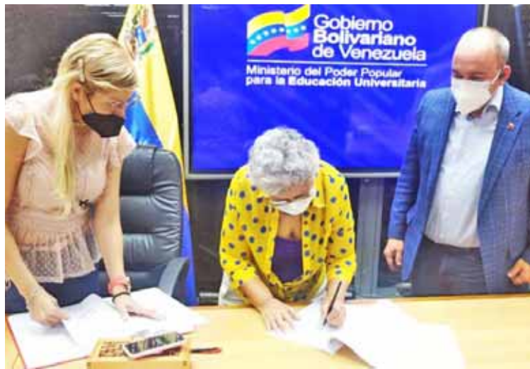
La información la dio a conocer el pasado miércoles a través de la publicación de un vídeo en su cuenta de red so-

El ministro del Poder Popular para el Proceso Social de Trabajo, Francisco Torrealba, recibió los proyectos de la segunda convención colectiva del Instituto Postal Telegráfico de Venezuela (Ipostel) y homologó la cuarta convención colectiva del sector universitario.