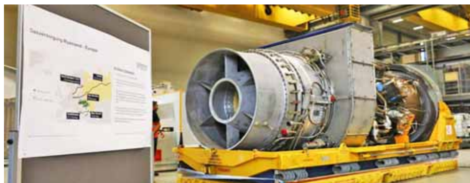
El volumen diario del gas a Europa ha disminuido hasta el 20 por ciento

T/ Redacción CO-Rusia Today-Sputnik-HispanTV