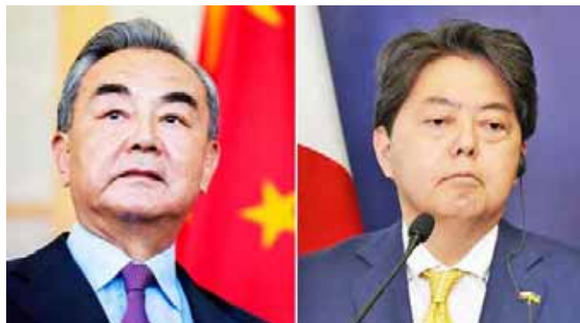
La Cancillería del gigante asiático considera injustas las acusaciones del G7

La vocera de la Cancillería china, Hua Chunying, advirtió que si el grupo no cambia su postura “errónea” sobre Taiwán su país puede reconsiderar su actitud sobre el diálogo con el grupo