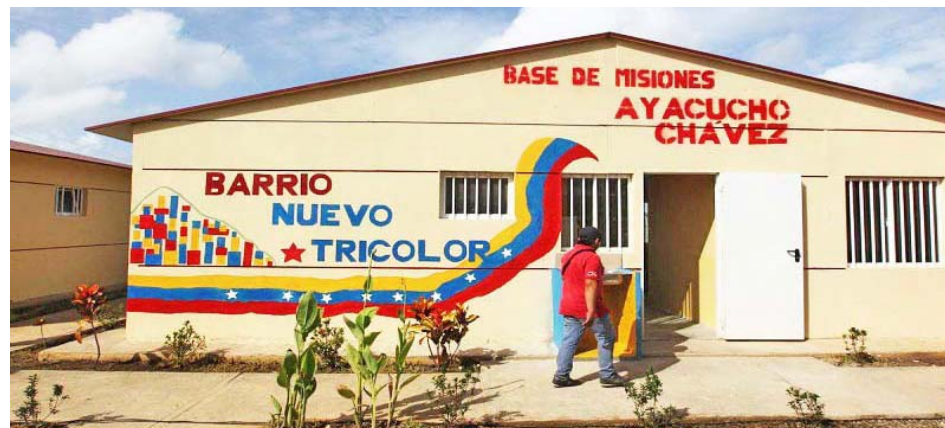
Esta obra ha ayudado a miles de venezolanos y venezolanas

Ayer este plan social arribó a un nuevo aniversario, por ello el Jefe del Estado manifestó en su cuenta de Twitter: “Celebramos nueve años de acompañamiento amoroso, compromiso y trabajo, traducido en el Sistema Nacional de Misiones y Grandes Misiones Socialistas. Estoy seguro que vamos a