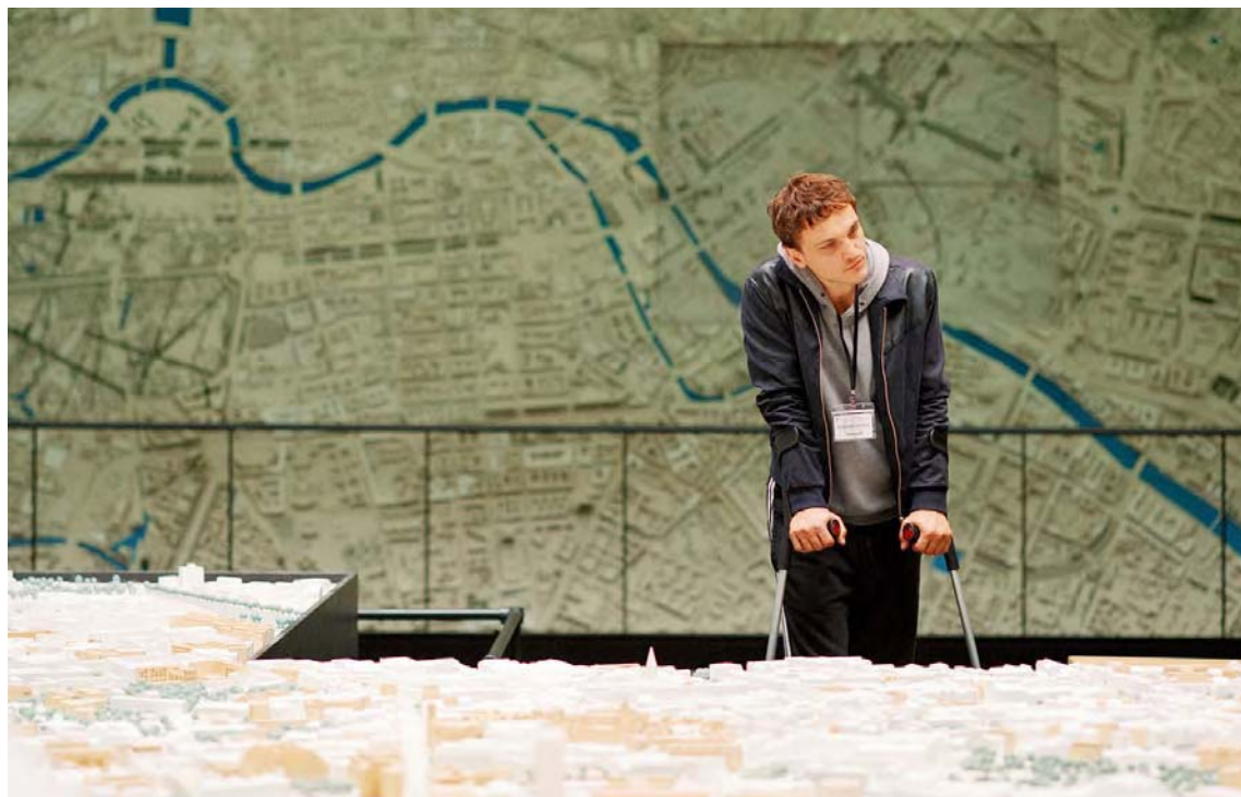
Ficción y documentales tendrá esta edición

En la plataforma digital "Goethe on Demand" (festivalaleman.goethe-on-) estarán de modo gratuito a nivel nacional los títulos: Un país libre (2020), una historia policiaca en el marco de la reunificación alemana, Coup (2019), un "mockumentary" sobre un robo de banco multimillonario y Futuro III (2019), un debut en la Berlinale digno de la Generación Z, una reflexión sobre la identidad sexual y la migración. Se le unen también los documentales Casi perdimos Bochum: la historia de RAG (2019) y Lene y Los espíritus del bosque (2020), el primero centrado en el fenómeno del rap alemán de la década de los 90 y el segundo con el bosque bávaro como