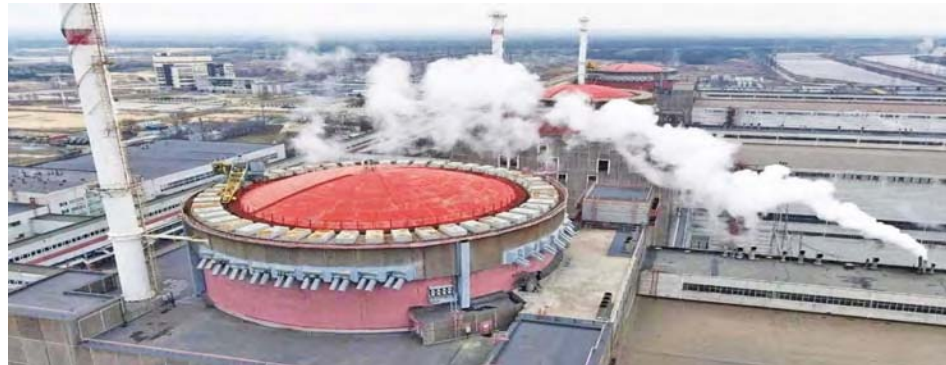
“Al atacar la planta de Zaporíyia Ucrania se está dedicando al terrorismo nuclear”

“Si continúan las acciones irresponsables de Kiev contra la planta nuclear de Zaporíyia esto podría terminar en un desastre”, alertó el vocero de la Cancillería rusa, Ígor Vishnevetsky, quien dijo que las autoridades de su país se esfuerzan para que el organismo de energía atómica visite estas instalaciones lo más pronto posible