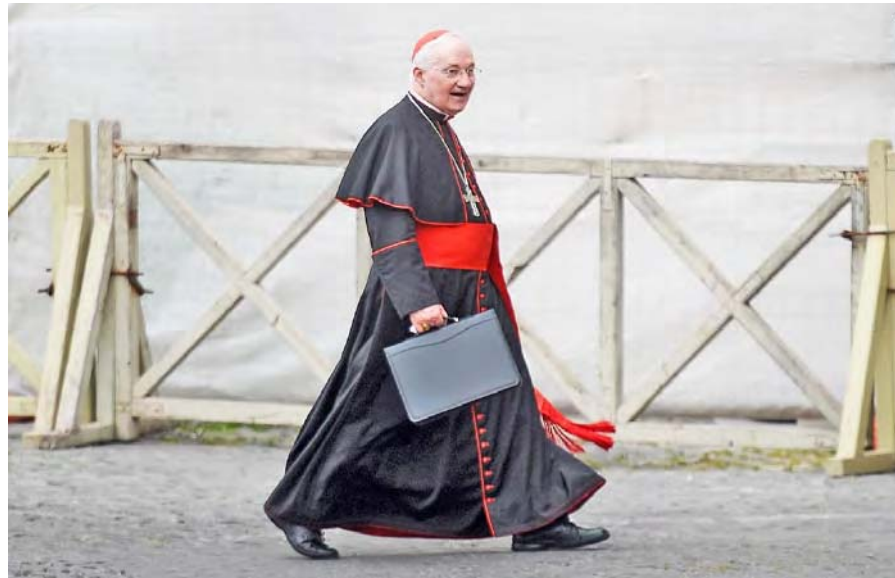
Cardenal Ouellet habría agredido sexualmente a una joven cuando era obispo

El nombre de este cardenal engrosa la lista de una demanda publicada ayer en Canadá que involucra a más de 80 miembros de la Diócesis de Quebec.