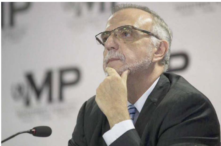
Gustavo Petro designa a Iván Velásquez como ministro de Defensa

una idea, (Iván) Duque tardó cuatro meses en aplicar sus ajustes militares para infiltrar unidades uribistas neonazis, en diciembre de 2018, mientras que Petro decide hacer esa intervención en el día seis de su administración.