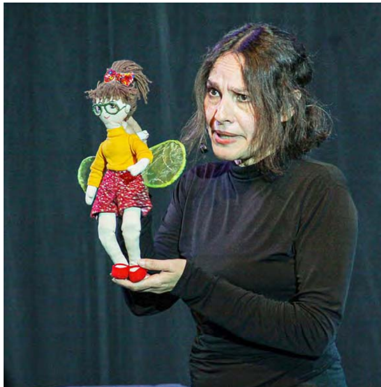
Colmenares sabe llegar al público infantil

El eje infantil tendrá para hoy las siguientes actividades: 11:00 am, Erase una vez América por Títeres Tuqueque; 12:00 m, Cuenta cuentos El Timbique , a cargo de Nervic Bandres Cofae; 1:00 pm, El pequeño aventurero , Circo Nacional de Venezuela; 2:00 pm, Fábulas y fabulosas mascotas , Grupo de Teatro Rayos y Centellas; 3:00 pm, Panchito Mandefuá , Teatro Tracodra y 4:00 pm, el mago Charlie.