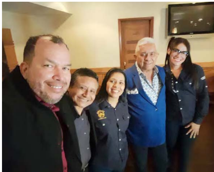
Armas compartió con la directiva de Avinpro

T/ Eduardo Chapellín