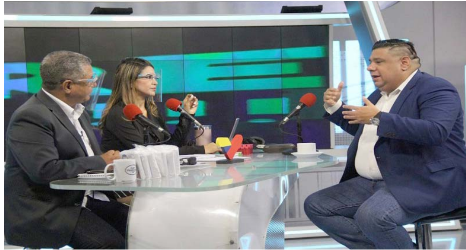
Recuperación de escuelas es un proceso permanente, aseguró Santander

T/ Leida Medina Ferrer