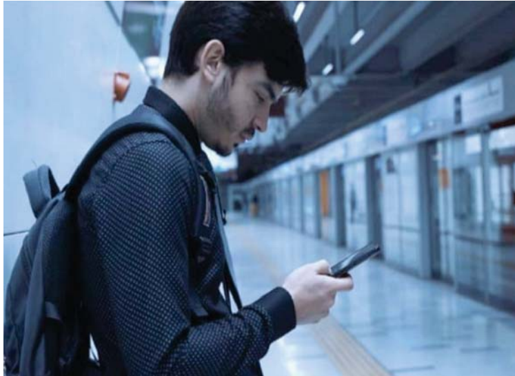
La venezolana Chilena Escisión , de Luis Rojas España, forma parte del cartel

En la selección oficial de largometrajes participan cintas de ocho países. Entre los elegidos compiten seis ficciones, cuatro documentales y una animación. En los próximos días la directiva del Festival anunciará los títulos que tendrán funciones especiales.