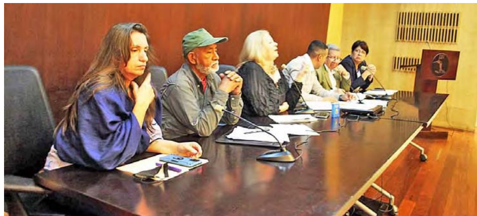
El objetivo de la ley es regular la relación de este sector laboral, señaló Chacón

T/ Leida Medina Ferrer