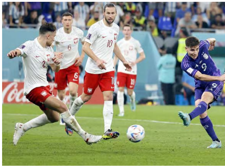
Argentina se fajó y pasó de primero en su grupo C.

Los “gauchos” jugaron mejor y tuvieron varias oportunidades en el partido. Una fue desperdiciada por Lionel Messi, cuando falló un penal, siendo Szczesny el epicentro del encuentro, tras