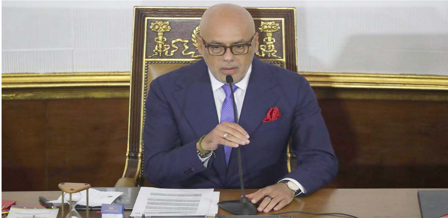
El diputado Jorge Rodríguez durante su discurso en la AN

“A esta hora exacta de la vida de esta República, nosotros tenemos que decretar la victoria absoluta del pueblo contra la maldad, a esta hora exacta debemos celebrar la victoria de la paz”, afirmó el presidente del Poder Legislativo