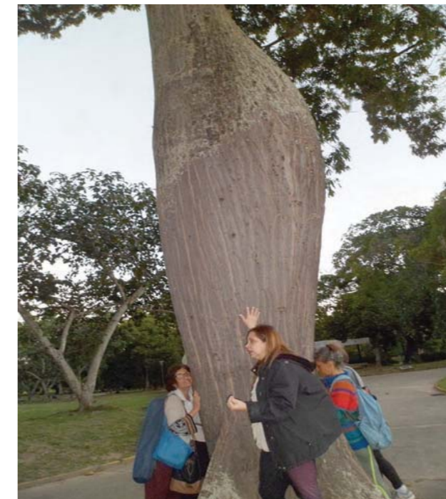
En la ceiba pentandra

Una de las peculiaridades y atractivos del parque, a menudo desconocidas por los visitantes, son las llamadas “manchas botánicas”, con diez, doce, catorce, árboles de la misma especie, lo cual permite observar un árbol joven, otro maduro, uno recto, torcido, enfermo.