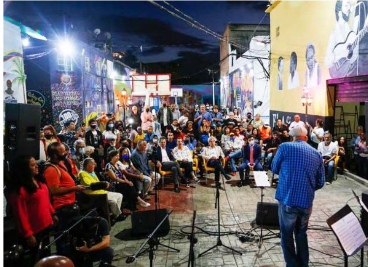
Participarán integrantes de las legendarias bandas Desorden Público y Amigos Invisibles