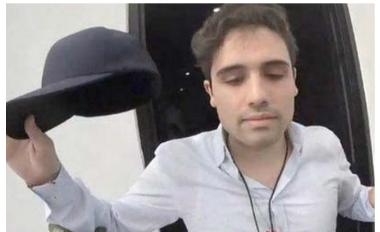
Ovidio Guzmán había sido capturado en 2019

Antes de la detención de Ovidio Guzmán, en Culiacán se registraron tiroteos, narcobloqueos y enfrentamientos entre los integrantes del narcotráfico y las autoridades de seguridad, lo que ocasionó la suspensión de las clases y actividad administrativa.