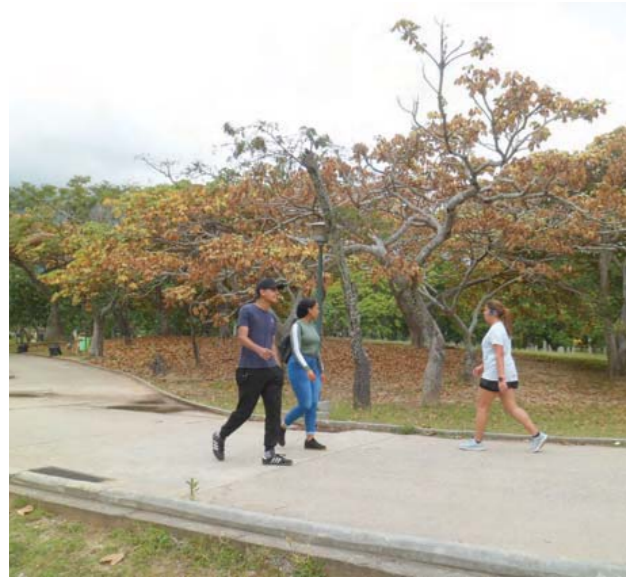
El parque es un lugar magnífico