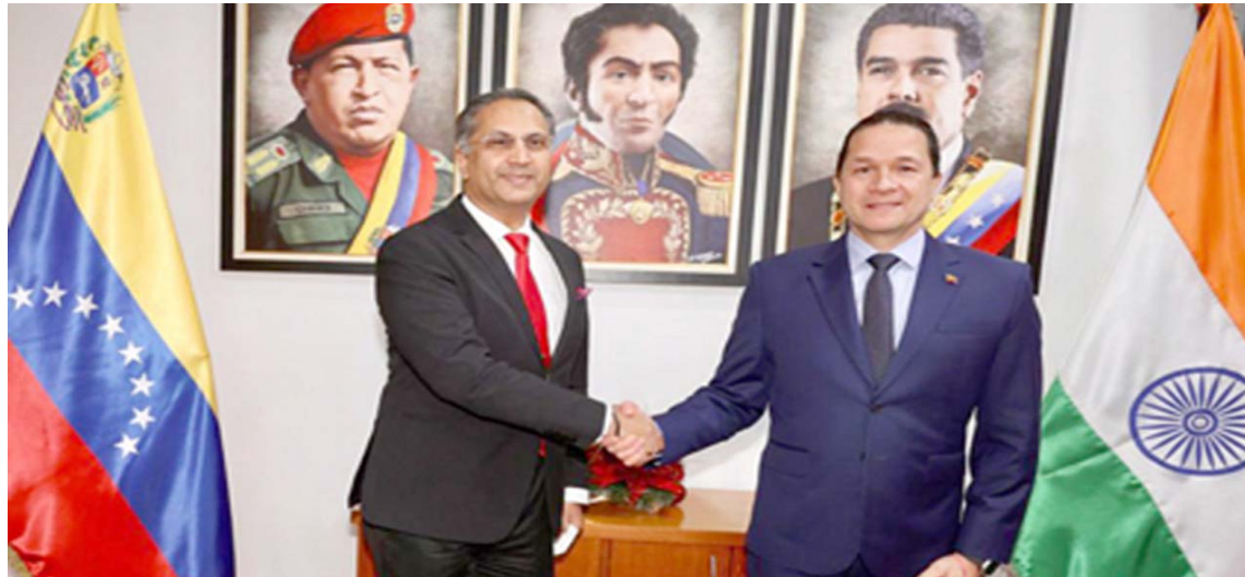
El Canciller Carlos Faría y el embajador de la India Abhishek Singh revisaron los planes conjuntos en desarrollo

Así lo infirmó el titular de Exteriores venezolano en su cuenta en Twitter donde señaló que el encuentro se llevó a cabo cumpliendo los lineamientos del presidente de la República, Nicolás Maduro Moros, y bajo los principios de la Diplomacia de Paz. “Iniciamos este 2023 con