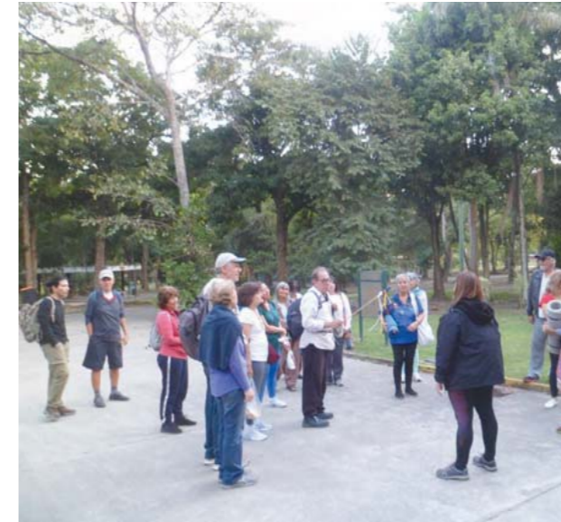
Grupo de Caminata Consciente