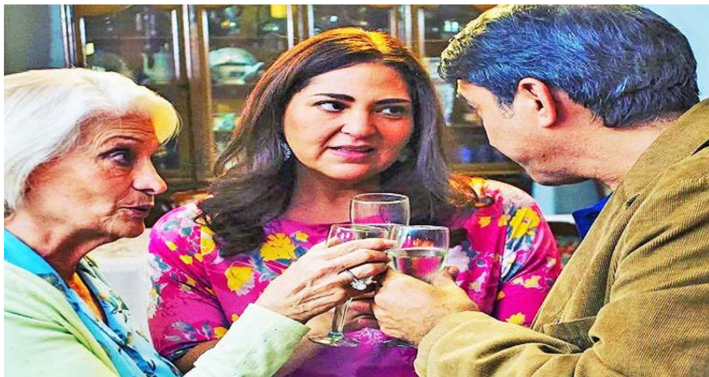
Qué buena broma, Bromelia abrió los estrenos vernáculos el año pasado

En tal sentido, CNAC cerró el año 2022 con la aprobación de 93 proyectos que reciben apoyo financiero para su realización, por medio del programa de Estímulo y Fomento a la Producción Cinematográfica, plan que completó un registro de 157 postulaciones para las diferentes categorías de su convo-