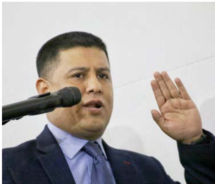
Activarán las Brigadas de Acción 256 para llegar a más parroquias, informó Infante

T /Leida Medina Ferrer F/ Prensa AN Caracas