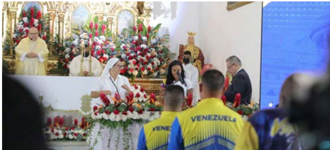
La Misa del Deporte fue muy emotiva