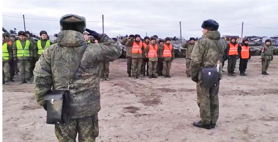
La liberación de los militares fue resultado de las intensas negociaciones

Como resultado de un intercambio de prisioneros con Ucrania, ayer un total de 50 soldados rusos que había caído presos fueron liberados, mientras en Kiev confirmó que recibieron a 50 militares, informó el Ministerio de Defensa de Rusia, reseñó el portal de Telesur.