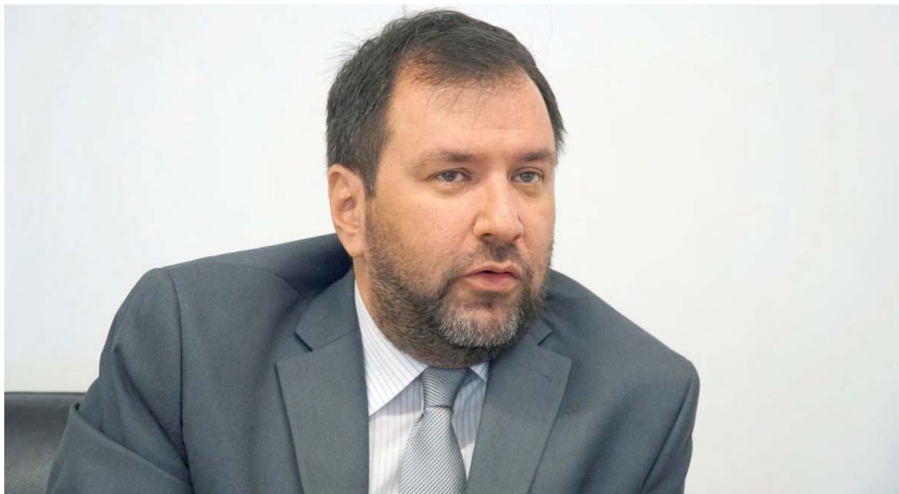
El canciller dijo que si EEUU defendiera la democracia venezolana levantaría las sanciones

El diplomático Nichols, quien fue embajador de EEUU en Perú en 2014, en su mensaje defiende las acciones de la integrantes comisión de la extinta Asamblea Nacional que bajo la figura del supuesto