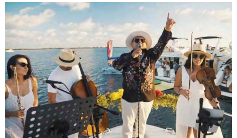
El guariqueño tiene 20 años de carrera