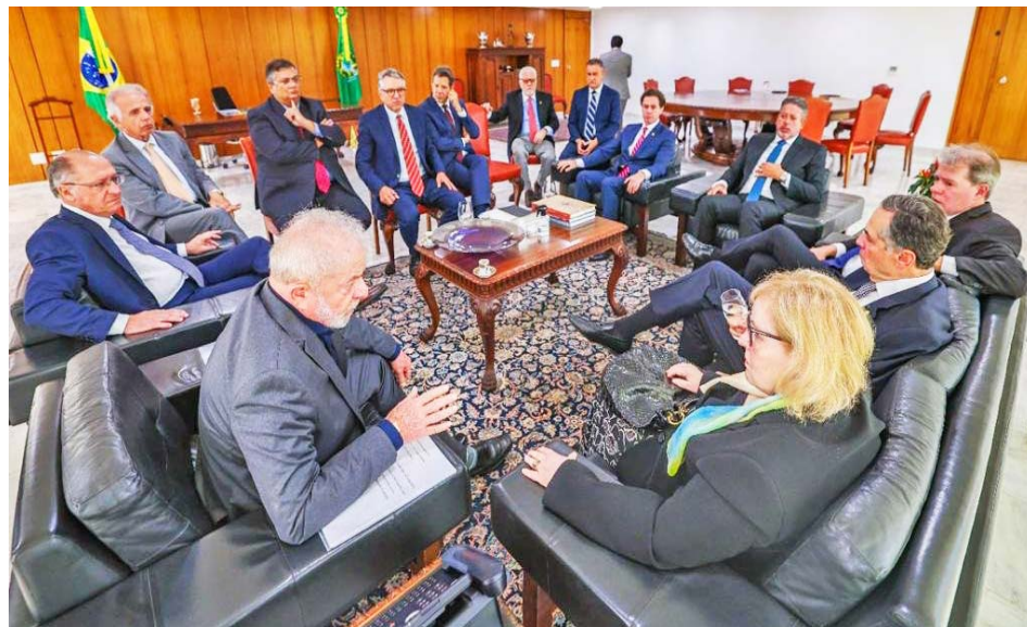
Lula sostuvo reunión con presidentes de las instancias públicas

Además de Lula, suscribieron el contenido Arthur Lira, titular de la Cámara de Diputados; y Veneziano Vital do Rêgo, en ejercicio del Senado Federal; y minis-