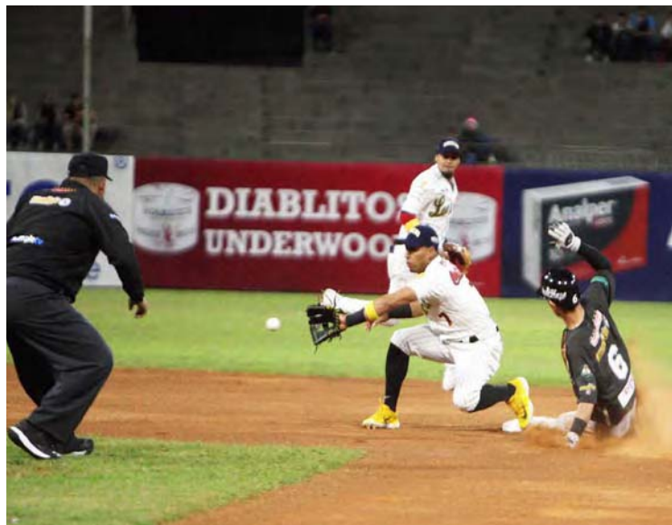
Otsuka fue una pesadilla en las almohadillas

- Yo vi que cada uno de los peloteros trabajó ade-