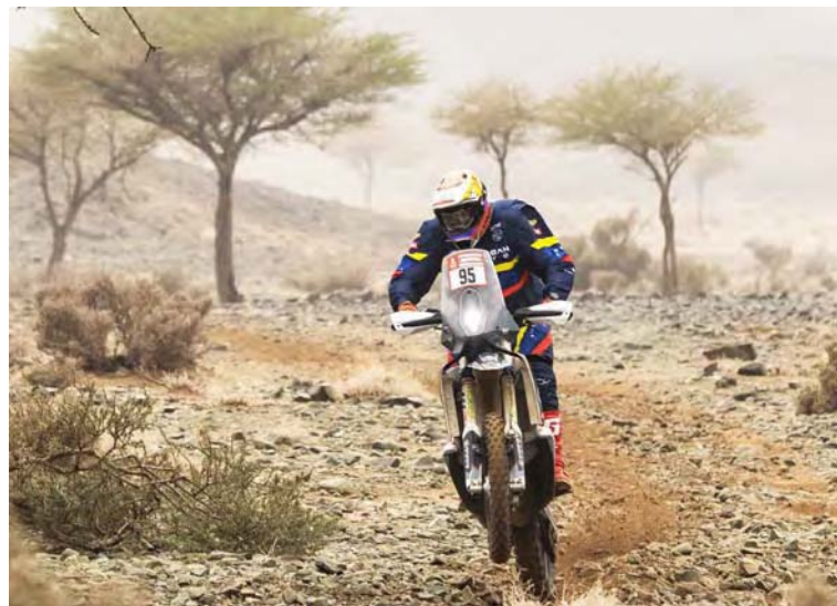
La justa ha sido muy exigente para todas las categorías