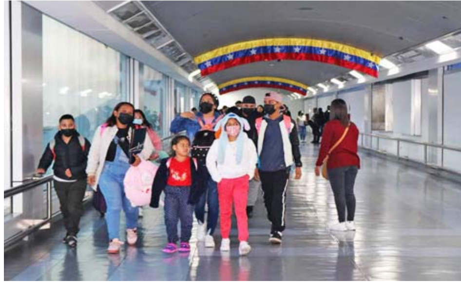
Repatriados están agradecidos y contentos de volver al país

El viceministro de Relaciones Exteriores para América Latina y el Caribe, Rander Peña, fue el encargado de recibir en nombre del Presidente de la República Bolivariana de Venezuela, Nicolás