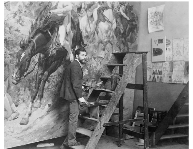
El certamen llega este año a su edición número 65

En el documento deberán completar los datos e información solicitada, adjuntar la copia de cédula de identidad, la ficha técnica de la obra y un resumen curricular ac-