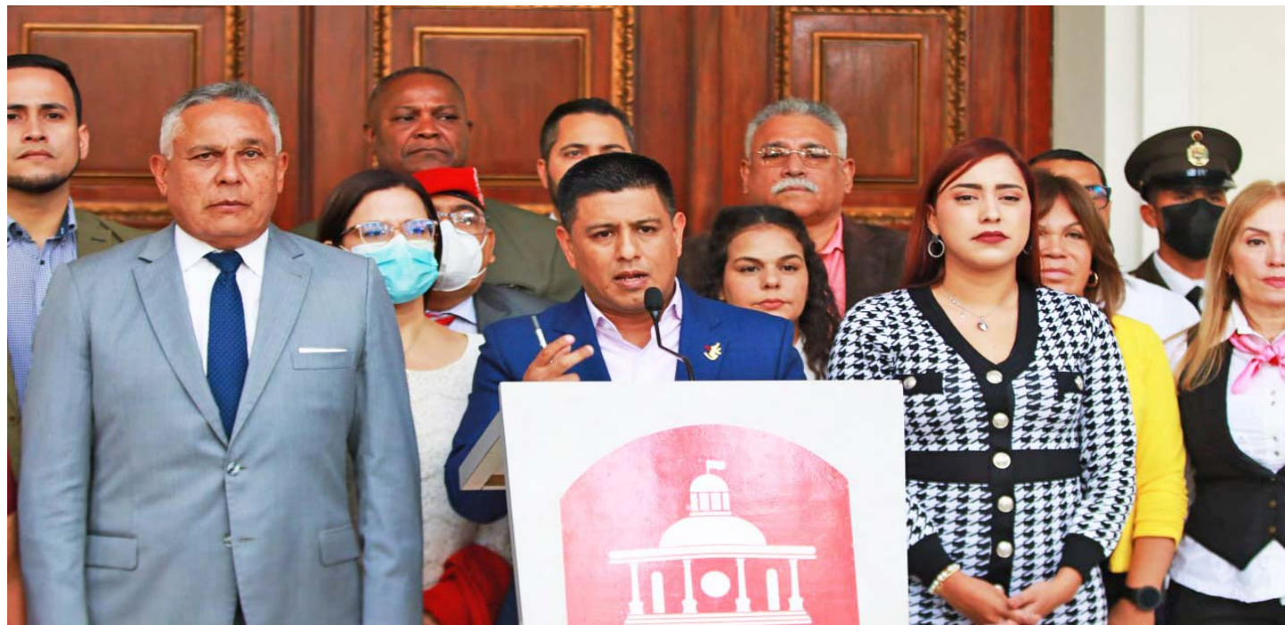
Designada Comisión para crear método para la consulta pública de las leyes, informó Infante

Apuntó que se trata de un intercambio bidireccional, que las leyes aprobadas en primera discusión lleguen a las comunidades y organizaciones sociales todo el territorio nacional, “para retroalimentarnos”.