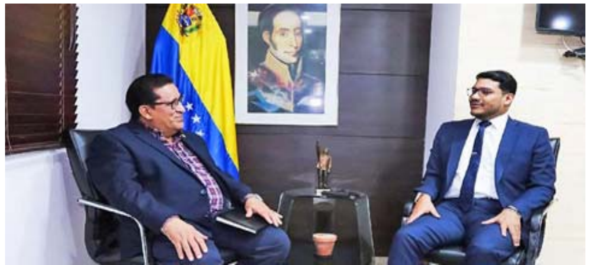
El viceministro para América Latina y el embajador de Nicaragua se reunieron en la Casa Amarilla

T/ Redacción CO- Prensa Mppre