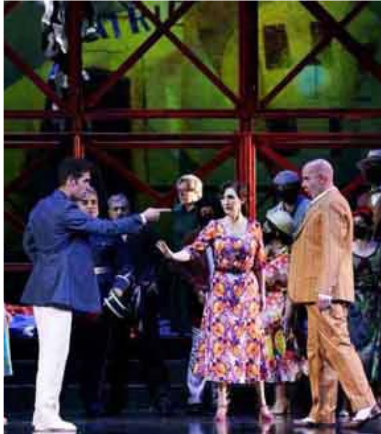
Los Gavilanes, fue una de las zarzuelas en las que participó de manera recurrente

“Así logré tres propósitos en uno: estudiar en una afamada escuela de diseño, tener un abono en la Scala y poder visitar diferentes teatros y nutrirme con la estadía de tres maravillosos años de toda la