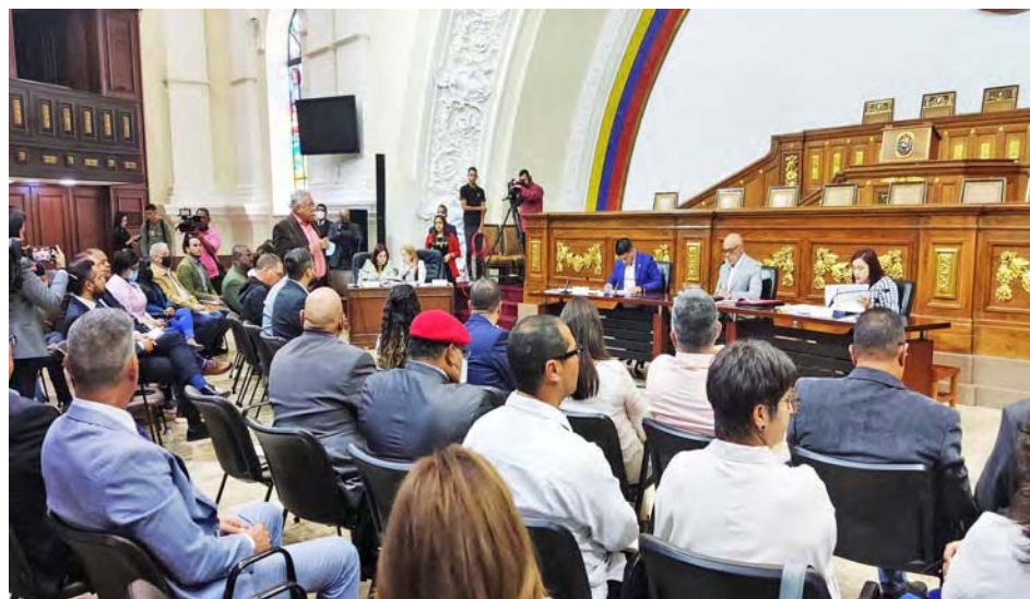
Durante la reunión de la Comisión Consultiva