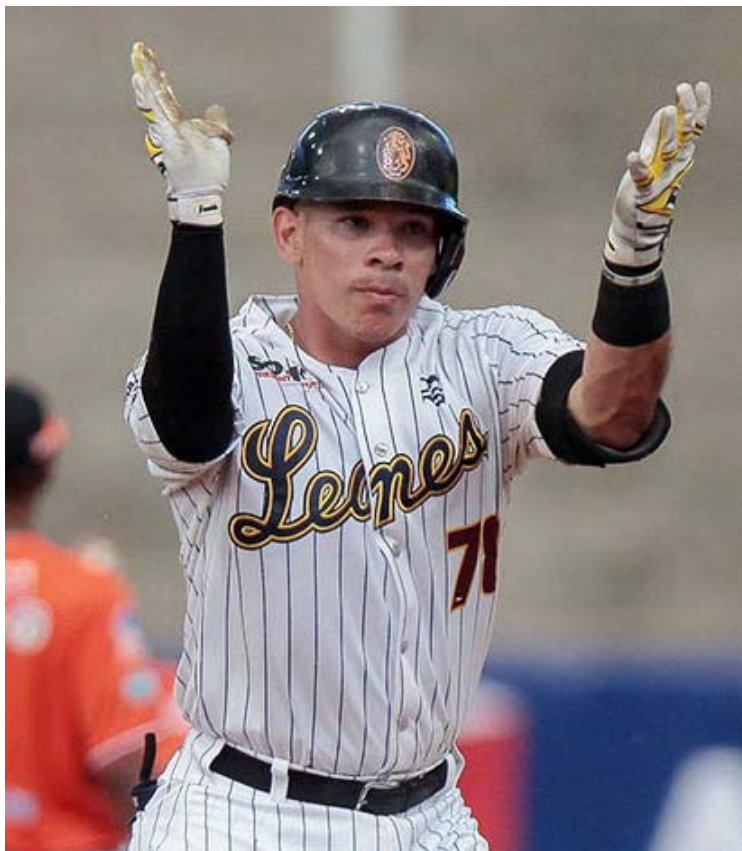
El guayanés fue una grata sorpresa para los caraquistas