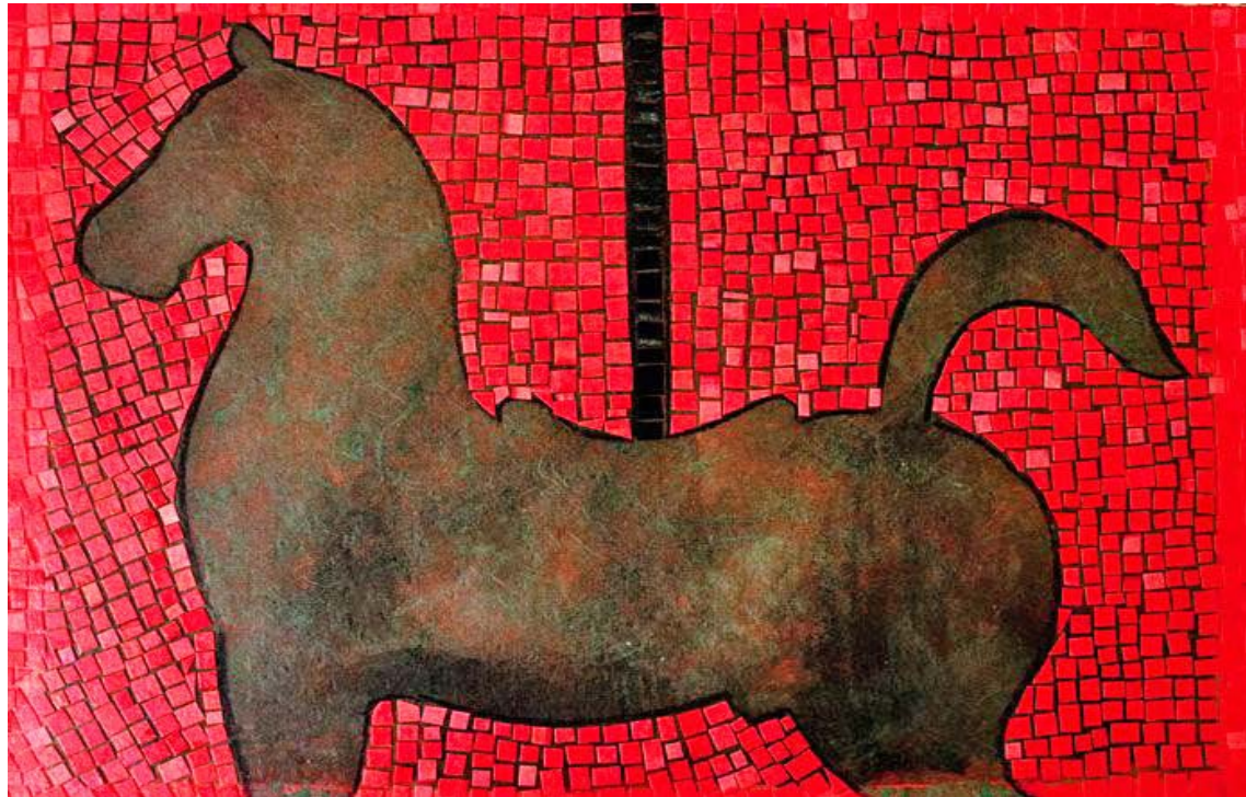
Más de un centenar de obras conforman la exhibición