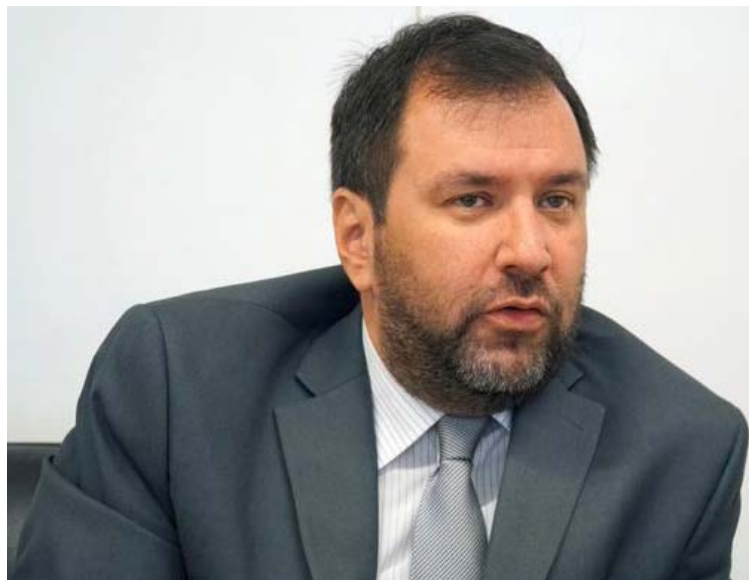
De “hipócrita” calificó el canciller Yván Gil el comentario difundido por el funcionario estadounidense

Al respecto, el Canciller venezolano condenó el comentario