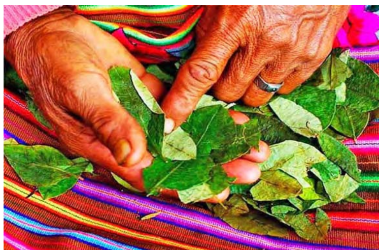
La legislación de la nación altiplánica protege los rituales en torno a la planta

Destacó la titular que esa planta es símbolo de identidad de los pueblos indígena originarios de Bolivia, parte de los rituales religiosos, agrícolas y está presente en la lucha por las reivindicaciones sociales desde antes de la llegada de