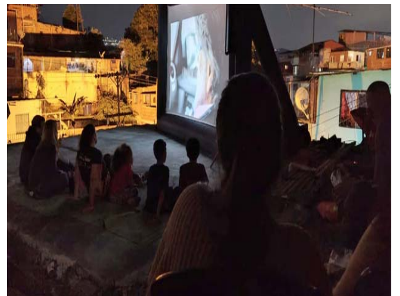
La comunidad pasa un grato momento en sus espacios

El estar sentado frente a una pantalla situada en un lugar no convencional, comienza cuando la gente de Zona de Descarga observa el espacio donde se va a montar la actividad y comienza a precisar dónde se puede colocar estratégicamente la laptop, las respectivas cornetas, un proyector de baja gama y una pantalla inflable, para que luego pueda llegar a la gente de determinada comu-