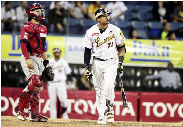
El quisqueyano es un bate oportuno

Esté el público o no a favor de él y su equipo, “siempre voy concentrado en el juego.