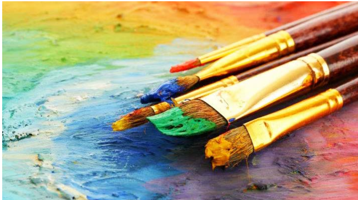
El certamen estará abierto para venezolanas residiendo o no dentro del país

En una nota de prensa emitida por la CAF se informó que, en el contexto de la convocatoria, se prepararon tres encuentros los días 2, 8 y 16 de febrero con destacados curadores e investigadores. Durante estas actividades está previsto proponer la reflexión y abrir la discusión sobre el arte contemporáneo y el importante aporte de las artistas mujeres en las artes visuales del país.