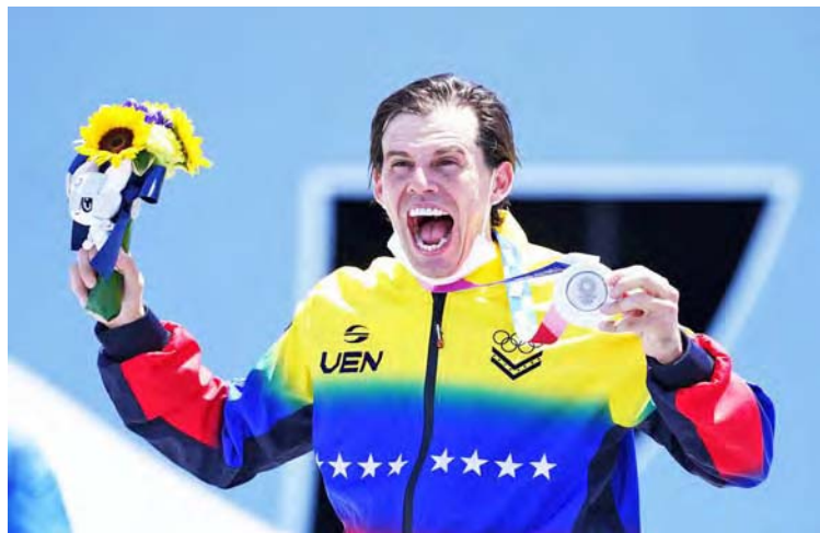
El caraqueño tiene una agenda muy apretada este 2023

Explicó que el ranking de su disciplina es un poco complejo, “pero si este año me va bien y el que viene me va mal, pudiera entrar inclusive por el ranking.