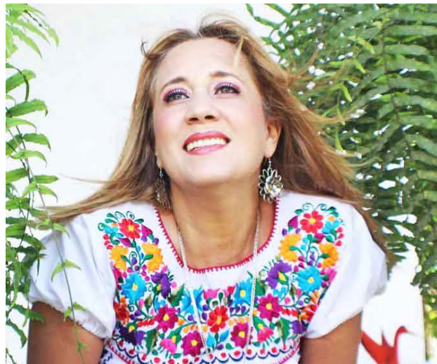
Es voz del dueto Pumarosa y de la agrupación Vasallos de Venezuela