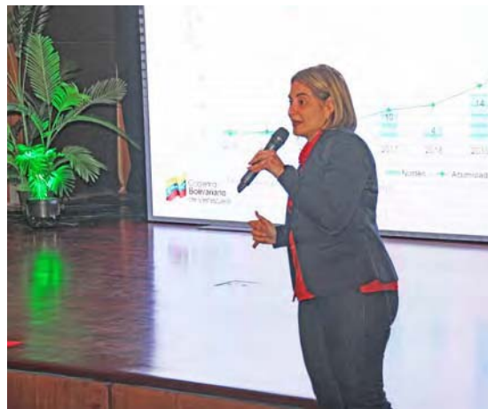
La ministra Jiménez dio una clase magistral

En su ponencia, resaltó que la iniciativa nació hace “más de 25 años cuando los campesinos del páramo de Mucuchíes vienen reflexionando sobre la necesidad agroalimentaria y la soberanía desde