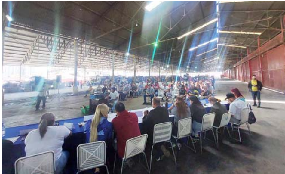
Más de 1800 personas participaron en la consulta

Once parroquias caraqueñas donde funcionan estos mercados participaron en la actividad que reunió a voceros comunales, comerciantes y concejales, y