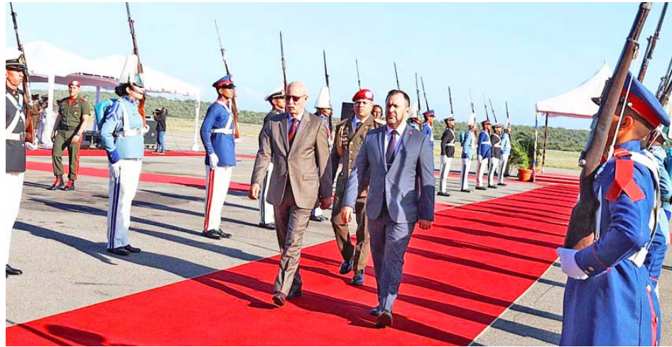
Canciller Gil y presidente Ghali a su llegada a Venezuela