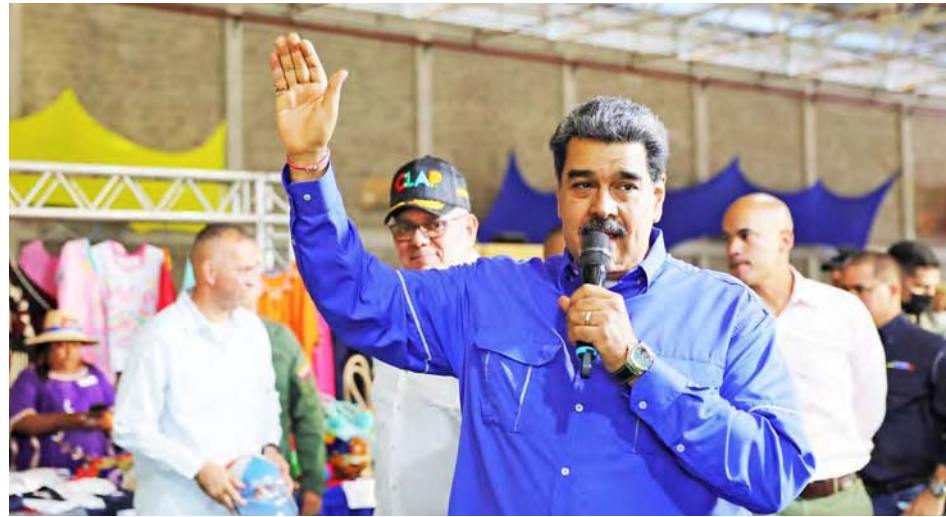
El presidente Maduro quiere un CLAP con más aportes alimenticios

A través de un enlace televisivo a la Planta de Nutrichicha El Gigante Chávez, ubicada en San Juan de los Morros, estado Guárico, el Mandatario constató la elaboración de los productos derivados, a saber nutritivo, nutritivo-