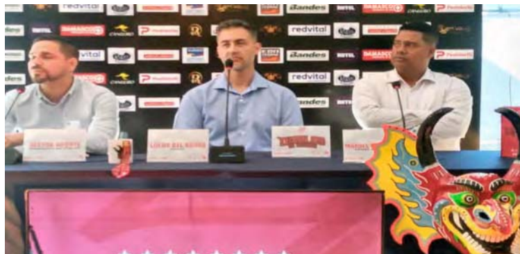
La directiva cree en el talento joven mirandino

T/ Eduardo Chapellín