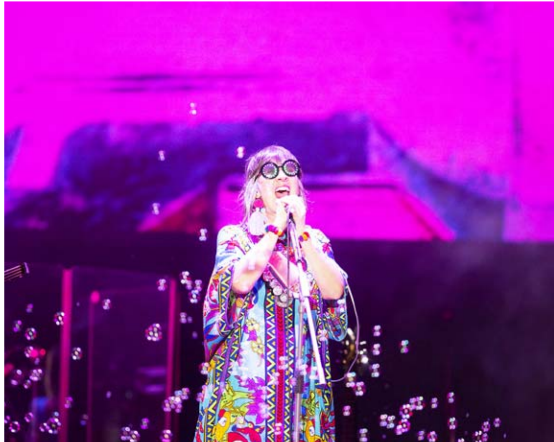
Interpretaron sus temas más exitosos

La vocalista y compositora explicó que si bien el público de la banda sigue siendo aquel sector que hoy está rondando los 50 años, también se han