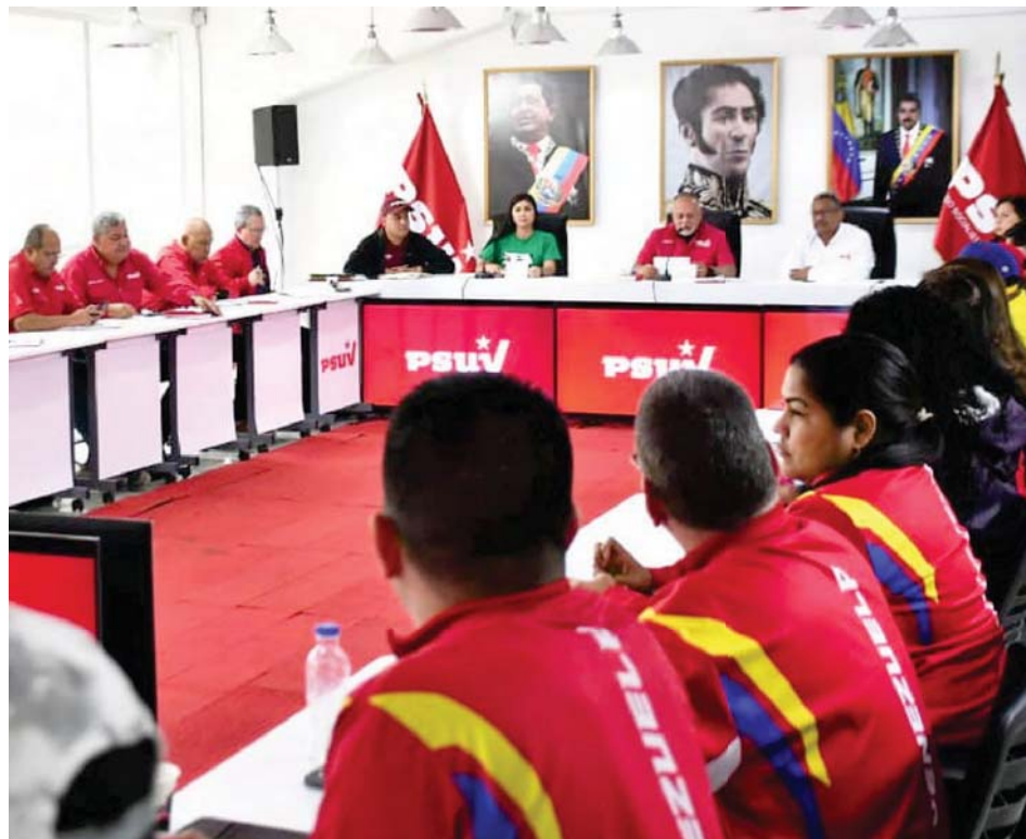
Con la Constitución del 99 se acabaron las vacas sagradas, destacó Cabello

Sobre la lucha contra la corrupción, subrayó que siempre ha sido una de las banderas de la Revolución Bolivariana. “Nunca antes en un periodo de Venezuela se ha denunciado la corrupción como se ha hecho con el comandante (Hugo) Chávez y el presidente Nicolás Maduro”.