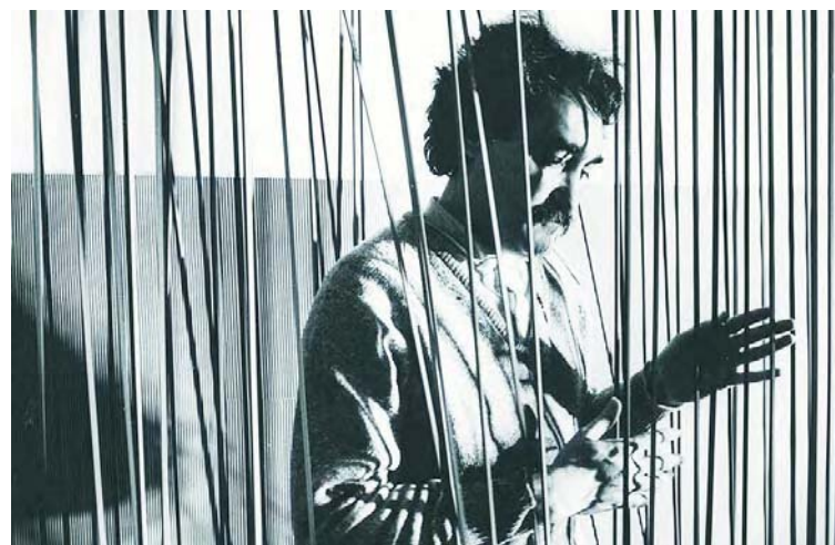
La exhibición estará disponible desde el sábado próximo

“El universo está lleno de una vibración poderosa y a través de los elementos que uso, muy simples, busco que la gente se sienta inmersa en ella”, cita el Ministerio del Poder Popular para la Cultura al Maestro Soto mediante una nota de prensa publicada en el portal, con la intención de explicar de manera simple, clara y contundente los principios básicos de la obra de este insigne artista.