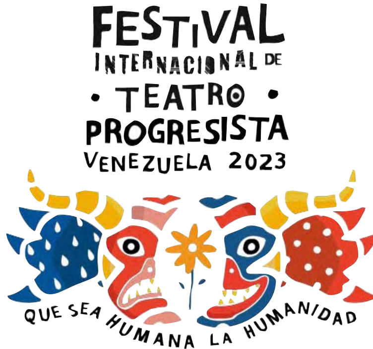
En la entidad occidental las funciones serán gratuitas

De acuerdo a la publicación, el 12 de junio el grupo local Mambrú Teatro presentará su montaje de la obra A las mujeres le queda bien hablar a solas , en el Auditorio Torre Mara. Para el día miércoles 14, la agrupación Compañía Do Chapito, representantes de Portugal en esta fiesta de