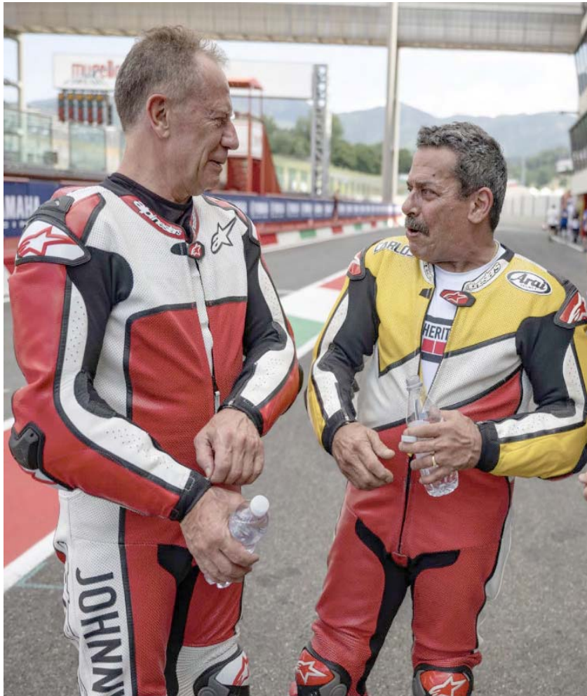
Cecotto y Lavado son historia viva del motociclismo nacional

La icónica serie TZ festejó su medio siglo, mientras 25 la serie R1