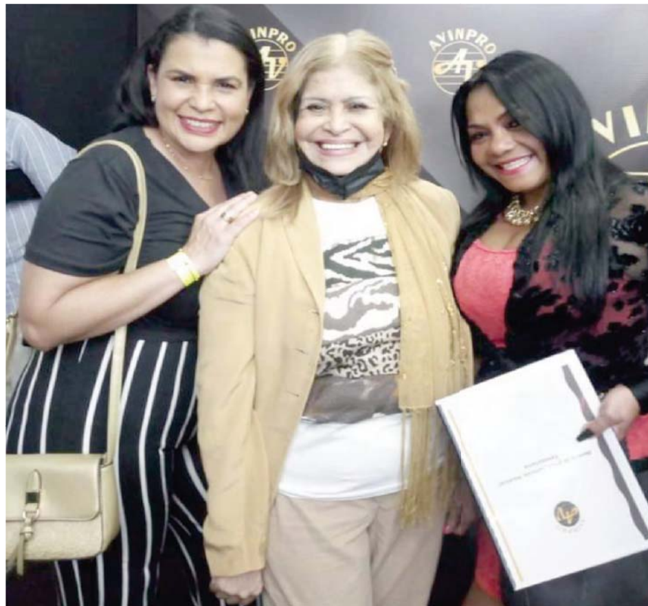
Lucero tiene muchos seguidores en Venezuela y Colombia

Y prueba de que Lucero está siempre activa, es que participará en la celebración del Festival de las Tradiciones 2023, en homenaje al Doctor José Gregorio Hernández, este sábado 29 de julio a partir de las cuatro de la tarde en el marco de una transmisión completamente en vivo por Venevisión, desde la emblemática Plaza Diego Ibarra, en el centro Caracas.