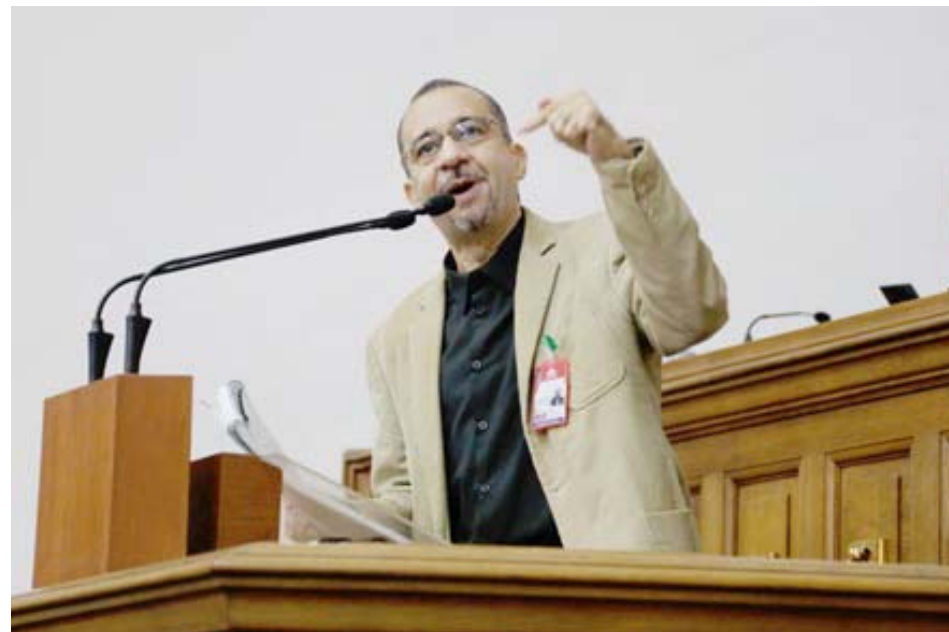
Venezuela puede aportar en materia de energía, destacó Chávez

Sobre su asistencia al encuentro de partidos políticos del Brics, realizada recientemente en Johannesburgo, Sudáfrica, Chávez comentó que el Partido Socialista Unido de Venezuela (PSUV) fue