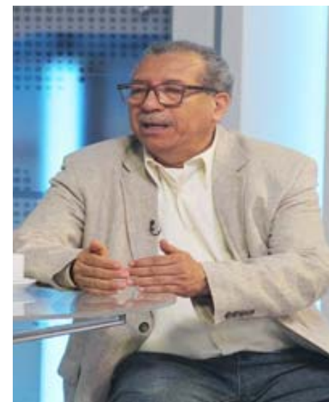
Conducta de opositores apunta al desconocimiento del proceso electoral, destacó Ortega

En ese sentido, enfatizó que desde ya se pronostica el fracaso, “el pueblo de Ve-