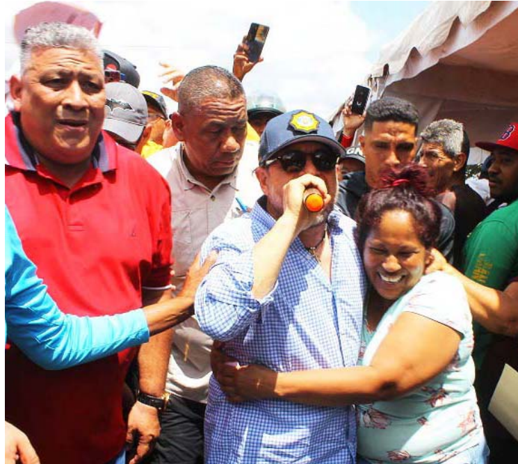
La jornada incluyó actividades recreativas

“Aquí estamos en esta macro mega jornada para todos los transportistas del estado Carabobo, con cada uno de ellos dándole apoyo social, apoyo de salud, medicinas, herramientas para su actividad económica, sillas de rueda, bastones, andaderas, estamos entregando antibióticos, antihipertensivos, anticonvulsivos, y medicinas de todo tipo, tenemos todas las especialidades médicas para todos los transportistas y sus familiares, esta instrucción dada por el presidente de la República ha generado una gran y masiva participación, gracias Presidente por apoyarnos, gracias Presidente por apoyar el transporte y le agradecemos también al órgano superior del transporte de todo el estado”, afirmó.