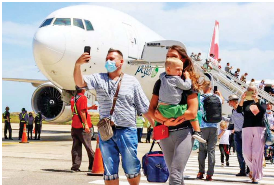
Turistas rusos visitan la isla de Margarita

Indicó que 2023 ha sido un año exitoso en materia turística y que este mes empiezan a llegar turistas españoles a Margarita y en noviembre se sumarán los visitantes polacos